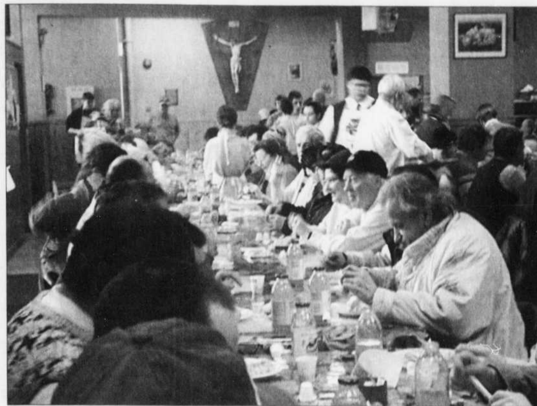
L'Accueil Bonneau a été fondé et est toujours dirigé par des représentants des communautés religieuses.

En 1998, l'organisme mettait même sur pied la première École de la rue au Québec. Fondé par sœur Cécile Girard, le projet de formation a été jusqu'à présent fréquenté par 170 jeunes et a permis à 27 d'entre eux de terminer leur secondaire. Fier des résultats obtenus jusqu'à présent, Michel