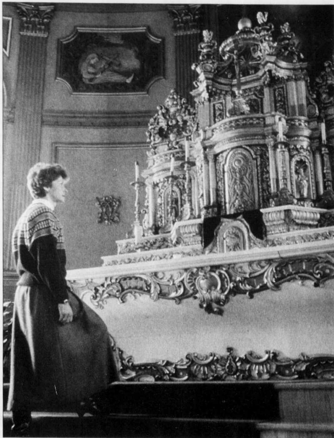
Pour diffuser la parole de Dieu, le diacre prononce des homélies ou participe à des groupes de partage de l'Évangile. Il assiste le prêtre dans la liturgie, il peut faire des célébrations de la parole, baptiser et bénir les mariages.