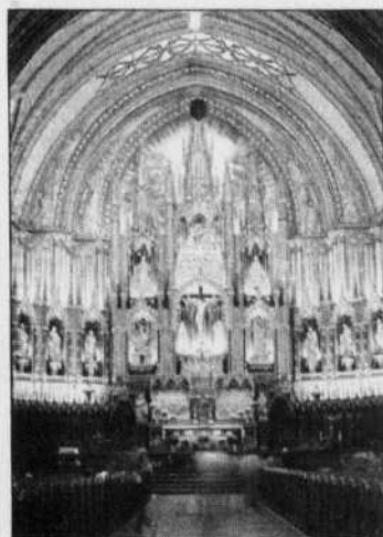
L'église Notre-Dame, dans le Vieux-Montréal.

Cet état de fait semble, au Canada du moins, partagé par l'ensemble des religions. Statistique Canada, toujours friande de tendances sociales, rapportait à l'hiver 2000 le déclin spectaculaire de la pratique religieuse régulière au Canada ces 50 dernières années et faisait état que le pourcentage de la population s'adonnant à un tel rituel était passé de 67 % en 1946 à 22 % en 1998 alors que seuls 5 à 10 % des catholiques canadiens se rendraient à l'église de façon régulière. Au cours de la dernière décennie,