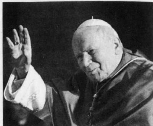
REUTERS Le Troisième Congrès sur les vocations aura lieu à Montréal à l'invitation du pape Jean-Paul II.

Selon l'abbé Lafontaine, il y a des avantages et des désavantages à vivre dans un continent riche. «Les jeunes ont tous les choix, dit-il, et les valeurs véhiculées en société sont le matérialisme et l'individualisme. Dans pareil contexte, faire le choix d'une vie consacrée à une vocation n'est pas évident. D'autant plus que le choix d'une vocation ne se compare pas au choix d'une profession. Le choix d'une vocation est un choix de vie qui engage l'être tout entier et c'est un engagement permanent. Beaucoup de jeunes ne croient tout simplement pas à la possibilité de permanence.»