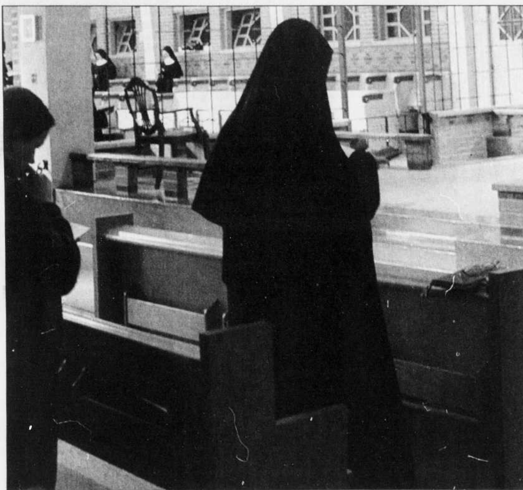
Le profil des aspirantes à la vocation religieuse a changé.

Le profil des aspirantes à la vocation a changé. Elle le décrit: «Elles n'arrivent plus à 20 ans, mais lorsqu'elles sont plus âgées. Elles possèdent une expérience de vie, elles ont parfois formé un couple et été propriétaires de leur maison. Elles sont habituées à vivre en dehors de leur famille et ont reçu une formation professionnelle. Leur personnalité est plus articulée que dans le passé. Elles sont plus matures et autonomes.» Sœur Létourneau croit que pour accéder à une telle vocation, les qualités de base sont les suivantes: «Il faut aimer les gens. Il ne faut pas avoir peur d'aller jouer dans la circulation, d'aller trouver les gens chez eux. On est en train de passer d'une Église de bâtisse à une Église de rue. En même temps, il importe d'avoir une qualité de vie intérieure tout en étant capable de fonctionner en groupe. Actuellement, les reli-