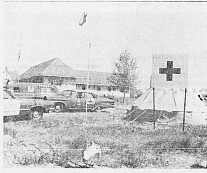
La photo ci-haut démontre un poste d'urgence situé sur le terrain du Motel Sainte-Adèle sur la route 11. Ce poste était dirigé par le personnel de la Base d'Aviation du Lac Saint-Denis qui a monté la garde 24 heures par jour pour répondre aux appels d'urgence éventuels qui auraient pu survenir durant cette longue fin de semaine de la Fête de la Reine.