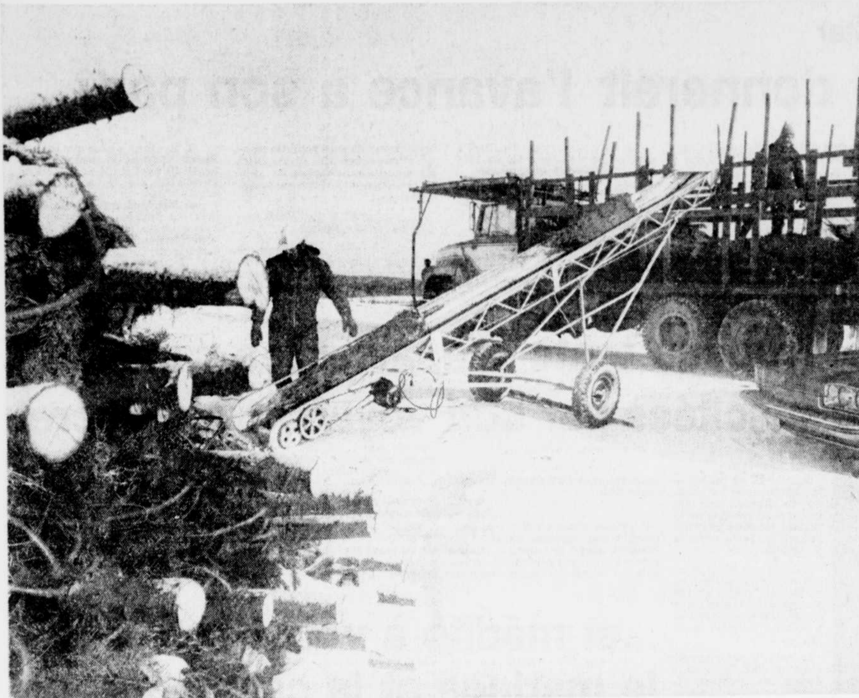
Les trois quarts de la production québécoise d'arbres de Noël sont exportés aux Etats-Unis et au Venezuela.