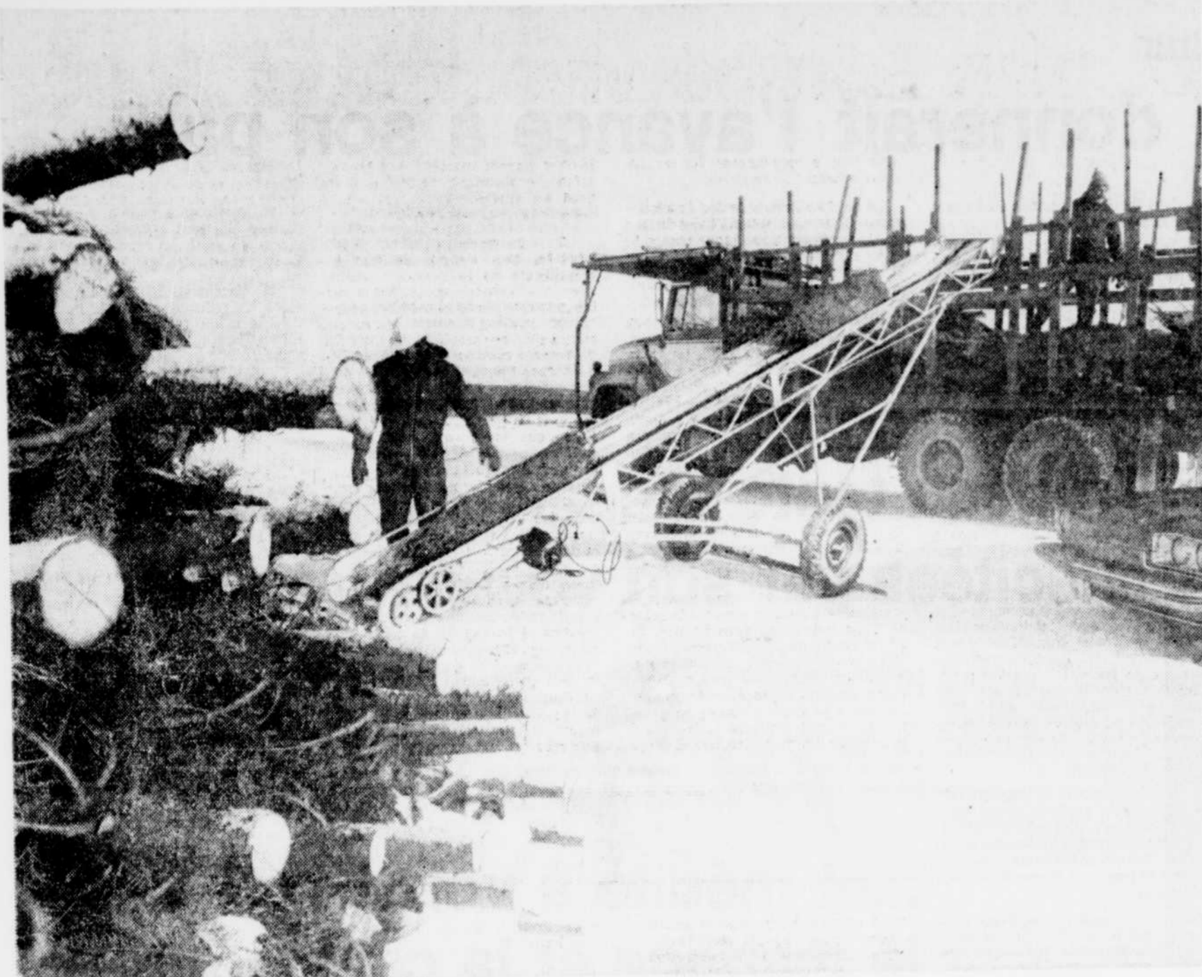
Les trois quarts de la production québécoise d'arbres de Noël sont exportés aux Etats-Unis et au Venezuela.

Thetford-Mines · Plessisville · Mégantic · Baie-Saint