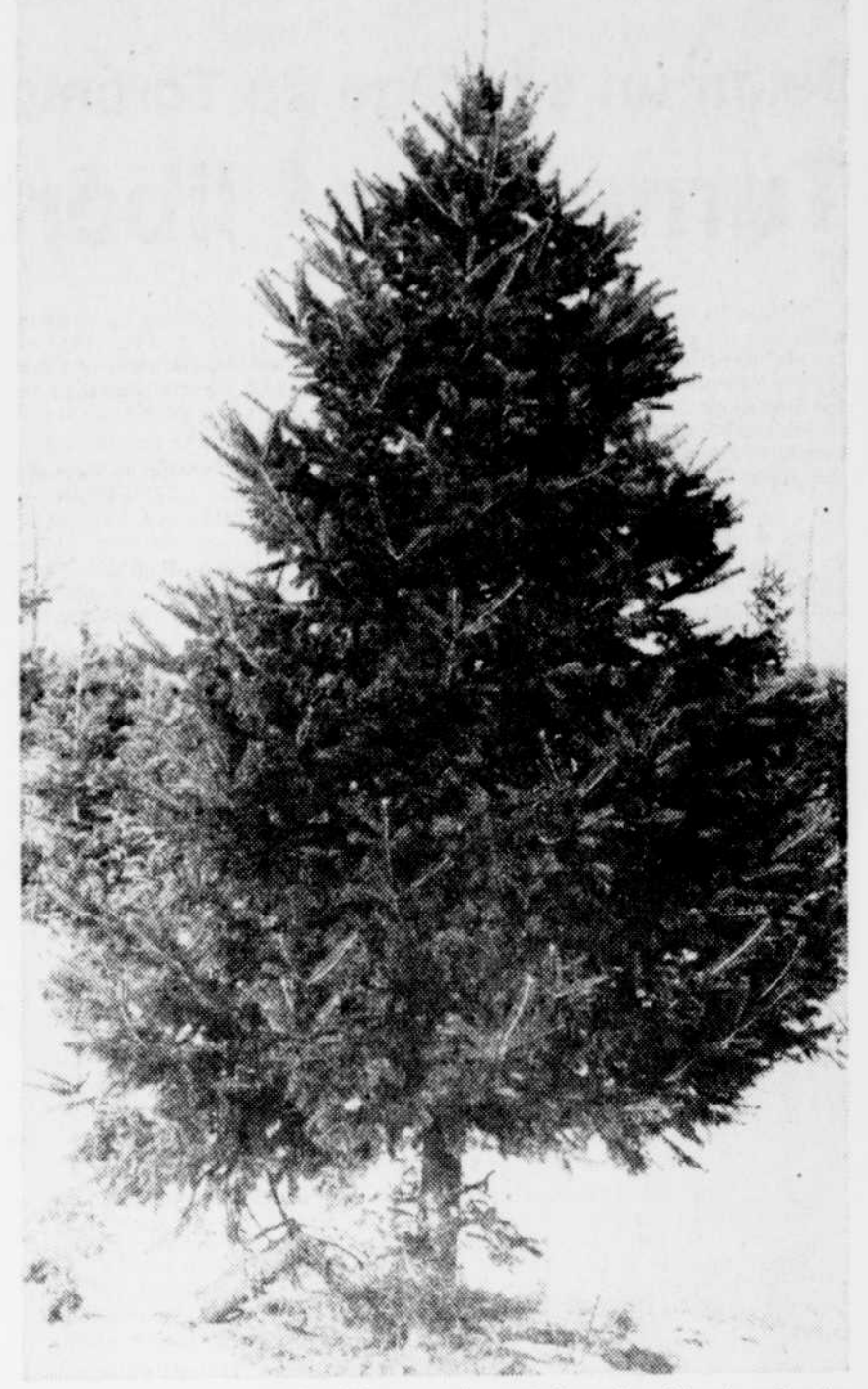
Les trois quarts de la production québécoise d'arbres de Noël sont exportés aux Etats-Unis et au Venezuela.