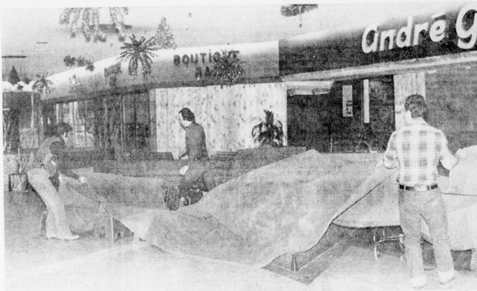
Un nouveau tapis est installé en pleine nuit dans l'une des allées du centre commercial.