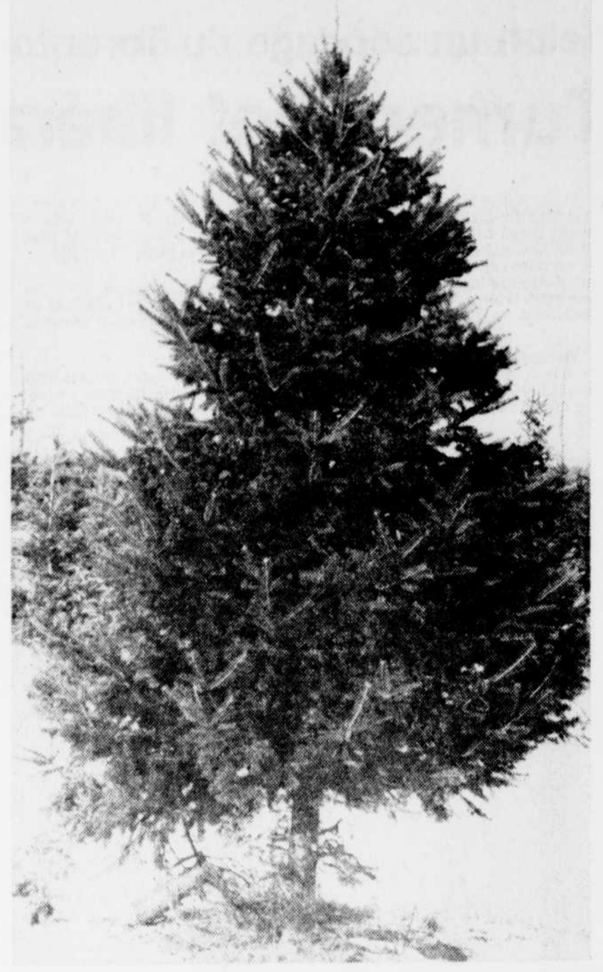
Les essences les plus recherchées sont le sapin baumier et le pin sylvestre.