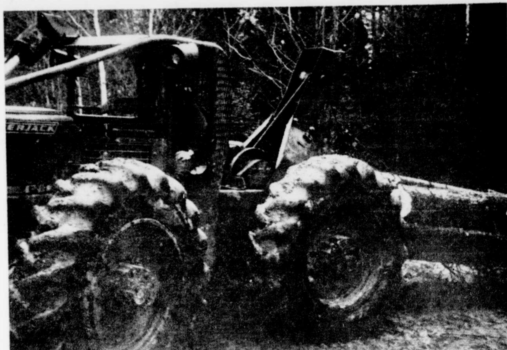
Au chantier étudiant de la "forêt-école" de Saint-Pamphile, les jeunes forestiers disposaient de tout l'équipement d'une grande exploitation, y compris une débusqueuse à câbles (Timberjack 230 D).

Tout en se disant conscient de l'impénitence de la population à prendre connaissance des résultats le plus tôt possible, la firme de consultants chargée de cette étude lui demande de comprendre que, compte tenu des implications sociales et économiques de la forêt de cette région, elle ne doit rien négliger dans la recherche d'une plus grande précision possible sur les disponibilités de matière ligneuse pour le Bas-Saint-Laurent—Gaspésie.