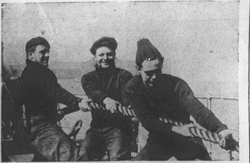
Les cargos chargés de matériaux et de vivres venus du Canada ne cessent d'arriver en Grande-Bretagne malgré les attaques des sous-marins. Sur cette photo, des matelots de la marine marchande canadienne tirent sur une amarre qui rapproche leur vaisseau du quai.