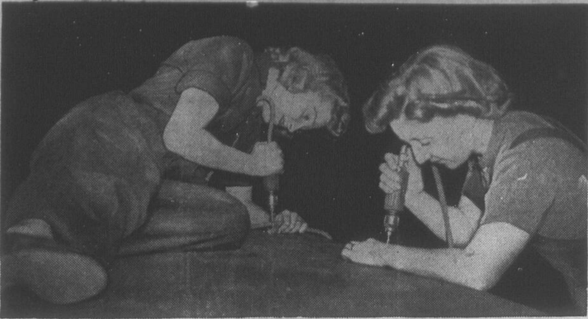
Les gros bombardiers Halifax qui ravagèrent les usines de Rostick et Lubeck sont construits en Angleterre et des milliers de femmes travaillent dans les usines où sont construits ces géants de l'air. Un Halifax pèse 27 tonnes avec sa charge. Il peut emporter au-dessus de l'Allemagne cinq tonnes et demie de bombes et des cartouches pour ses huit puissantes mitrailleuses Browning. Il peut aller bombarder un objectif à 1,500 milles et rentrer à son hangar.