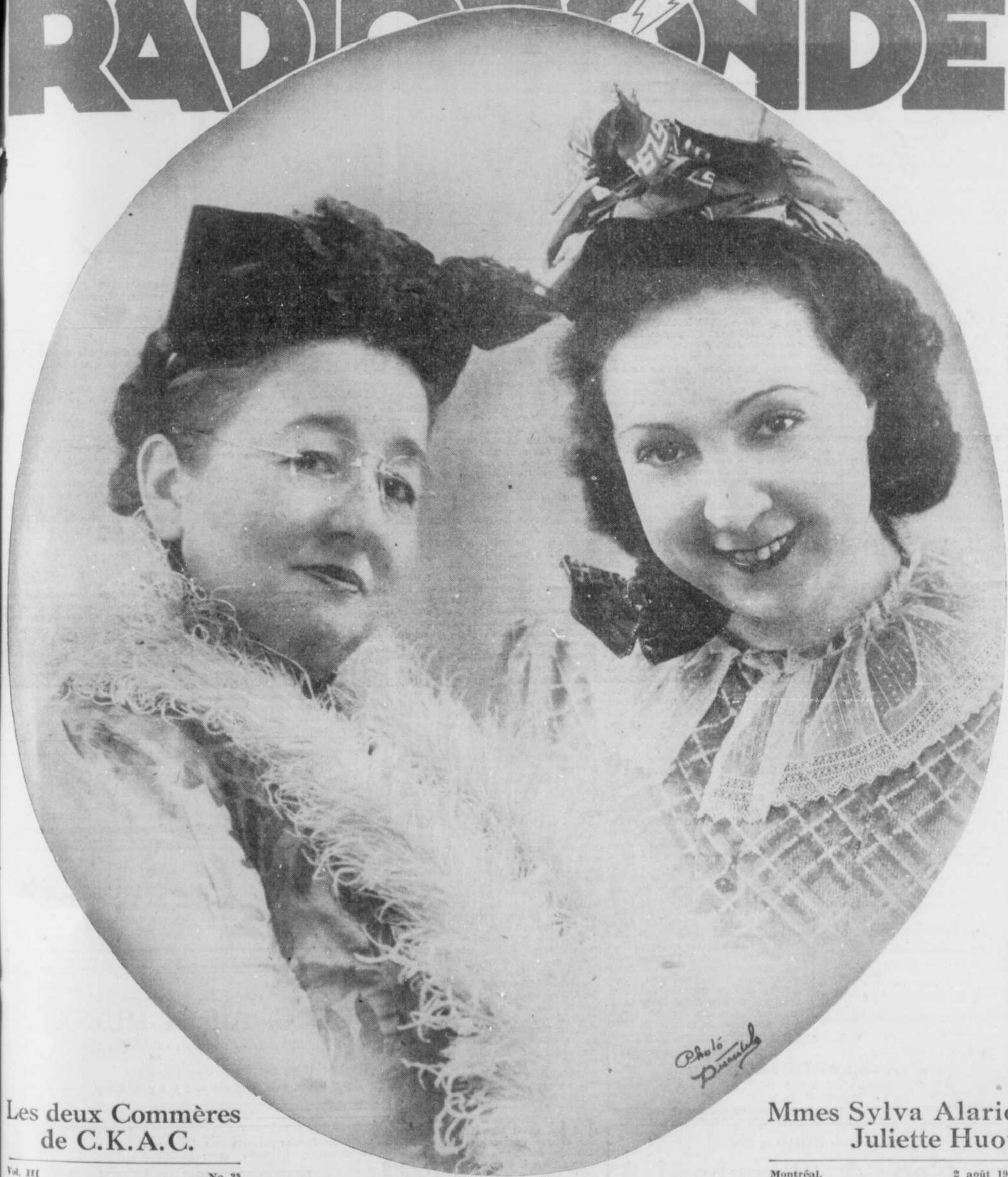
Les deux Commères de C.K.A.C.