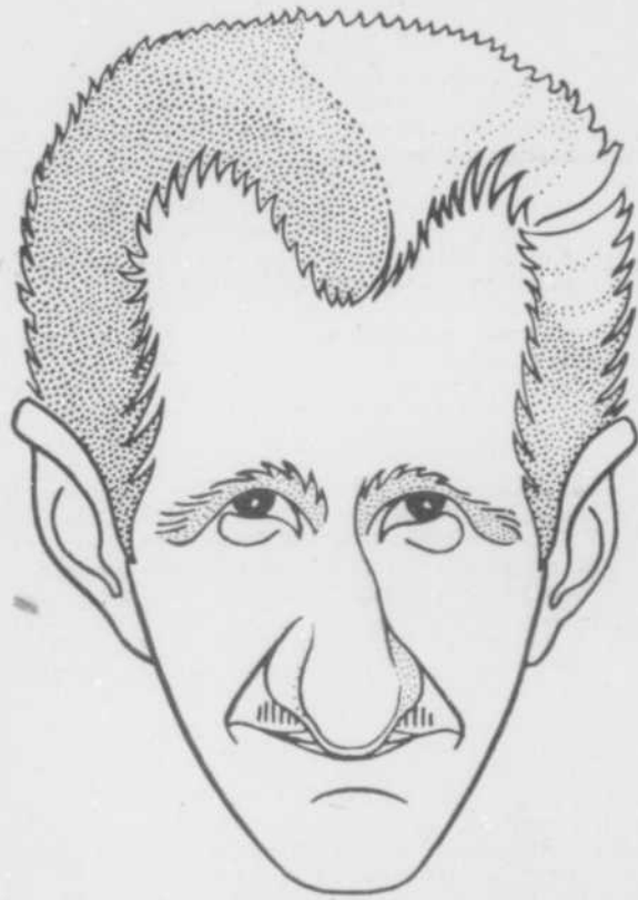
PAUL LEDUC (RÉALISATEUR)