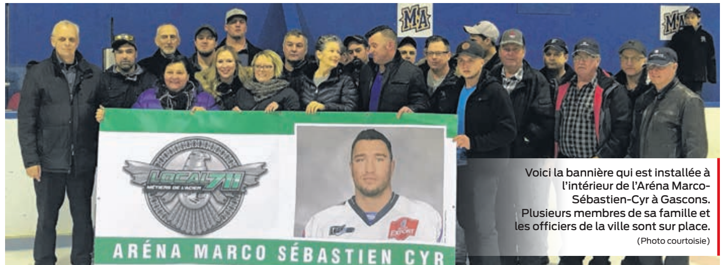
Voici la bannière qui est installée à l'intérieur de l'Aréna Marco-Sébastien-Cyr à Gascons. Plusieurs membres de sa famille et les officiers de la ville sont sur place.

Voici une petite anecdote: il disait que ses combats ne duraient pas assez longtemps, soit 1 mi-