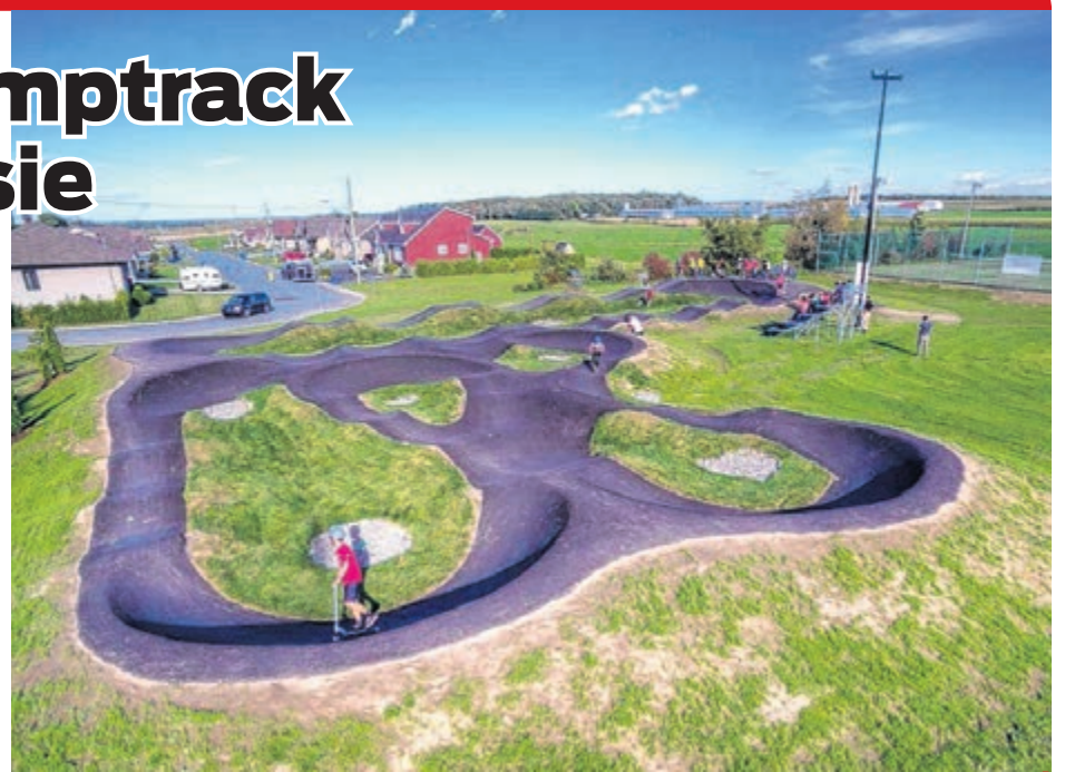
Voici le circuit de pumptrack asphalté qu'on retrouve à St-Bernard de Beauce.

Le circuit sera bâti entre l'école primaire et l'école secondaire de Grande-Rivière, à l'intersection de la voie ferrée et de la rue du Carrefour. Le budget alloué pour le projet est de 130 000 $ et le maire affirme que ce dernier pourrait être livré à la fin 2018 ou au début 2019.