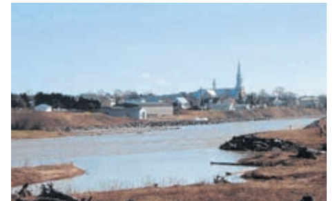
La Ville de Grande-Rivière a reçu une mise en demeure de 100 000$.

Par courriel, le ministère nous confirme qu'il n'a