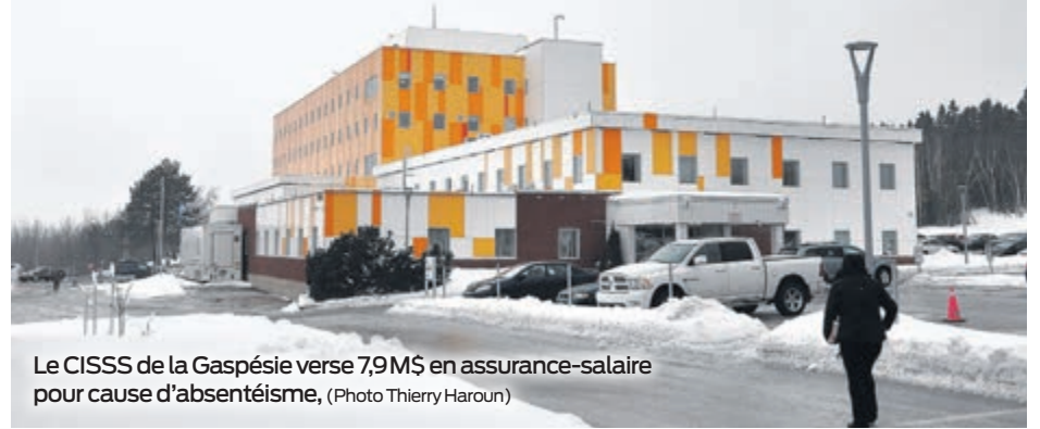
Le CISSS de la Gaspésie verse 7,9M$ en assurance-salaire pour cause d'absentéisme, (Photo Thierry Haroun)

Non seulement M. Bond reconnaît le coût humain de ce fléau en milieu de travail, mais assure par la même occasion que son orga-