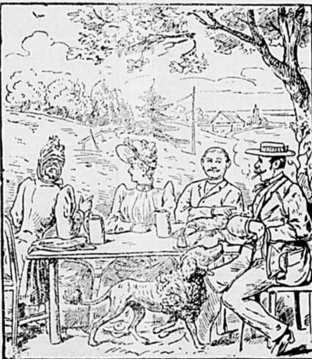
Une partie de campagne, trouvez la fillette à maman.

—Nous accusons réception du magnifique cahier de modes, numéro d'octobre, publié par la "Delincaator Publishing Company", de Toronto. Comme toujours ce numéro est très intéressant et rempli de renseignements utiles pour les personnes qui s'occupent de modes. Prix 15 centimes le numéro. —Un joli souvenir. — M. Albert Gervais a actuellement en mains, plusieurs copies d'une magnifique photographie de l'intérieur de la nouvelle église de Joliette. Cette photographie a 11 x 14 pouces, est bien nette, bien exacte, parfaitement réussie. Prix : au magasin 25 cts., par la malle en Canada et aux Etats-Unis, 35 cts.