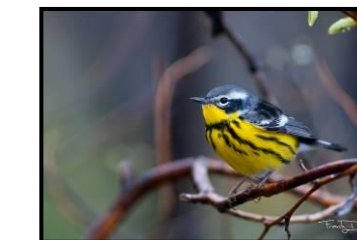
Paruline à tête cendrée