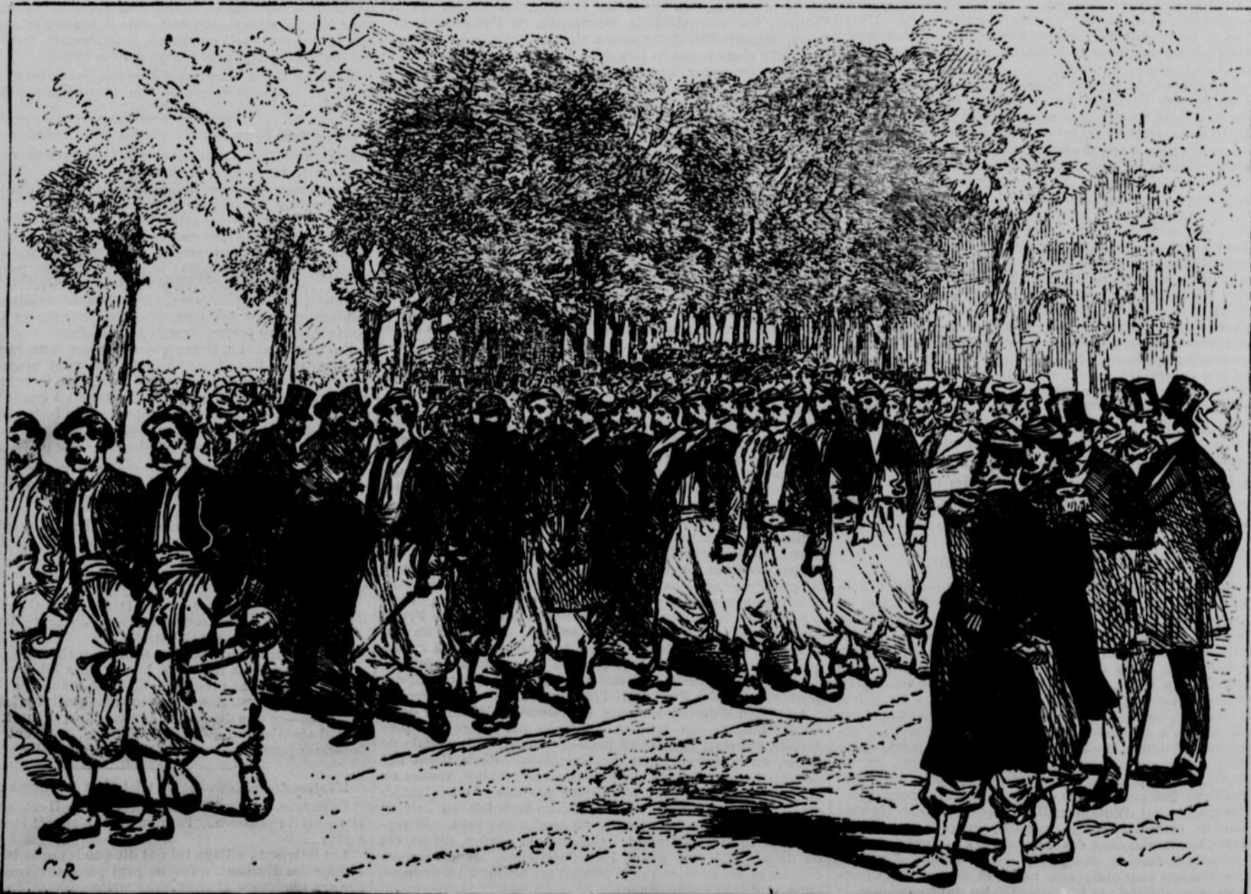
ARRIVÉE À TOURS DES ZOUAVES PONTIFICAUX

« Ils ne peuvent s'entendre entre eux, Monsieur. Il y a maintenant dans mon hôtel trois maréchaux de France, plus de 20 généraux et 60 colonels et majors. Plusieurs de ces officiers, déclarant qu'ils ont été victimes d'une trahison, refusent de s'associer aux autres. Par exemple, les amis du maréchal Le Bœuf ne veulent avoir rien de commun avec ceux du maréchal Bazaine, tandis que d'autres ne professent d'attachement que pour le maréchal Canrobert. Ces inimitiés m'ont forcé à donner des appartements séparés à mes pensionnaires, et à les grouper à table suivant leurs préférences. Les trois maréchaux eux-mêmes s'évitent soigneusement les uns les autres. Le maréchal Bazaine prend invariablement ses repas tout seul, pour ne pas avoir à entendre de remarques désagréables... Cet homme à cheveux blancs, continua l'hôte en désignant du coin de l'œil un homme vêtu en civil, est le personnage mystérieux qui a si étrangement mystifié le comte de Bismarck, le prince impérial et le général Bourbaki. Son nom est Renier. Quelques-uns disent que c'est un espion prussien. Il était autrefois employé dans la maison de l'impératrice. Sa situation actuelle est peu enviable, aucun des officiers français ne daignent lui adresser la parole. Mais quant à l'origine de cet homme, quant à sa nationalité, au rôle qu'il joue et au but qu'il poursuit ce sont autant de mystères... »