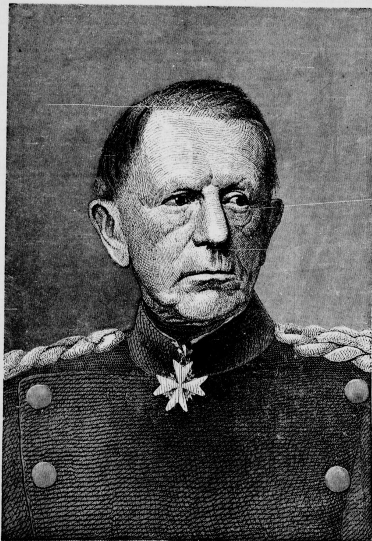
LE GÉNÉRAL DE MOLTKE, COMMANDANT EN CHEF DE L'ARMÉE PRUSSienne.

Il est né à Gnewitz dans le duché de Mecklembourg, en 1800. Il commença par servir le Danemarck où il était déjà considéré comme un homme d'avenir dans la carrière des armes. Lorsque surgit la question de l'indépendance des duchés et plus tard de leur annexion à la confédération germanique, Von Moltke se rangea du côté des prétentions allemandes et prit en 1822 du service dans l'armée prussienne. Il fut promu rapidement aux grades les plus élevés. Dans un voyage qu'il fit en Turquie, le sultan Mahmoud II se l'attacha et le chargea de la réorganisation de son armée. La guerre de Crimée démontra le succès de ses travaux et de ses réformes. Il revint en Prusse en 1846, et continua de grandir en science et de s'élever en grade. Lorsqu'éclata la guerre du Danemarck, Von Moltke était chef d'Etat-Major des armées prussiennes. La cause des difficultés était, comme on vient de le voir, la question de l'annexion à la Prusse de certains duchés sur lesquels le Danemarck et le duc d'Augustembourg réclamaient des droits de souveraineté. Le roi de Prusse trancha la question en soutenant que le roi du Danemarck avait été le souverain légitime des duchés jusqu'en 1864 et