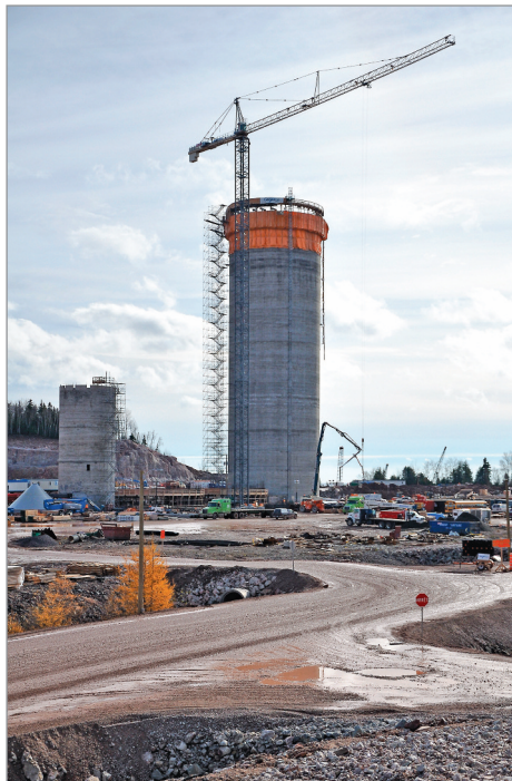
La construction du premier entrepôt va bon train.

F.D. - Le chantier de la cimenterie n'est pas une mince affaire, avec des travaux qui s'exécutent pour l'érection de multiples structures, sur terre et sur mer.