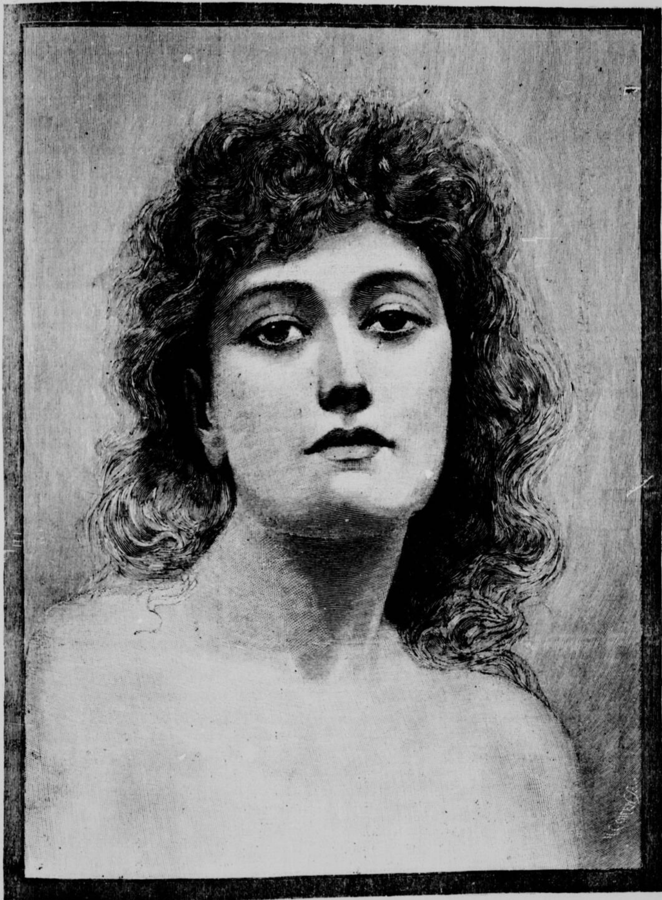
BEAUX-ARTS.—UNE ÉTUDE DE TÊTE

La ligne, par insertion - - - - 10 cents Insertions subséquentes - - - - 5 cents Tarif spécial pour annonces à long terme