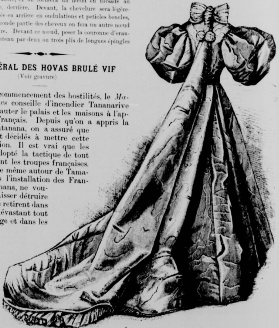
TOILETTE DE MARIÉE AVEC PLI WATTEAU—(Extrait de la Saison)

Taches sur les doigts. — Après avoir épluché des noix fraîches, on a presque toujours sur les doigts ou sur les lèvres des taches brun noir qui résistent pendant plusieurs jours aux lavages à l'eau ordinaire. Il suffit, pour les faire partir en quelques minutes, de frotter l'endroit taché avec du jus de citron.