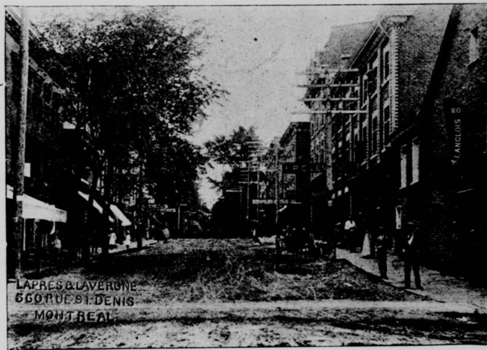
LAPRES & LAVERGNE 560 RUE ST. DENIS MONTREAL