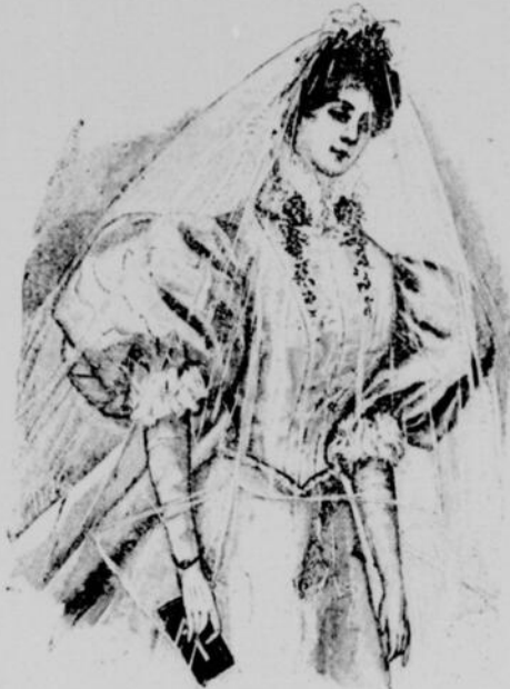
TOILETTE DE MARIÉE AVEC PLI WATTEAU

Les modistes sont ordinairement prêtes avant les autres. Cependant, cette année, elles semblent éprouver une légère indécision. Faut-il soutenir le chapeau Louis XVI ou lancer le grand cabriolet 1830 ? Voilà la question. Pour la résoudre on fait les deux genres, laissant les dames choisir elles-mêmes ce qui leur va le mieux. Comme coiffure inter-