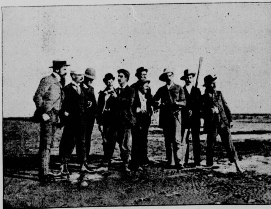
UN PARTI D'EXCURSIONNISTES SUR LES BORDS DU LAC SAINT-PIERRE

Un oiseau dans un arbre, c'est un porte-plume dans un porte-feuille.