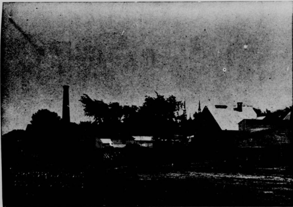
VUE PRISE DU QUAI (REGARDANT LA VILLE)