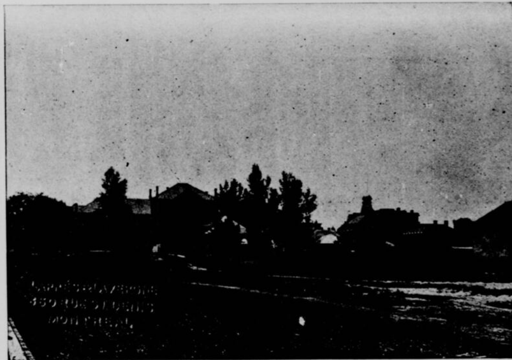
LE MARCHÉ ET L'HOTEL BRUNSWICK