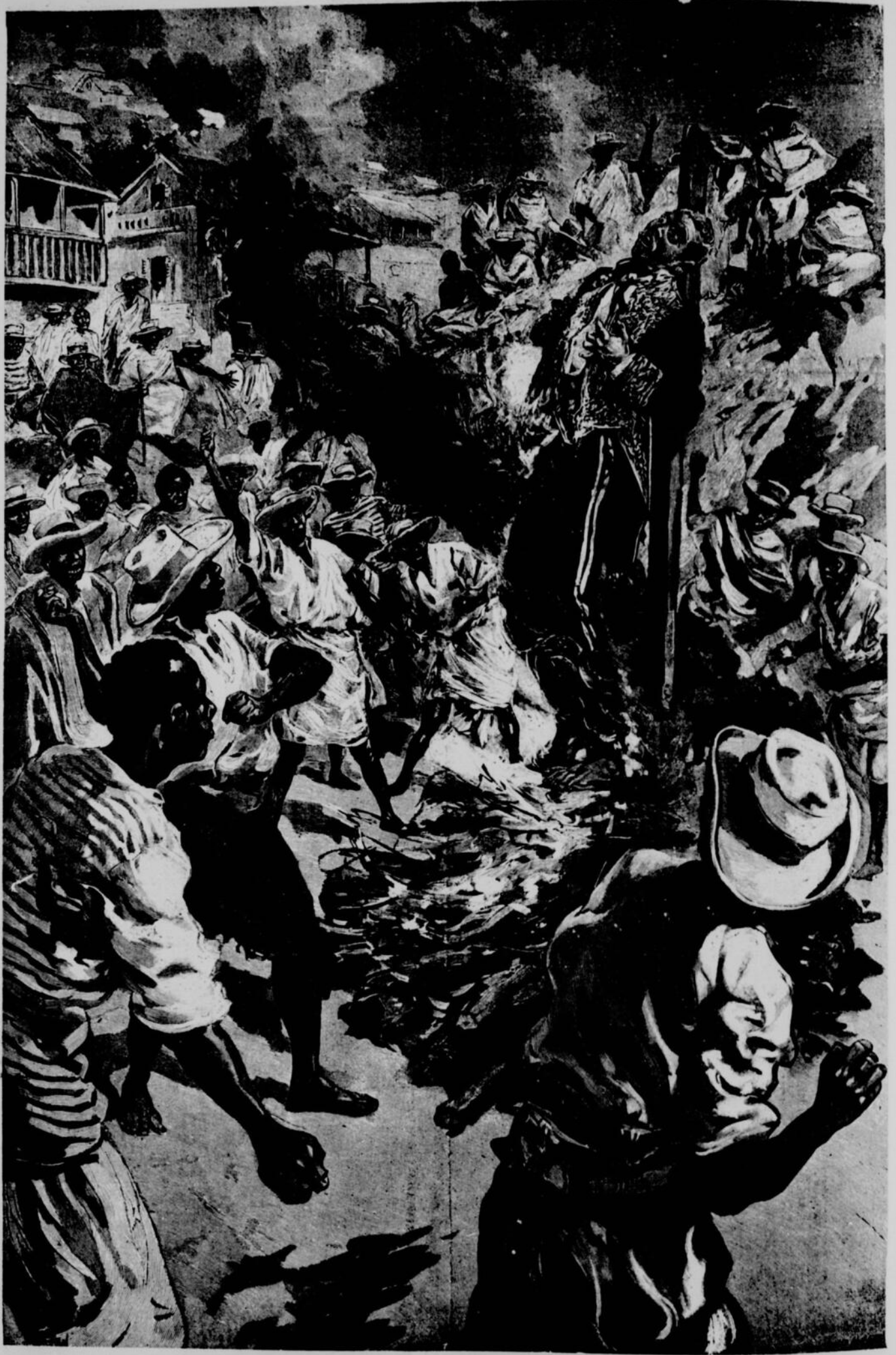
A MADAGASCAR.—UN GÉNÉRAL HOVAS BRULÉ VIF DEVANT SES TROUPES.—Dessin de Tofani