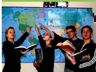
GÉNIES EN HERBE

Les équipes de 5 e secondaire de la Polyvalente Jean-Dolbeau inscrites à la ligue régionale de Génies en herbe occupent les deux premières places au classement : le Séminaire de Chicoutimi, le Séminaire de Métabetchouan et l'École secondaire de Kénogami. En tout, la Polyvalente Jean-Dolbeau compte six équipes des douze équipes inscrites à la ligue régionale.