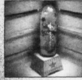
The Evidence of Things Unseen