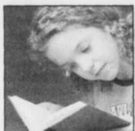
L'Heure du conte

La Pulperie de Chicoutimi «Asterix et les romains», «Léon Bouchard, sculpteur du bonheur» et «Arthur Villeneuve, un art atypique».