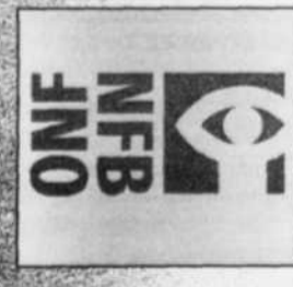
Les Nouveautés de l'ONF 2006