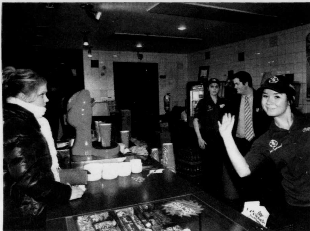
MEILLEURE GESTION - Parce que le système en ligne permet aux gestionnaires de savoir à la minute près le nombre de billets vendus, il permet aux gestionnaires de salles d'obtenir une meilleure organisation des horaires du personnel.