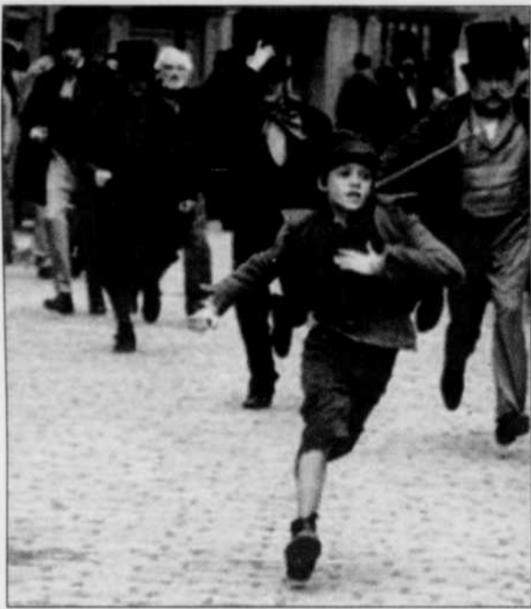
OLIVER TWIST - Au ciné-club de Chicoutimi, il y aura présentation du film «Oliver Twist» à 17h et 19h30, ce soir. Il s'agit d'un film de Roman Polanski.