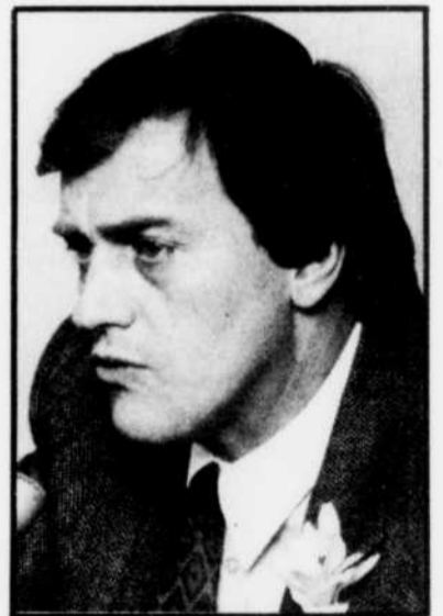
Jean Perron, entraîneur des Canadiens de Montréal

Quel modèle de jeu afficheraient ses troupes s'il laissait régner le désordre et le non-respect envers les hautes autorités du Canadien? D'ailleurs, toute équipe qui aspire aux plus grands honneurs se doit d'établir la discipline.