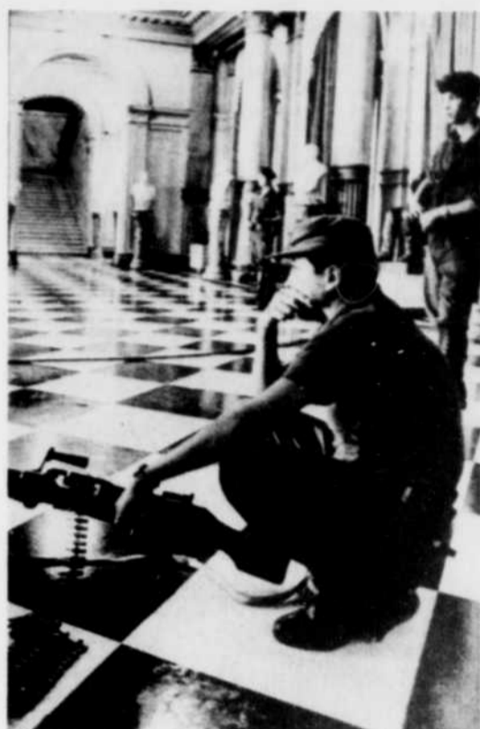
Les autorités politiques en Argentine ont eu chaud avec la dernière rébellion. Les gardes au Parlement, à Buenos Aires, ont quitté leurs habits d'apparat pour des tenues de combat.

BUENOS AIRES (AFP) — La démocratie argentine s'est une nouvelle fois tirée des griffes du fondamentalisme militaire en venant à bout, grâce à la loyauté démontrée par une majorité des forces armées, de "Rambo" Rico, le chef d'une rébellion qui l'a fait trembler pendant 48 heures.