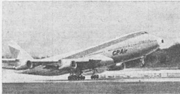
Le service SuperOrange de CPAir vous offre le seul vol sans escale en 747 de Vancouver à Tokyo, puis à Hong Kong. A compter du 16 décembre. (Sous réserve de l'approbation des services gouvernementaux.)

De plus, on vous offre une grande variété de bons vins. Sans