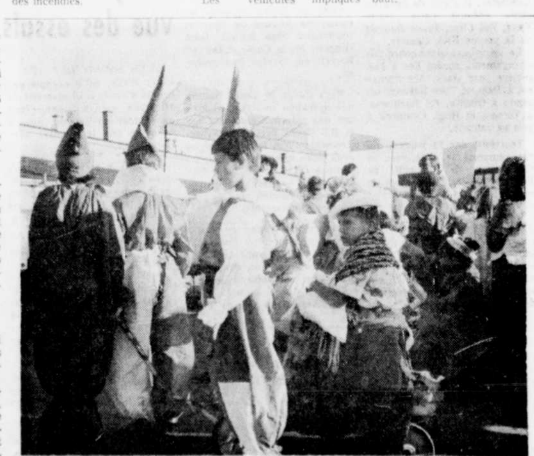
LA GRANDE PARADE ANNUELLE DE l'OTJ de Drummondville, par les rues de la cité, s'est tenue mercredi soir. Les enfants, costumés de façon originale, ont crié leurs slogans et chanté la chanson thème de leur parc respectif tout en déambulant "au pas" derrière les décapotales des dirigeants.