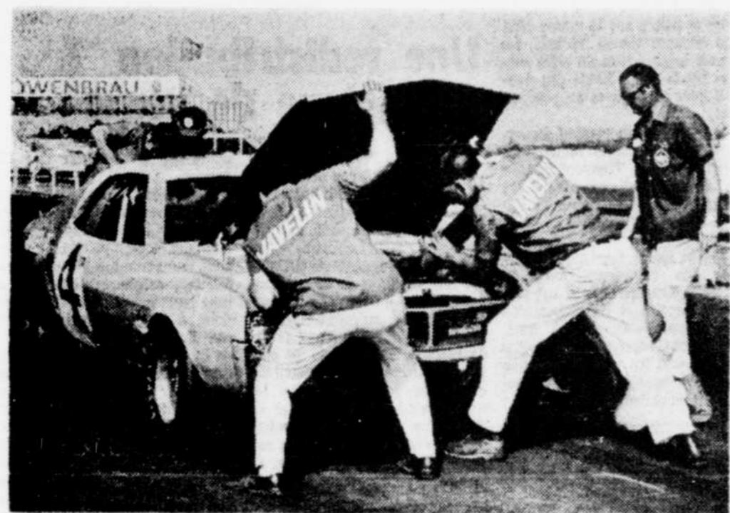
MILWAUKEE. — L'EQUIPE JAVELIN d'American Motors participera pour la première fois à une compétition du Circuit Mt-Tremblant le 21 juillet lors de la huitième ronde du Championnat de la série