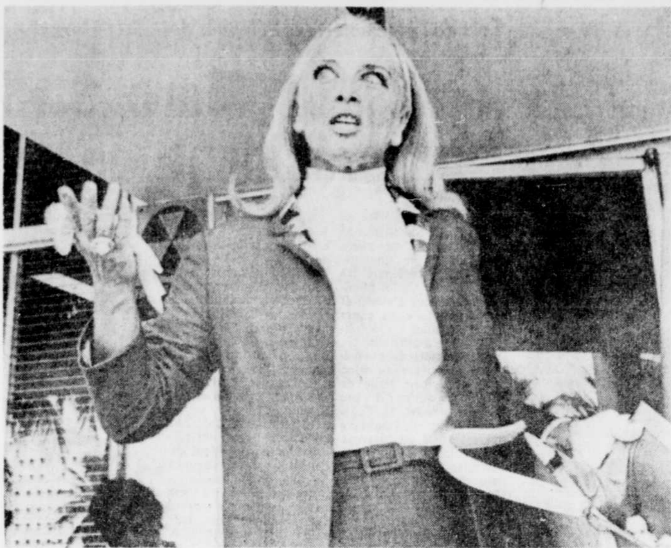
L'actrice française, Denise Darcel, est sortie heureuse après avoir dû passer un court temps incarcérée à Miami pour avoir été touchée coupable d'un vol de $300 dans un magasin de Miami. Elle avait été appréhendée le 23 juin dernier alors qu'elle avait de nombreux items dans son sac-à-main provenant du magasin en question.