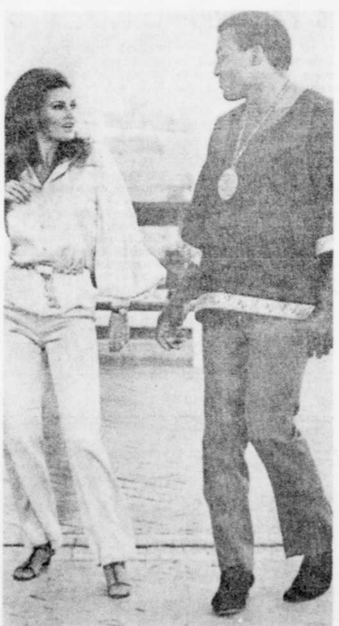
Le joueur de football des Browns de Cleveland exécute quelques pas de danse avec sa co-vedette, l'actrice Raquel Welch, dans une des premières séquences de "100 coups de feu", western qu'ils tournent présentement à Almeria, en Espagne.