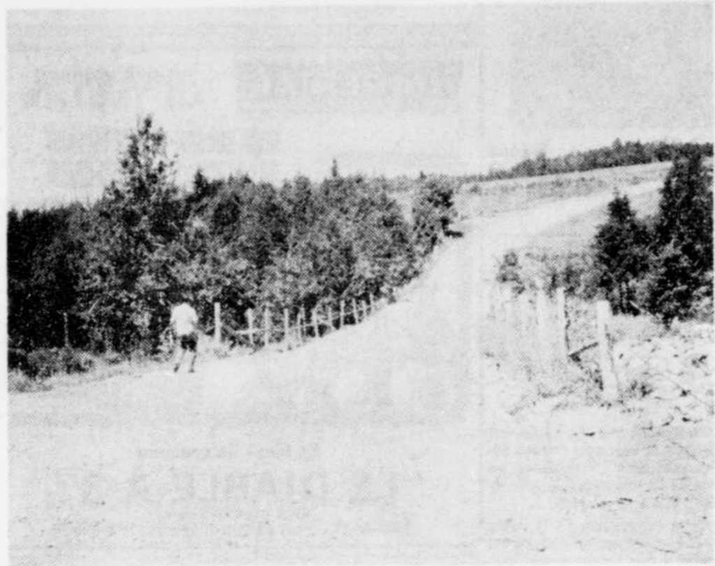
UN PONT DE DIMENSIONS TRES CONSIDERABLES est actuellement en construction sur la rivière Desrosiers à Tingwick. Le pont lui-même coûtera $100,000 environ et les approches du pont presqu'autant, soit $80,000. Le député du comté visitait hier le chantier de construction. Le contrat est exécuté par la firme de