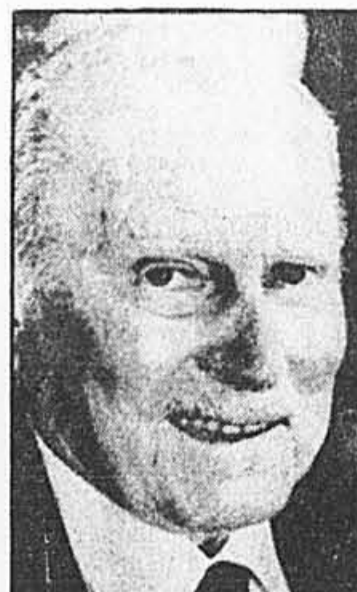
Sir Laurence Olivier