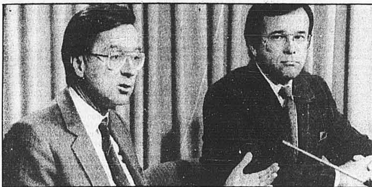
Le premier ministre du Québec, M. Robert Bourassa, a rencontré hier son homologue du Manitoba, M. Gary Filmon. Il s'est dit satisfait que M. Filmon se soit engagé à saisir l'Assemblée législative de Winnipeg du dossier du Lac Meech au cours du mois prochain.

« On va en parler de ça. On va dire aux électeurs que John Turner et Brian Mulroney veulent carte blanche. C'est l'honnêteté des deux qui va être notre rengaine. »