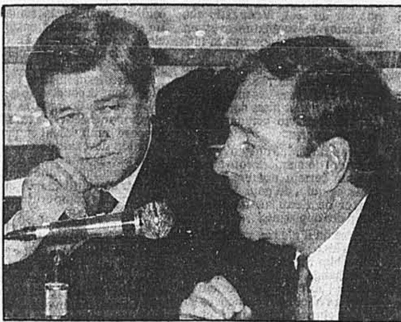
MM Raymond Garneau (à gauche) et Paul Martin ont présenté hier le programme du Parti libéral en ce qui a trait au développement de Montréal.

Le programme libéral, qui prétend obtenir des résultats à temps pour le 350 e anniversaire de Montréal en 1992, tourne autour de la création d'un «Conseil de coordination du développement de la région de Montréal» qui comprendrait des représentants