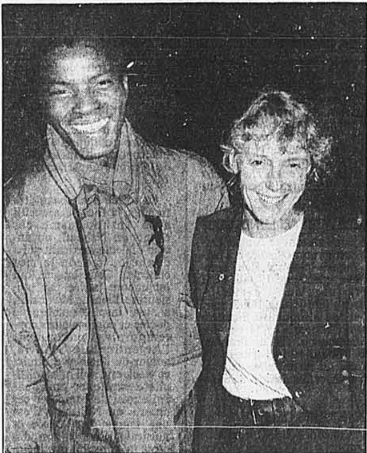
Isaach de Bankolé et Claire Denis : quelques questions entre deux avions...