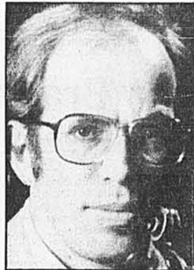
Le violoniste Gidon Kremer joue Offertorium de la Soviétique Sofia Gubaidulina ce soir et demain soir à l'OSM.

Avant son départ, soit vendredi matin, Dutoit enregistrera pour Radio-Québec un commentaire