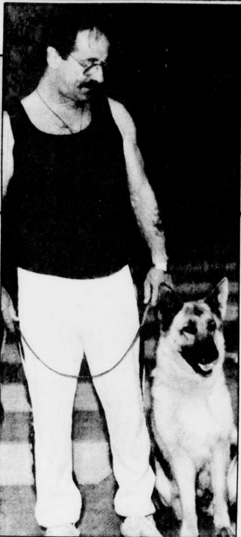
Une fois par semaine, les détenus avaient une heure trente pour établir avec le chien un climat de confiance et d'obéissance.