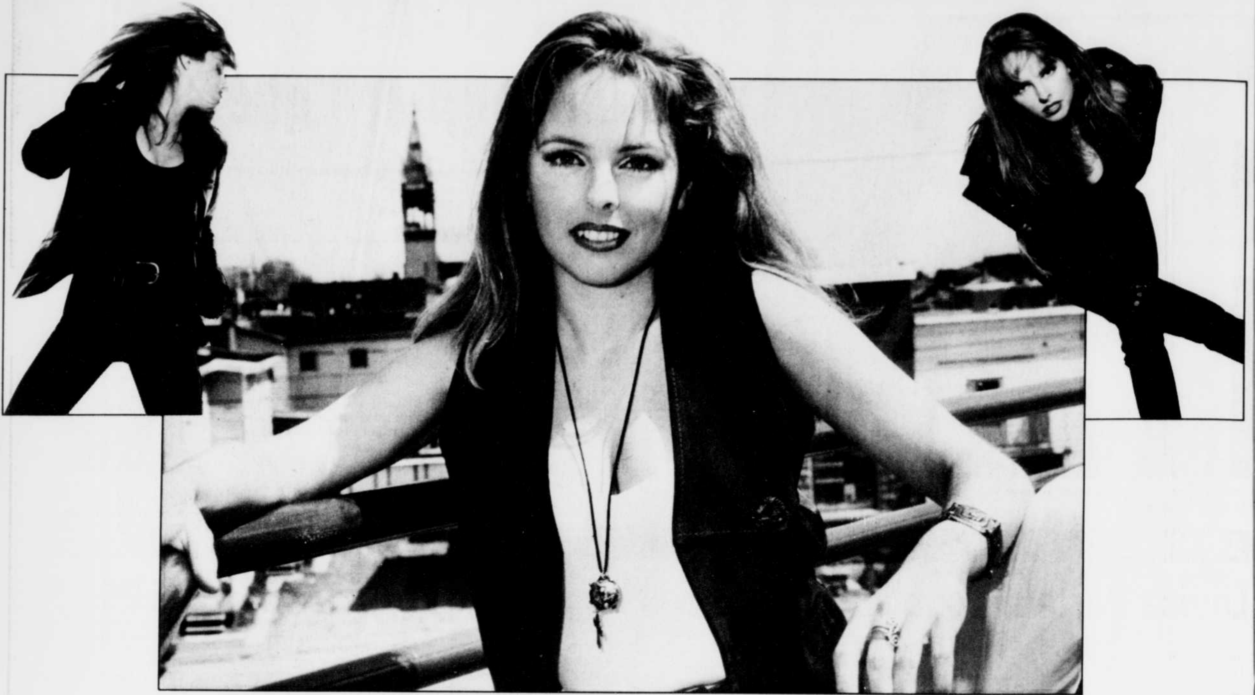
(Flagel Photo — Daniel Flagel)