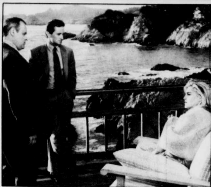
Les inspecteurs Gus Moran (George Dzundza) et Nick Curran (Michael Douglas) ne s'attendaient pas à devoir interroger une suspecte aussi déconcertante, la romancière Catherine Tramell (Sharon Stone).

Bénéficiant d'un budget de 40 millions, Verhoeven a délaissé le style Robocop pour faire de Basic Instinct une oeuvre particulièrement soignée et sophistiquée. La photographie contribue à accentuer le climat passionnel.