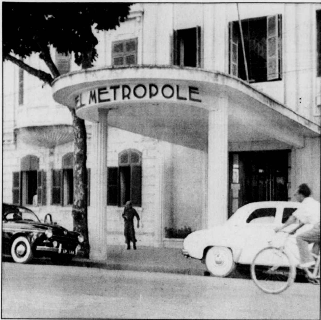
Le Métropole tel qu'on pouvait le voir en 1954.

«La rénovation de l'hôtel était indispensable pour recevoir les investisseurs étrangers», ajoute notre interlocuteur dans un excellent français. «Lorsque les gens viennent à Hanoï, ils peuvent maintenant se retrouver dans un milieu qui leur est familier.»