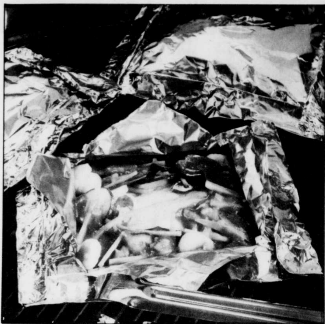
Poisson et légumes en papillotes sur le barbecue.