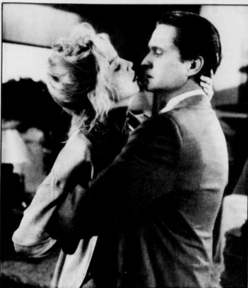
Sharon Stone et Michael Douglas assurent le succès controversé de Basic Instinct.