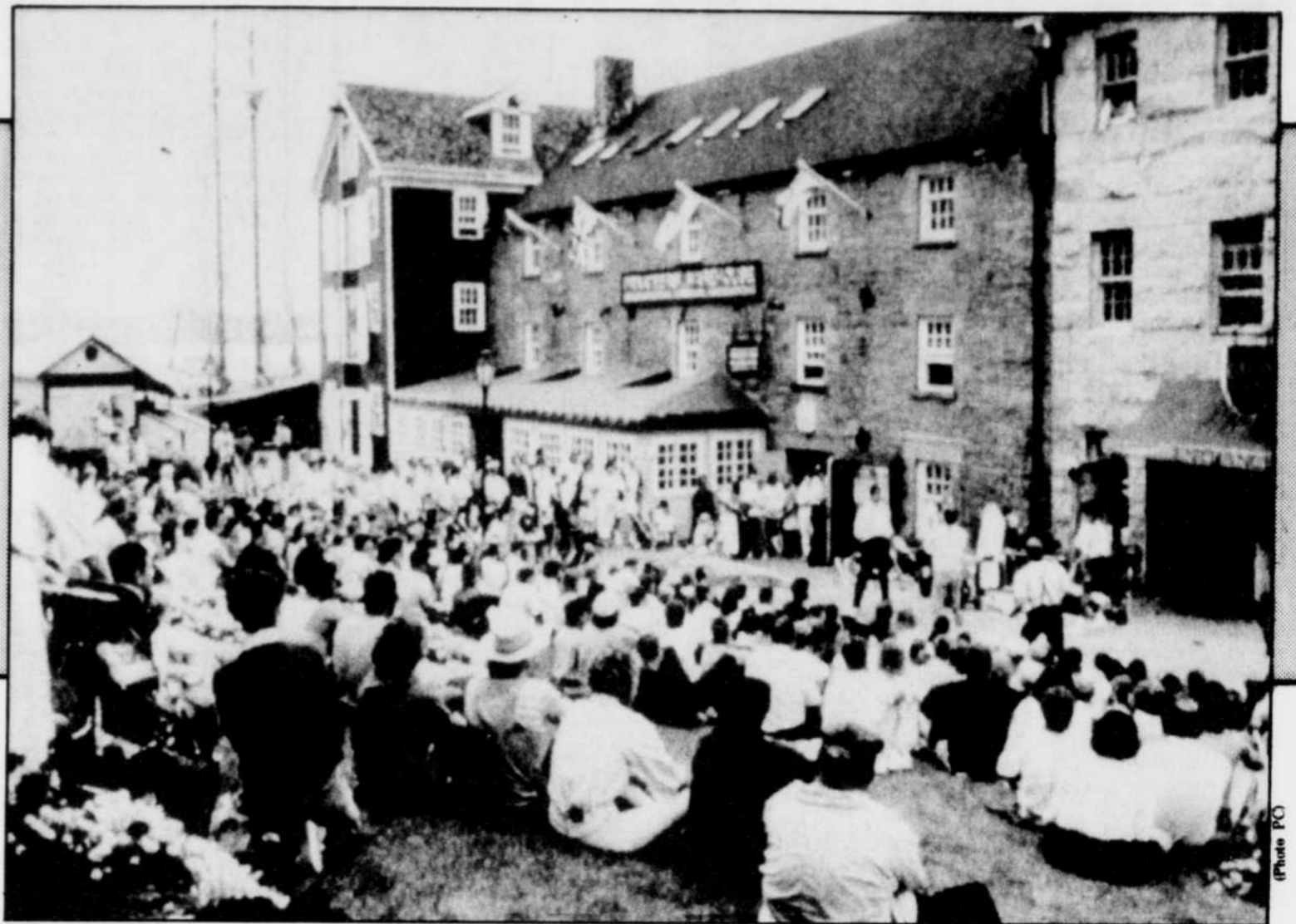
À Halifax, les visiteurs aiment se rassembler sur le site historique qui a été restauré tout en respectant son allure du 19e siècle. Boutiques, restaurants et activités diverses attirent les touristes.

Le plus grand et, certes l'un des plus beaux musées de la ville, est le Maritime Museum of the Atlantic, qui se dresse sur le bord de l'eau, incorporant dans son enceinte un