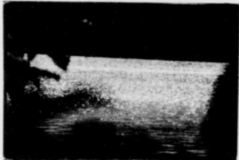
NUIT AMÉRICAINE ROBERT MYRAND 1991