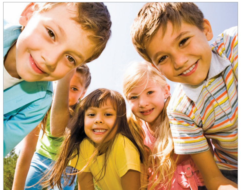
La clinique permet d'assurer de meilleurs délais pour effectuer les évaluations requises, de diagnostiquer et distinguer le TDA d'un TDAH.