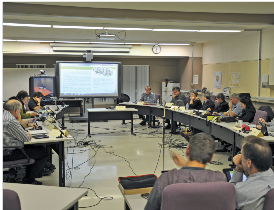
Le conseil des commissaires de la CSRL a adopté une résolution d'opposition au projet de réforme scolaire du ministre Bolduc, le 9 décembre.

Advenant une fusion, la nouvelle structure couvrirait 700 km linéaires de territoire, compterait 62 établissements, 11 500 élèves, plus de 1700 employés, plus de 50 municipalités dans cinq MRC.