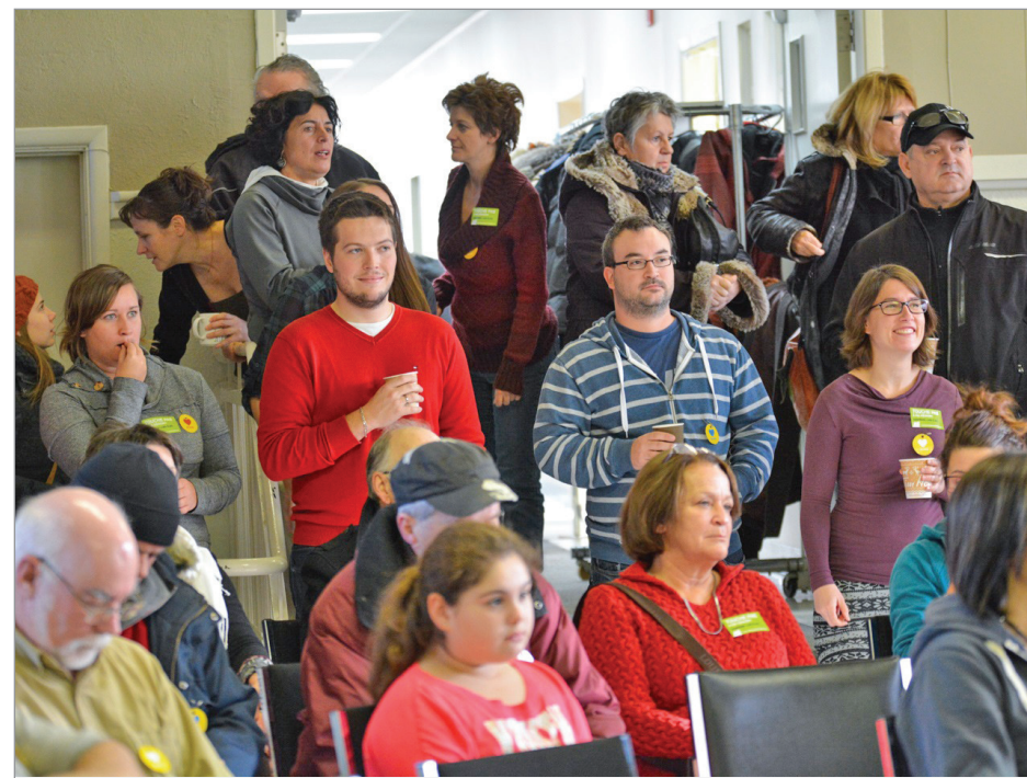
Plus de 100 personnes s'étaient déplacées pour participer à ce café de la solidarité en réaction aux nombreuses coupures du gouvernement du Québec.

Le comité organisateur de l'événement se dit satisfait de la réponse des citoyens de la MRC Rocher-Percé. « Nous avons reconnu la solidarité gaspésienne à travers les différents discours et témoignages des gens. Certains citoyens ont d'ailleurs manifesté leur intérêt à se joindre au comité pour les actions futures, ce qui nous motive à nous concerter de nouveau et à nous mobiliser davantage ». D'autres actions régionales sont d'ailleurs à prévoir dans les prochaines semaines.