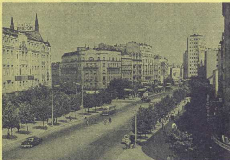
Belgrade... capitale indomptable... la cité héroïque a tout de même ses boulevards.

FRANCE - ALLEMAGNE - ITALIE - TCHÉCOSLOVAQUIE - HONGRIE - YOUGOSLAVIE