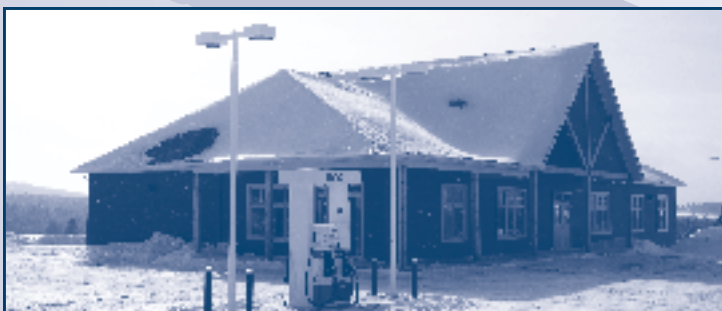
Coopérative Multiservices de Sacré-Coeur-de-Marie

Vous pourrez en tout temps aller porter vos tubulures. Assurez-vous cependant qu'elles sont dégagées de tout fer ou attaches métalliques, car elles seront refusées. En espérant que ce service tout à fait gratuit réponde à vos besoins.