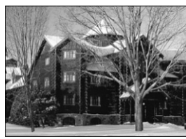
FAIRMONT LE CHÂTEAU MONTEBELLO MONTEBELLO, QC

Quoi de plus inspirant pour vos réunions d'affaires qu'un manoir perché sur une falaise ou encore un luxueux château en rondins ? C'est justement ce que vous réservent respectivement Fairmont Le Manoir Richelieu et Fairmont Le Château Montebello ! Nous sommes réputés pour accueillir les gens d'affaires avec grand style : salles de réunion superbement équipées, personnel attentionné et des plus professionnels, chambres d'une élégance raffinée, paysages incitant à élargir ses horizons et, de saison en saison, toute une panoplie d'activités sportives. Donnez-nous un coup de fil et, ensemble, nous créerons des moments magiques.