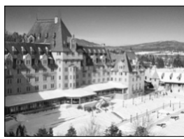
FAIRMONT LE MANOIR RICHELIEU CHARLEVOIX, QC