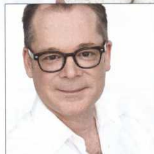
Mise en scène MARTIN FAUCHER