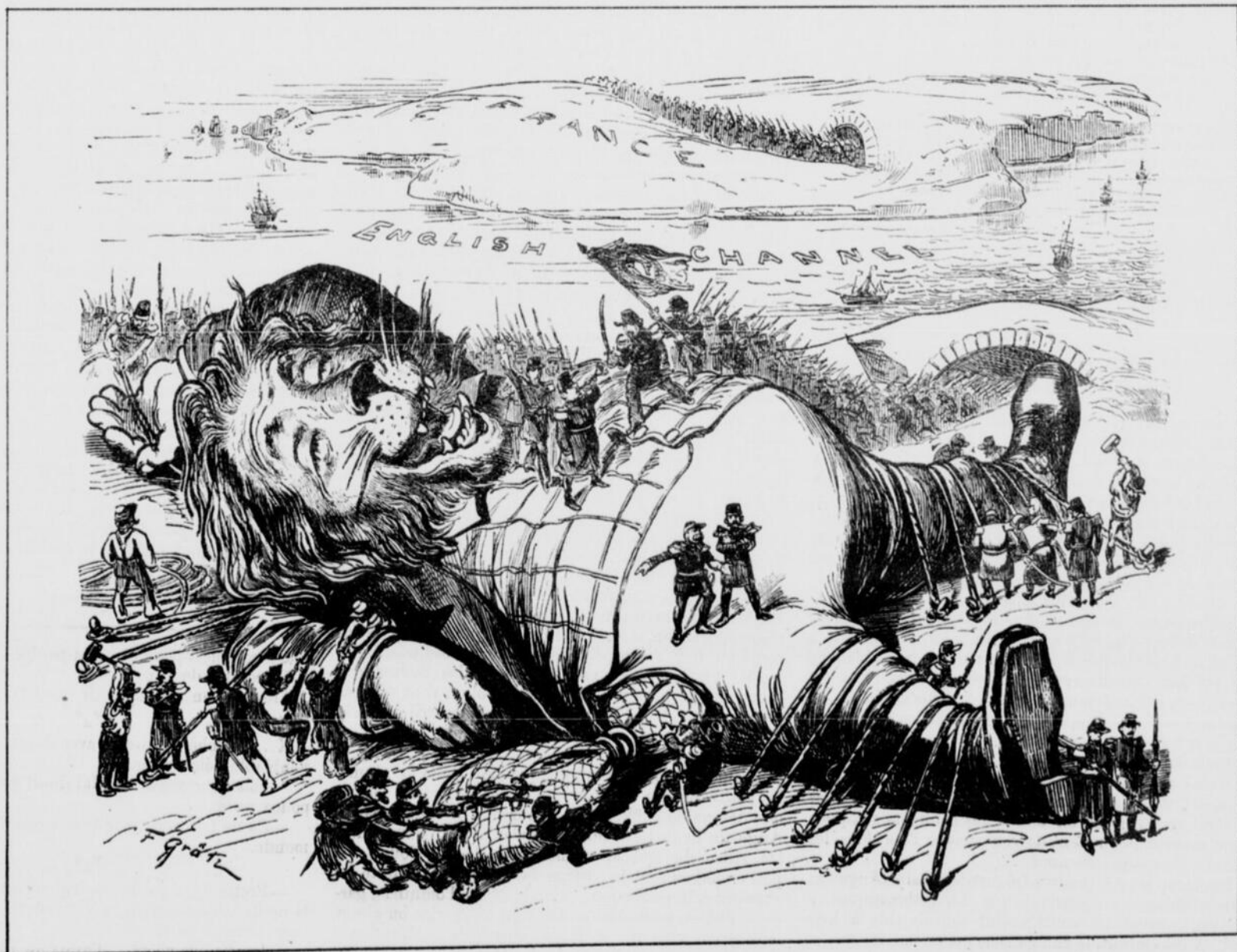
LE CAUCHEMAR D'ALBION

En 1878, après la 1 re campagne du Turkestan, il reçut successivement les croix de chevalier et de commandeur de 2 e classe de l'ordre militaire de Saint-Georges.