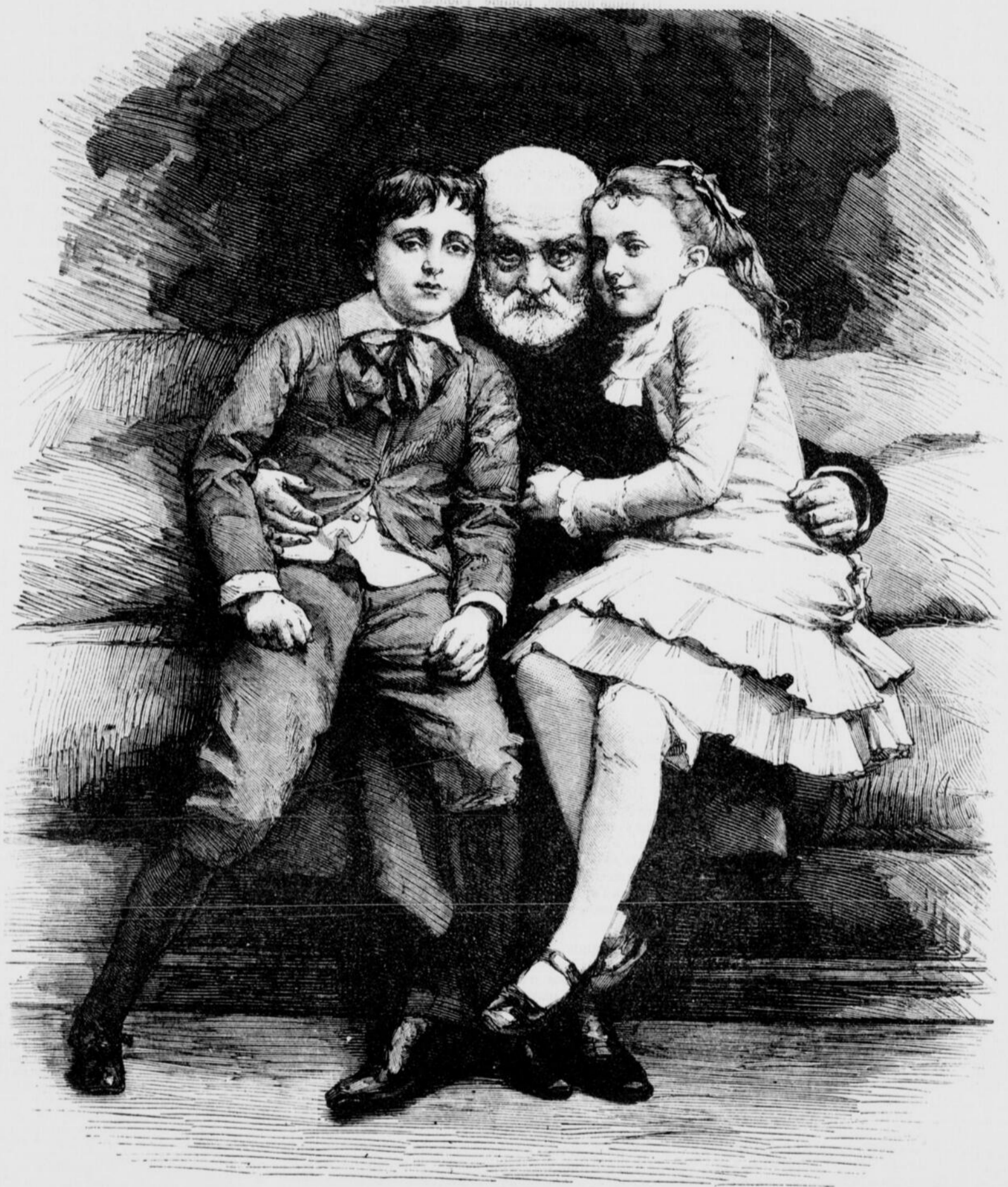
VICTOR HUGO ET SES PETITS-ENFANTS