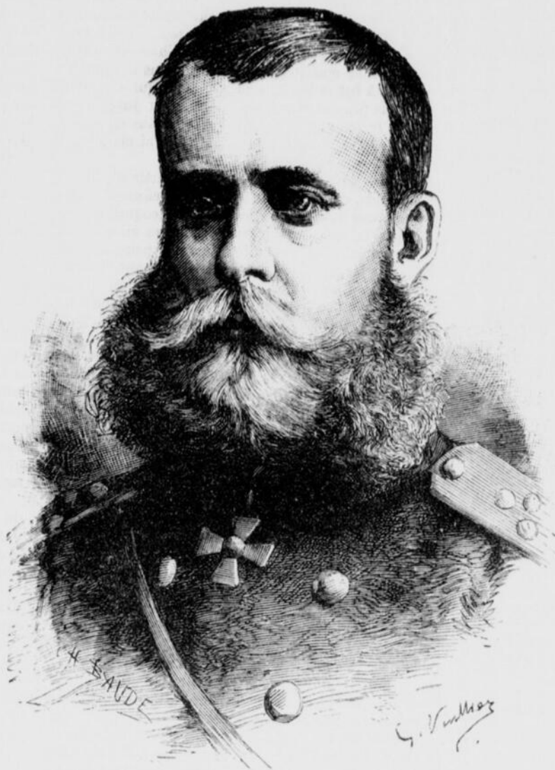
Le Général Skobelev.

A la tête d'une division, il emportait d'assaut la ville de Lortcha, défendue par les meilleures troupes d'Osman-Pa-