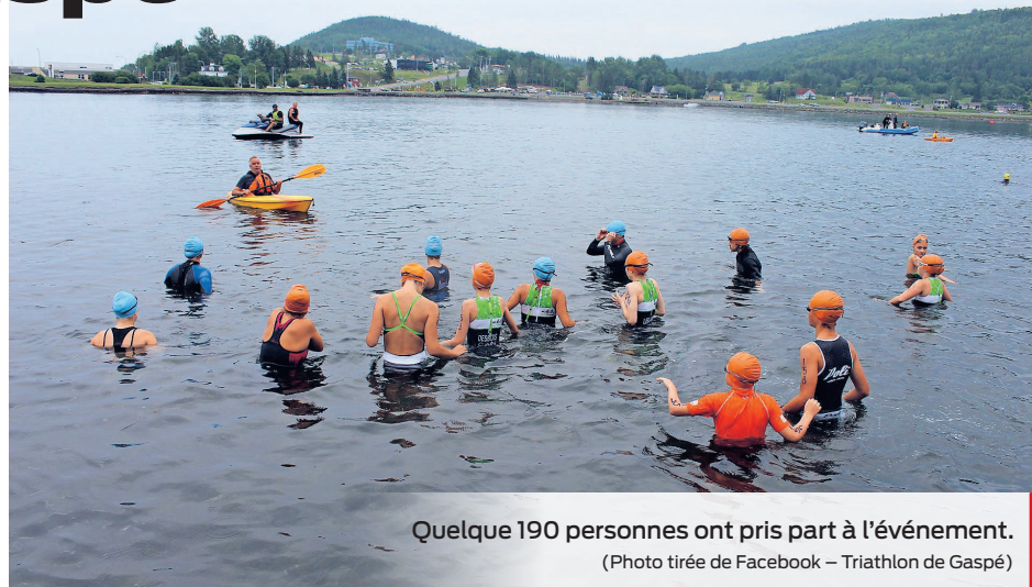
Quelque 190 personnes ont pris part à l'événement.

Les organisateurs ont qualifié cette 5 e édition de grande réussite. Environ 80 bénévoles ont assuré le bon déroulement des opérations et les courses Réal Coulombe ont permis d'amasser un montant de 400 $ qui sera remis sous forme de don à la fondation A.D.O.