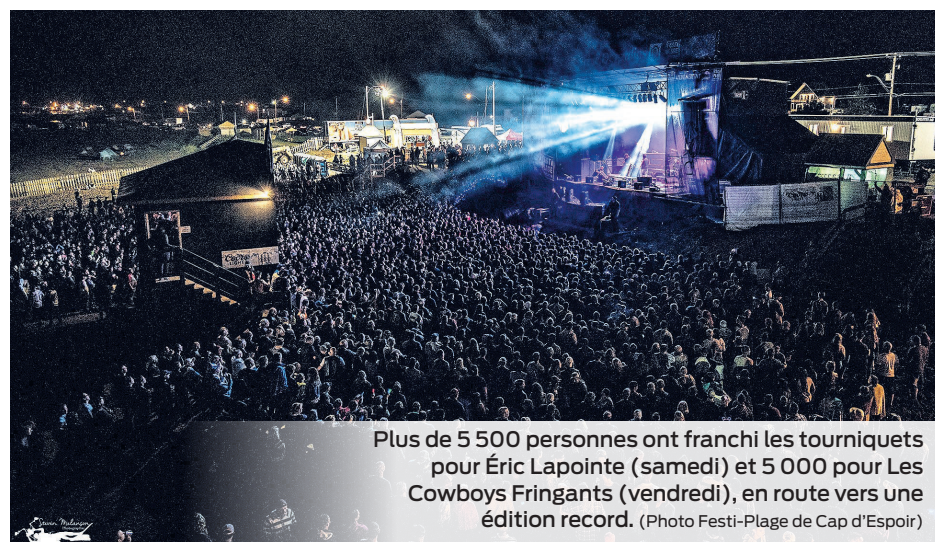
Plus de 5 500 personnes ont franchi les tourniquets pour Éric Lapointe (samedi) et 5 000 pour Les Cowboys Fringants (vendredi), en route vers une édition record.

Le samedi, un peu plus de 5 500 festivaliers se sont agglutinés sur la plage et ont fait fi d'une météo d'emblée peu clémente avec une quinzaine de minutes de violentes averses et un peu de tonnerre, mettant même fin prématurément à la première partie signée Rémi Chassé, finaliste de l'émission La Voix en 2014. Qu'à cela ne tienne, que ce soit torse nu, avec un pardessus ou un capuchon, les fidèles amateurs sont restés sur place pour attendre leur coqueluche Éric Lapointe, qui ne les a pas déçus et qui, fidèle à son habitude, a livré une prestation