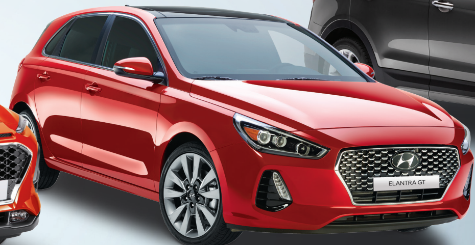
Modèle Sport Ultimate TDE montré *