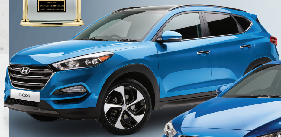
Modèle Ultimate montré *