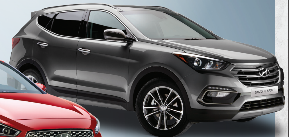
Modèle 2.0T Limited montré *

► Lorsque doté du freinage d'urgence autonome et des phares à DHI avec système d'éclairage adaptatif en virage. S'applique aux véhicules assemblés après juin 2017.