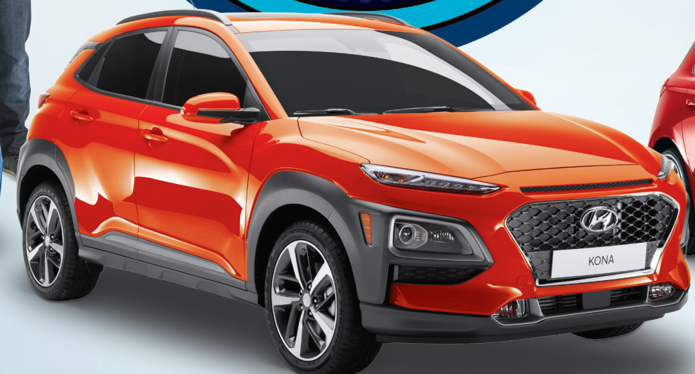
Modèle 1.6T Ultimate montré *