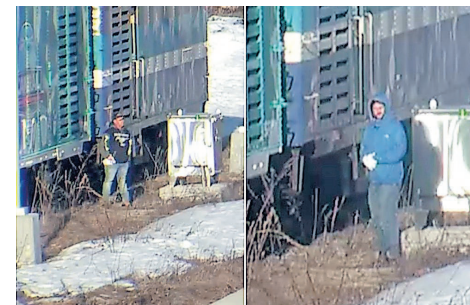
Les deux suspects actuellement recherchés par la Sûreté du Québec.

Les suspects se seraient introduits à l'intérieur du train pour y commettre un vol ainsi que divers méfaits. Un dispositif de surveillance installé à proximité a cependant permis de capter des images des individus au moment où ils circulaient autour du train. Les deux individus — qui seraient âgés entre 40 et 50 ans et mesureraient entre 5'8" et 5'11" — auraient été vus se déplaçant à vélo dans le secteur. L'un d'eux portait un manteau bleu pâle, des gants blancs ainsi qu'un pantalon vert lors de l'événement. Le second portait des jeans bleus, un manteau noir aux