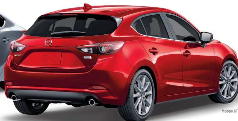
Modèle GT illustré

0% AU FINANCEMENT À L'ACHAT † JUSQU'À 72 MOIS