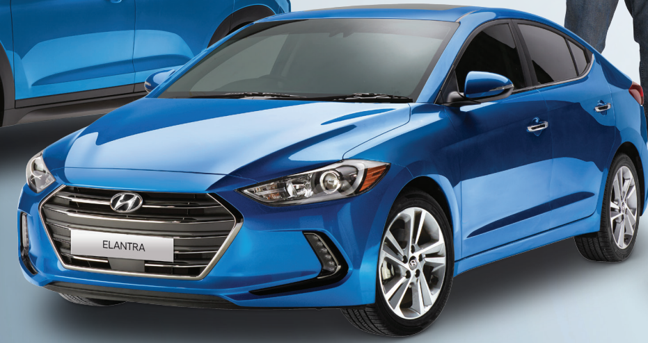
Modèle Limited montré *