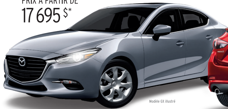
Modèle GX illustré