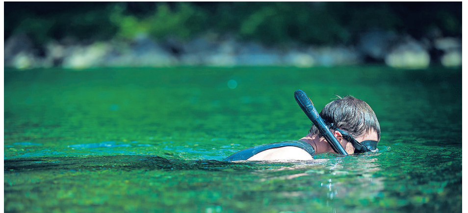
La Société pourrait bien émettre des constats d'infraction de 125 $ aux contrevenants, mais elle préfère pour l'instant adopter une approche de sensibilisation.

punir les gens, mais à un moment donné il va falloir faire quelque chose parce que certains baigneurs s'en foutent et envoient carrément promener les pêcheurs. Ça fait quoi, peut-être 7 ou 10 ans qu'on a le droit d'émettre des amendes et on ne l'a jamais fait. On avertit les gens, mais il semble que ça n'a plus d'impact du tout [...] Même si on peut émettre des infractions, ce n'est pas la ligne de conduite que je donne aux assistants pour la protection. C'est plus d'informer les gens et leur expliquer, mais il semble