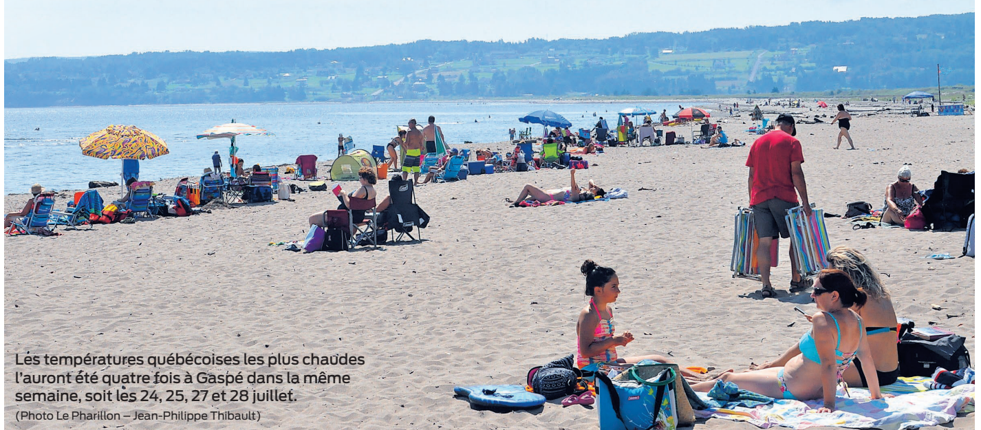
Les températures québécoises les plus chaudes l'auront été quatre fois à Gaspé dans la même semaine, soit les 24, 25, 27 et 28 juillet.

Quoiqu'il en soit, les météorologues de MétéoMédia notent également que Gaspé fut le point le plus chaud dans la province à sept occasions alors qu'une centaine de stations météo recueillent des données un peu partout dans la province (dont d'autres à New Richmond, Cap-Chat,