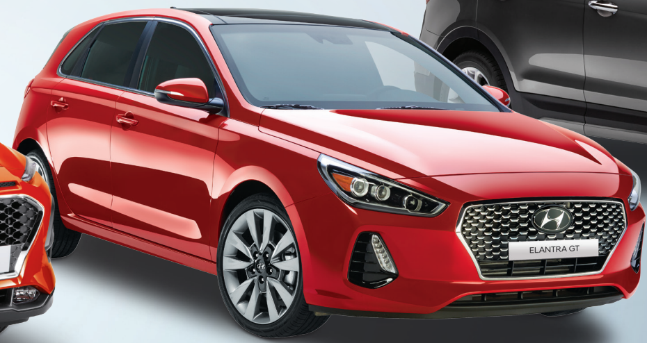
Modèle Sport Ultimate TDE montré *