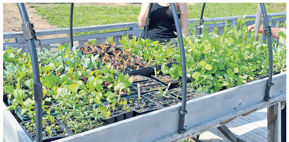
Légumes et fines herbes produits sur place seront vendus à chaque samedi via un marché public.

À long terme, la Maison aux Lilas espère même pouvoir autofinancer ses opérations avec la vente de ses légumes. Pour l'instant, le projet a pu compter sur des investissements de 80 000 $ – dont 30 000 $ qui proviennent de la MRC La Côte-de-Gaspé – pour ériger une serre, forer un puits, cultiver une nouvelle parcelle de terrain, amener l'électricité et embaucher deux apprentis maraîchers.