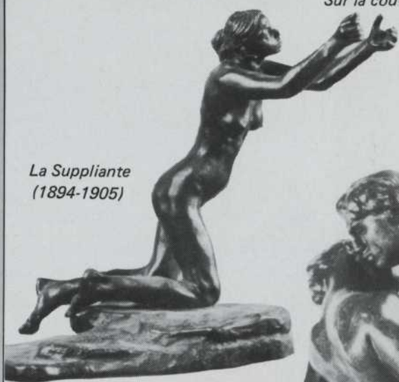
La Suppliante (1894-1905)

Sur la couverture: L'Abandon (1888-1905)