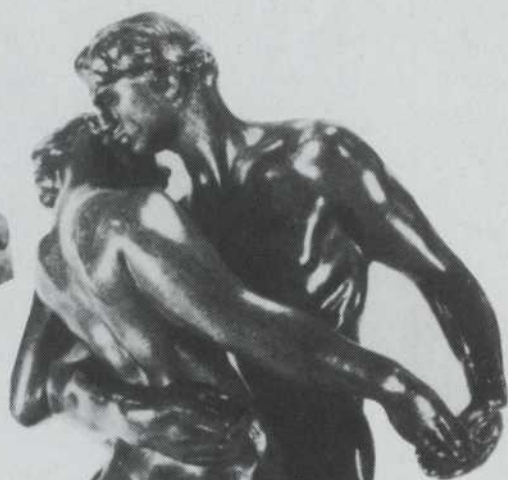
La Valse (1891-1905)