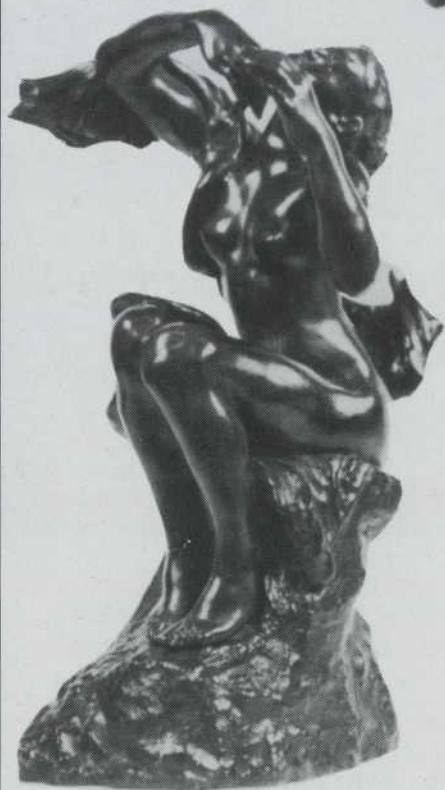
La petite Sirène (1900-1905)