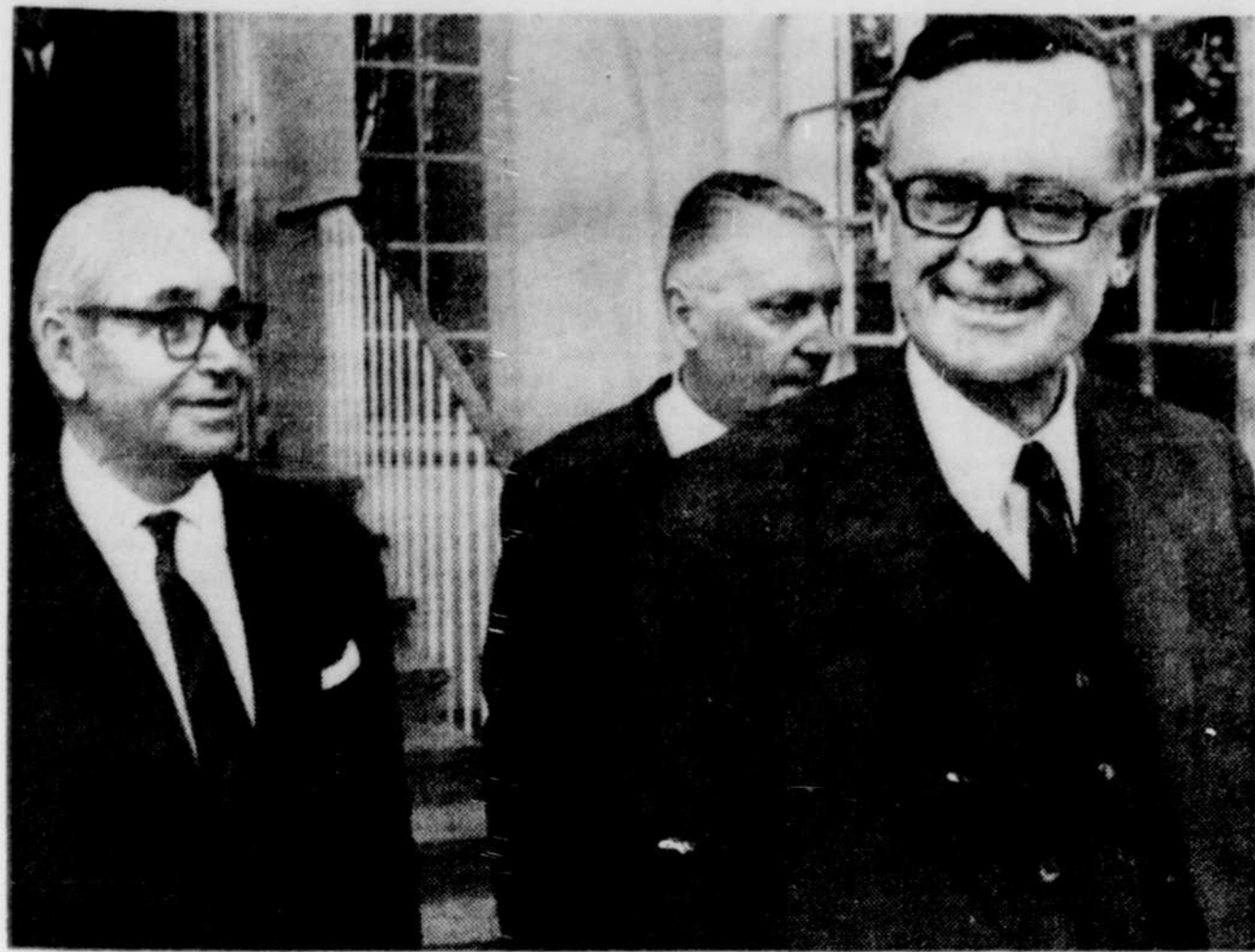
LE MINISTRE DE L'ECONOMIE de l'Allemagne de l'Ouest, M. Karl Schiller, à droite et le président de la Bundesbank de l'Allemagne de l'Ouest, M. Karl Blessing, quittent la chancellerie à Bonn, où s'est tenue, hier une réunion, pour envisager les mesures à prendre devant

l'ampleur croissante de la spéculation internationale misant sur la réévaluation du deutsche mark. On sait que les autorités fédérales ont décidé de ne pas réévaluer le mark.