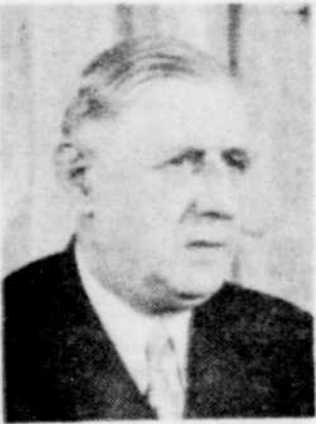
M. Charles de Gaulle

Dans la région du Pas-de-Calais, dans le nord de la France, où le général est propriétaire d'une ferme, les gens sont d'avis que de Gaulle passera les prochains mois à voyager à travers la France, renouant les liens familiaux qui avaient forcément été négligés durant la période qu'il a passée à la présidence.