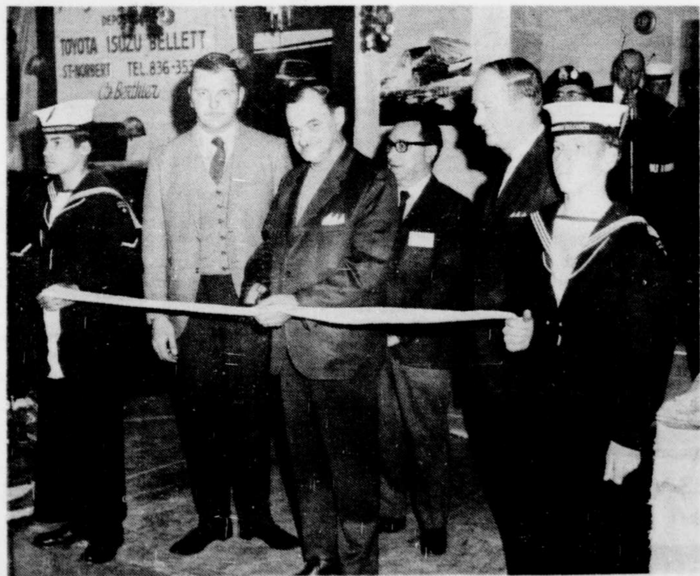
LE PREMIER MAGISTRAT DE LA CITE de Joliette coupe le ruban, marquant ainsi l'ouverture de la grande exposition commerciale et sportive de Joliette. Assistent à la

Les personnes présentes pourront connaître les principaux développements concernant la sécurité de la protection civile du Québec. Il va sans dire que ce sera une réunion très importante pour les membres de la protection civile et pour toutes les personnes également qui sont intéressées à la cause du secourisme. Par les années antérieures les groupes de la protection civile du Québec ont rendu de très grands services à la population et c'est pourquoi, il est très important de souligner les immenses services qu'a pu rendre la protection civile du Québec.