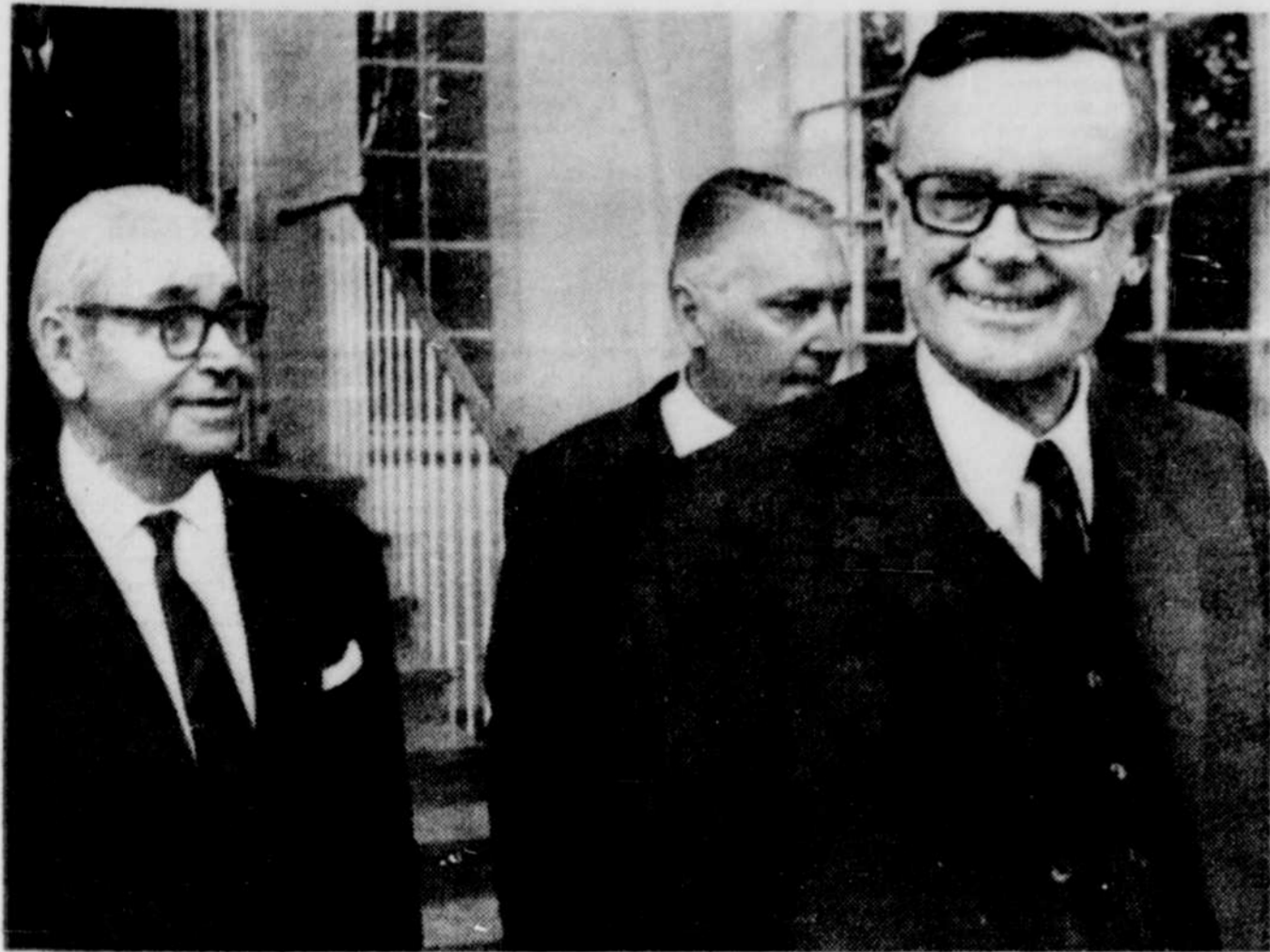
LE MINISTRE DE L'ECONOMIE de l'Allemagne de l'Ouest, M. Karl Schiller, à droite et le président de la Bundesbank de l'Allemagne de l'Ouest, M. Karl Blessing, quittent la chancellerie à Bonn, où s'est tenue, hier une réunion, pour envisager les mesures à prendre devant