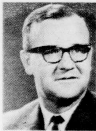
M. Roch Lasalle

d'oeuvre au Canada et qu'on lui fait des conditions intolérables à l'heure actuelle, et considérant également que cette condition est néfaste pour l'économie du pays, le député conservateur croit que le gouvernement se doit de trouver des solutions au problème et s'assurer égale-