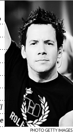
Simple Plan

SD : semaine dernière CS : cette semaine