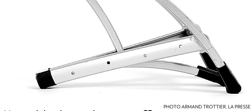
Morceau de bicyclette recyclé en support à CD.

Prolongez le boycottage de Greenpeace contre les Kleenex