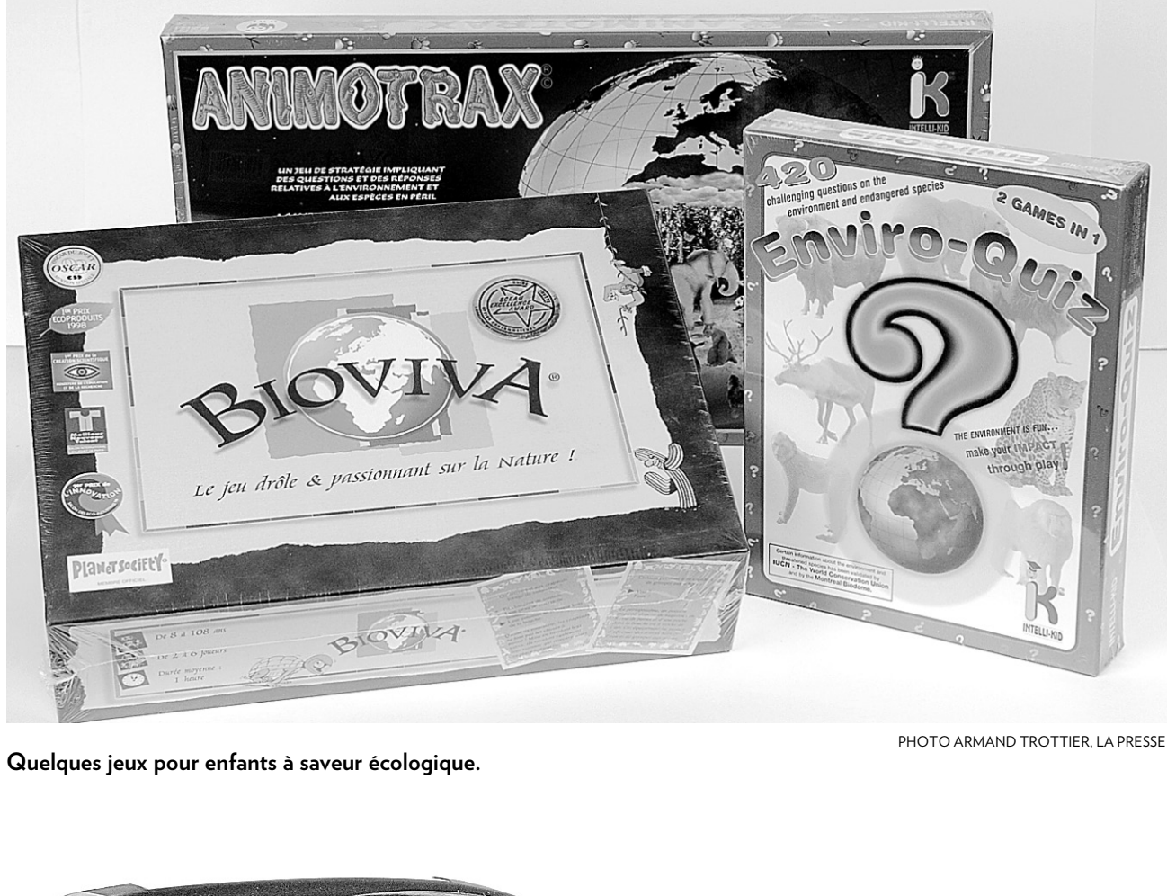
Quelques jeux pour enfants à saveur écologique.

Parmi les bidules les plus sympathiques, mentionnons ceux qui feront économiser des piles. Ainsi, quelques tours à la dynamo de la télécommande universelle