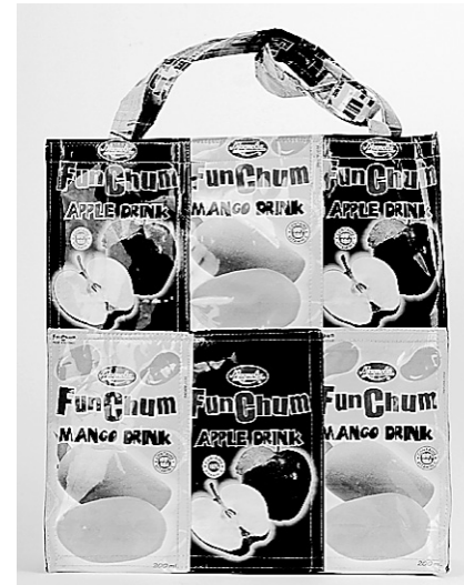
Sac à main fait de boîtes de jus récupérées.

Si la plume vous semble trop snob, sachez qu'il existe des stylos biodégradables, faits à partir d'amidon de maïs. On en trouve à la Coop la