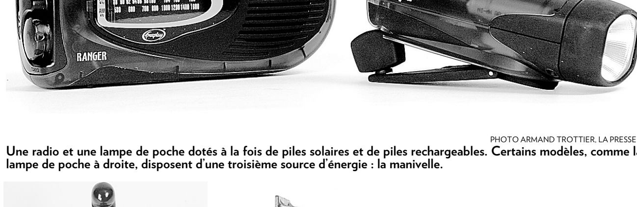
Une radio et une lampe de poche dotés à la fois de piles solaires et de piles rechargeables. Certains modèles, comme la lampe de poche à droite, disposent d'une troisième source d'énergie: la manivelle.