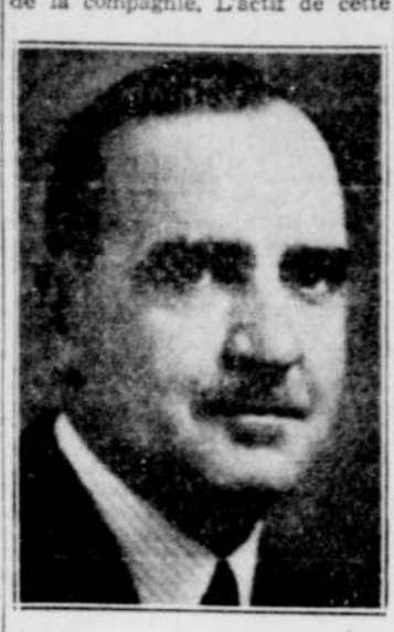
L'hon. Alphonse RAYMOND

Le rapport présenté à la 109e assemblée annuelle de la Compagnie d'Assurance Stanstead & Sherbrooke atteste le progrès soutenu de cette grande entreprise. Les revenus bruts se sont élevés par $92,478 et les revenus nets par $77,129. Après déduction de $20,000 en dividendes, un résidu de $57,129 a été ajouté au surplus de la compagnie. L'actif de cette