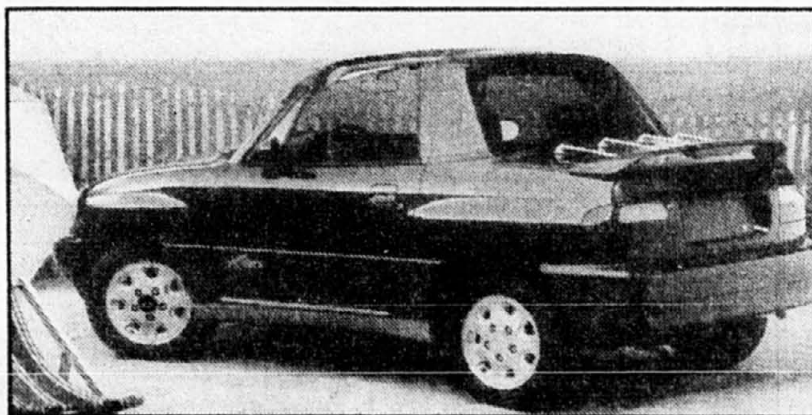
La nouvelle Suzuki X-90

Au premier coup d'oeil, la X-90 surprend par son allure qui nous permet de croire que ce véhicule sort tout droit d'une bande dessinée. Mais il ne faut pas