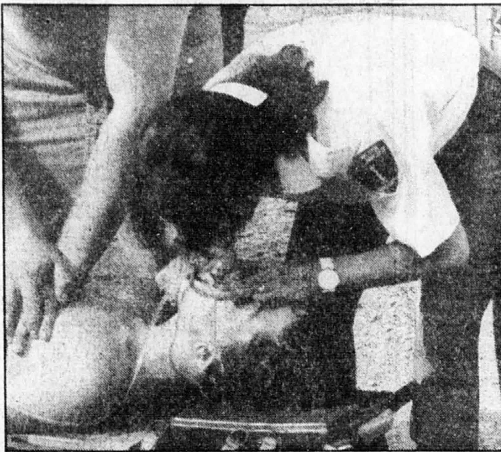
Atout Plus offre un cours de réanimation cardio-respiratoire pour apprendre les gestes qui sauvent.

● Pour proches d'un suicidé. Le groupe d'entraide Après le suicide d'un être cher tient une rencontre d'échange avec des gens ayant vécu la même chose pour y trouver support, compréhension et écoute. Le jeudi 11 janvier à 19 h, métro McGill (adresse donnée à l'inscription). Entrée gratuite. Inscription au 737-4443.