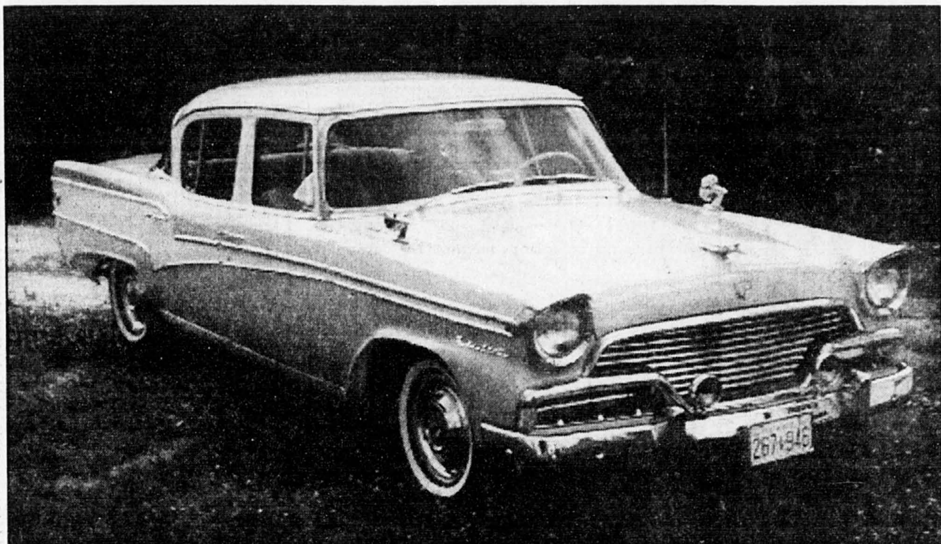
La Studebaker President Classic 1956, une voiture qu'on ne voit pas souvent.