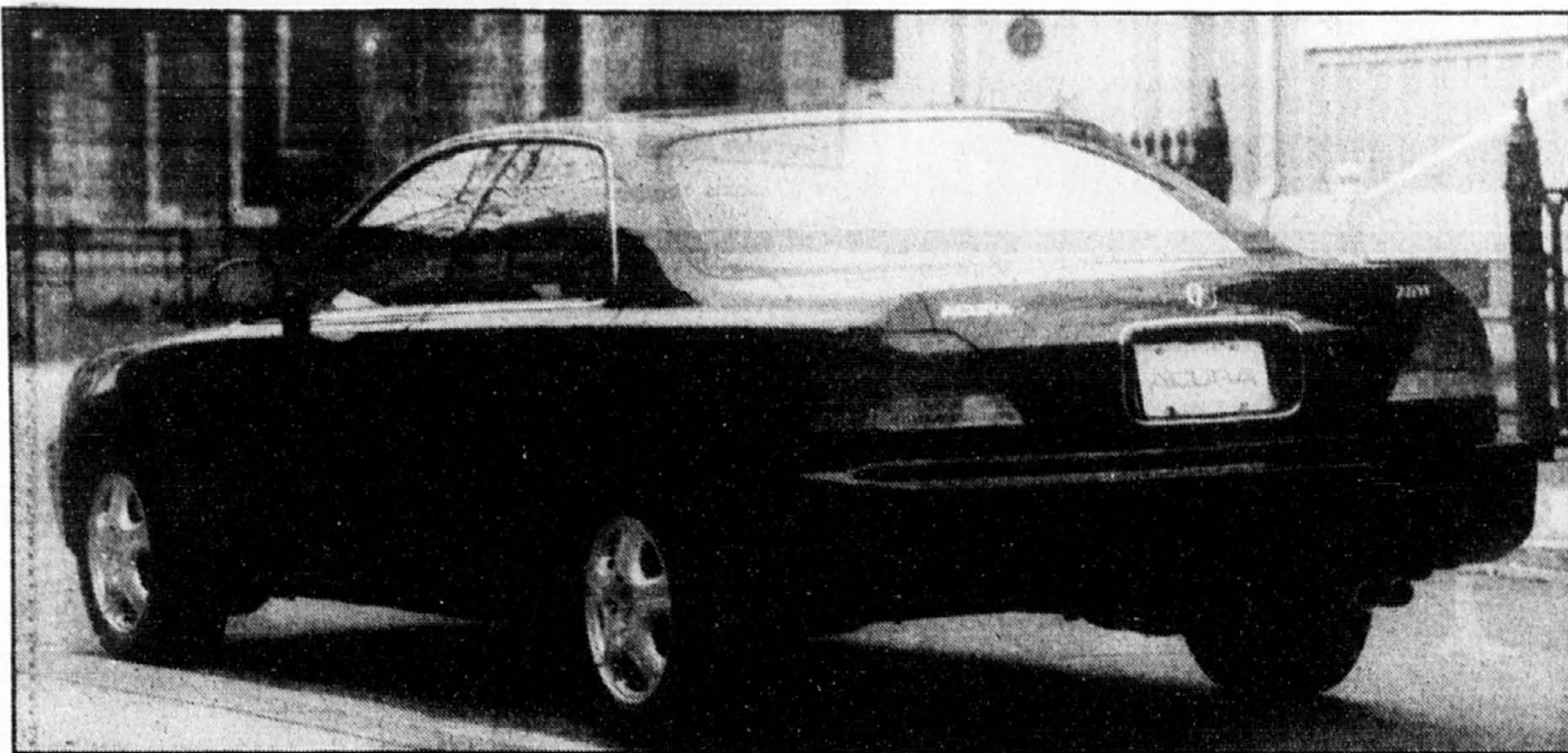
On reconnaît, sous cet angle arrière de l'Acura, un design propre aux stylistes de Honda.