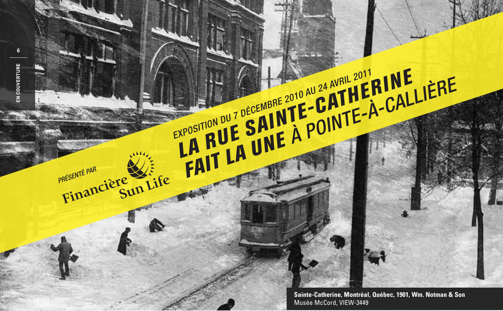
Sainte-Catherine, Montréal, Québec, 1901, Wm. Notman & Son Musée McCord, VIEW-3449

EXPOSITION DU 7 DÉCEMBRE 2010 AU 24 AVRIL 2011 LA RUE SAINTE-CATHERINE FAIT LA UNE À POINTE-À-CALLIÈRE