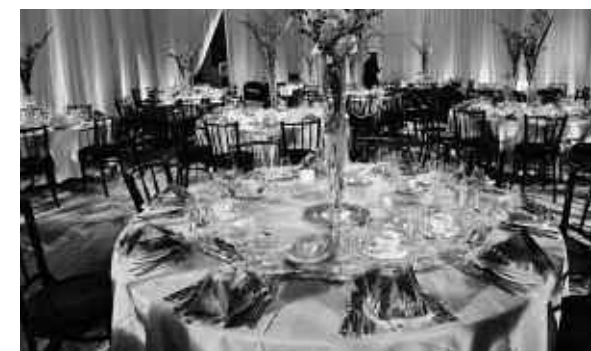
Soirée des Grands Mécènes tenue chez Walter Technologies pour Surface le 17 novembre dernier.