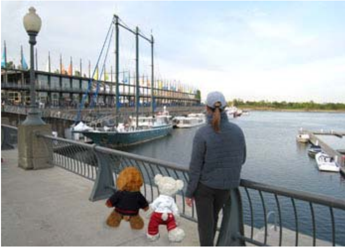
Mademoiselle X et les deux mascottes, Monsieur X et sa soeur Miss Gym, devant le navire Sedna IV à Montréal. www.sedna.tv

«Il est préférable d'avoir de très gros défauts plutôt que de toutes petites qualités.» -Frédéric Dard