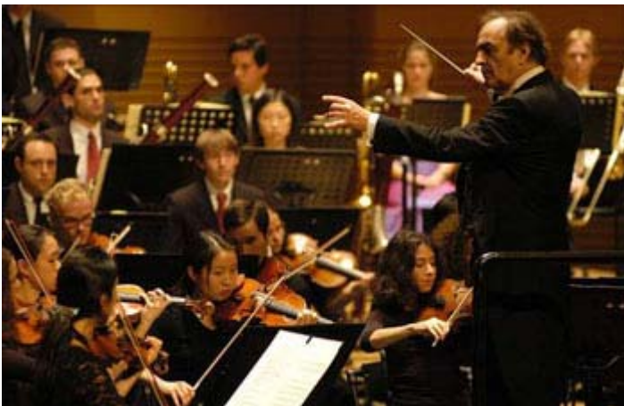
Charles Dutoit au Festival de Pékin

La nouvelle tendance en musique sera les concerts sans musiciens . Aussi étrange que cela puisse paraître, il existe maintenant des programmes que l'on installe sur un ordinateur et qui peuvent reproduire précisément le travail des musiciens. La qualité est tellement bonne qu'un journal américain a fait un test avec des professeurs de musique. On leur a fait écouter trois extraits dont un seul était interprété par un ordinateur. Les professeurs ont été confondus et ils n'ont pas pu reconnaître la musique originale. Ce développement permettrait à des orchestres symphoniques de pouvoir