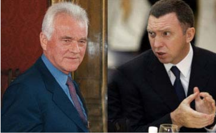
Frank Stronach et Oleg Derispaka

Le fondateur de MAGNA International Frank Stronach (75 ans) a perdu Chrysler mais il a gagné un associé en la personne du fameux Russe Oleg Derispaka (39 ans). Ce nouvel associé a acheté la moitié de MAGNA pour la somme de 1,54 milliards $. Mais au-delà de la transaction financière, l'avantage est que cela permet à l'entreprise canadienne d'entrer en force sur le marché russe des pièces automobiles. Il y a lieu de s'interroger aussi si Frank Stronach vendra pas éventuellement toute sa participation pour se concentrer dans l'opération des pistes de courses de chevaux. Il est un très grand amateur de chevaux .