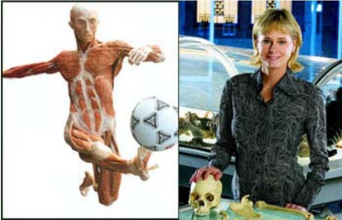
Affiche d'exposition et l'auteur Kathy Reichs