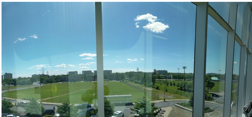
Vue du gym Econofitness de la place Viau