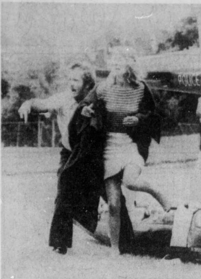
Cette femme a survécu au naufrage du radeau pneumatique qui a chaviré hier près des chutes Niagara. Tout d'abord rescapée par un hélicoptère de la police ontarienne, elle a ensuite été dirigée en ambulance vers un hôpital américain de Niagara Falls. 29 personnes occupaient le radeau, et 26 ont survécu.