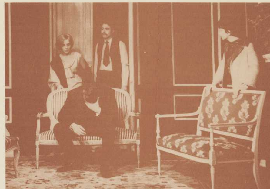
Deuxième spectacle de la saison, Huis-Clos de Jean-Paul Sartre.