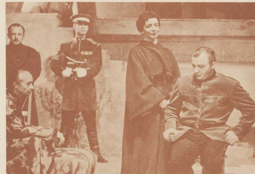
Notre prochain spectacle: Le Comportement des époux Bredburry de Billetdoux.