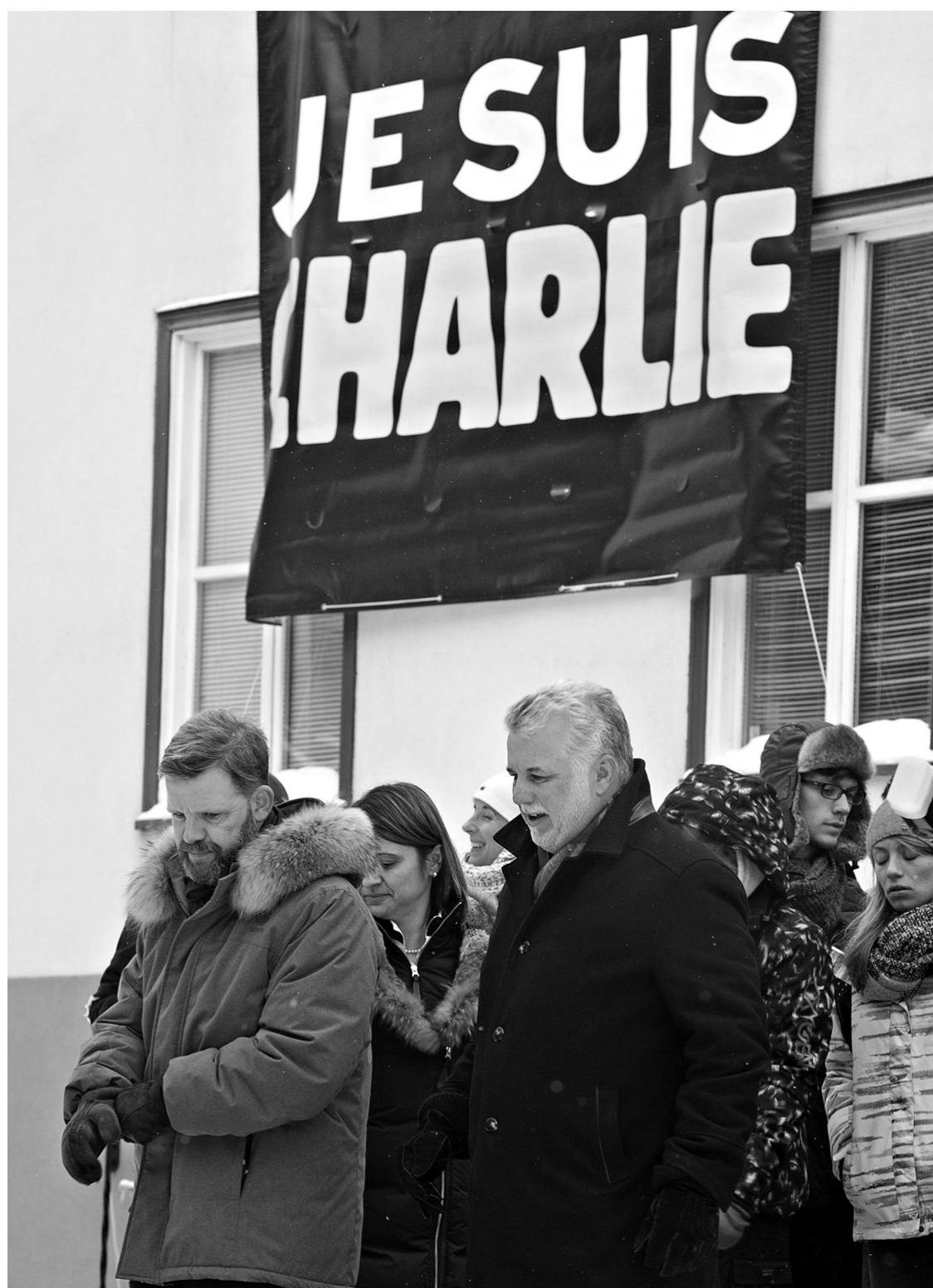
Philippe Couillard a participé à la marche de solidarité à Québec à la suite des attentats de Paris.

Or, pour Djemila Benhabid et Zineb El Rhazoui, la journaliste de Charlie Hebdo qui était de passage au Québec cette semaine, l'intégrisme,