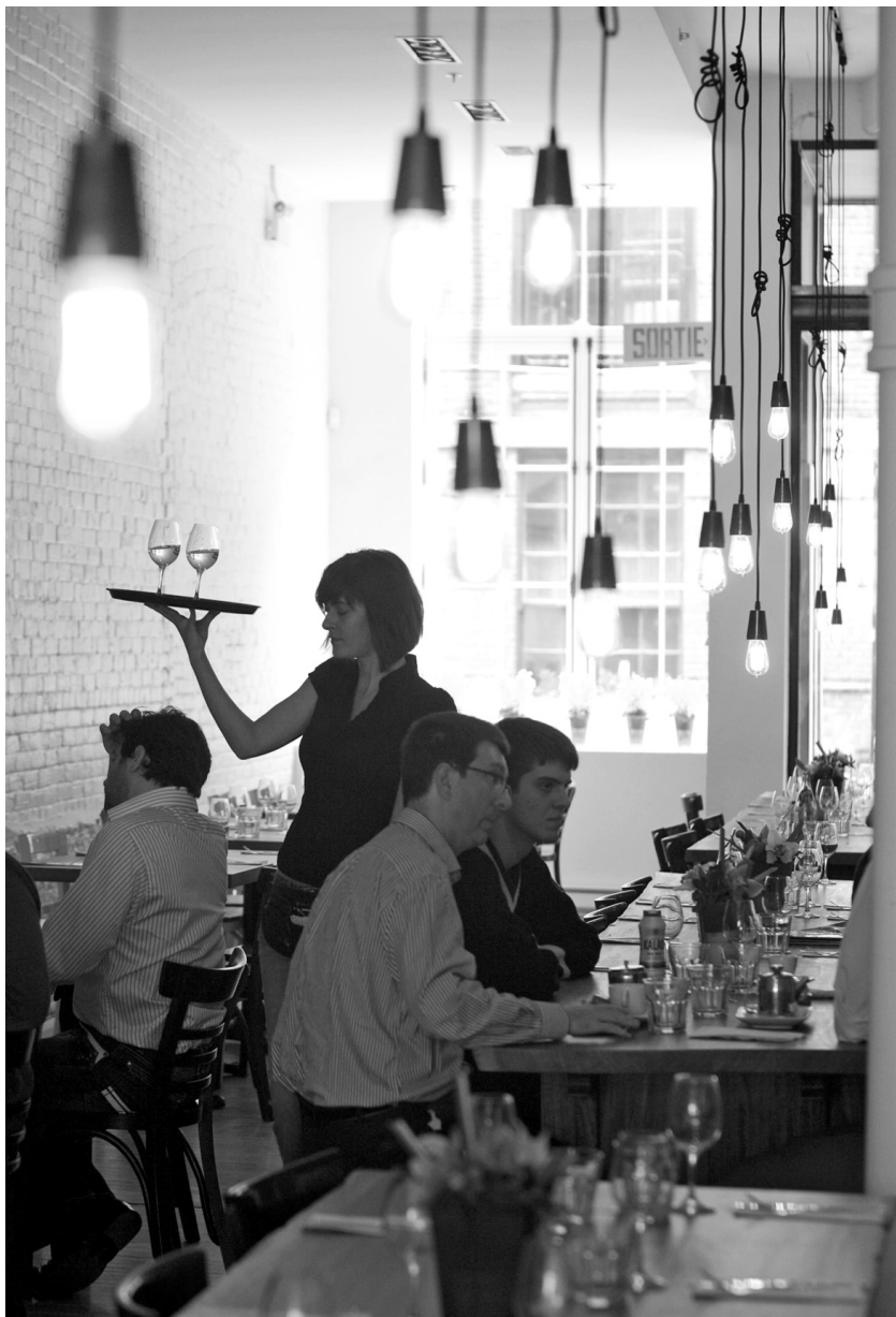
JEAN-FRANÇOIS LEBLANC LE DEVOIR

Or, qu'est-ce qu'un bon restaurant? C'est celui qui est plein. Ce sont les clients qui, en définitive, rendent le jugement. Un jeune enthousiaste a le droit, si ça lui chante, de faire à manger mieux et/ou de facturer moins cher qu'une de ces « institutions » poussiéreuses dont l'obsolescence, inéluctable, ne blesse que le capitalisme de leur di-