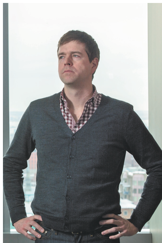
PEDRO RUIZ LE DEVOIR

Des commentaires ? Écrivez à Antoine Robitaille : arobitaille@ledevoir.com . Pour lire ou relire les anciens textes du Devoir de philo ou du Devoir d'histoire : www.ledevoir.com/societe/le-devoir-de-philo