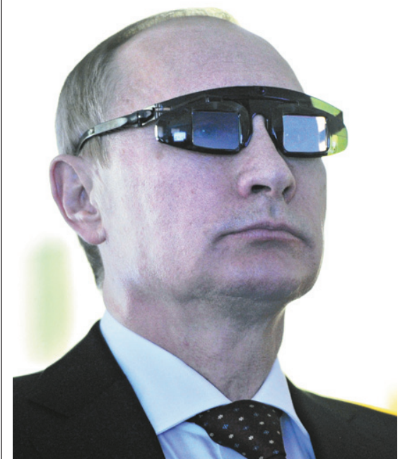
Vladimir Poutine