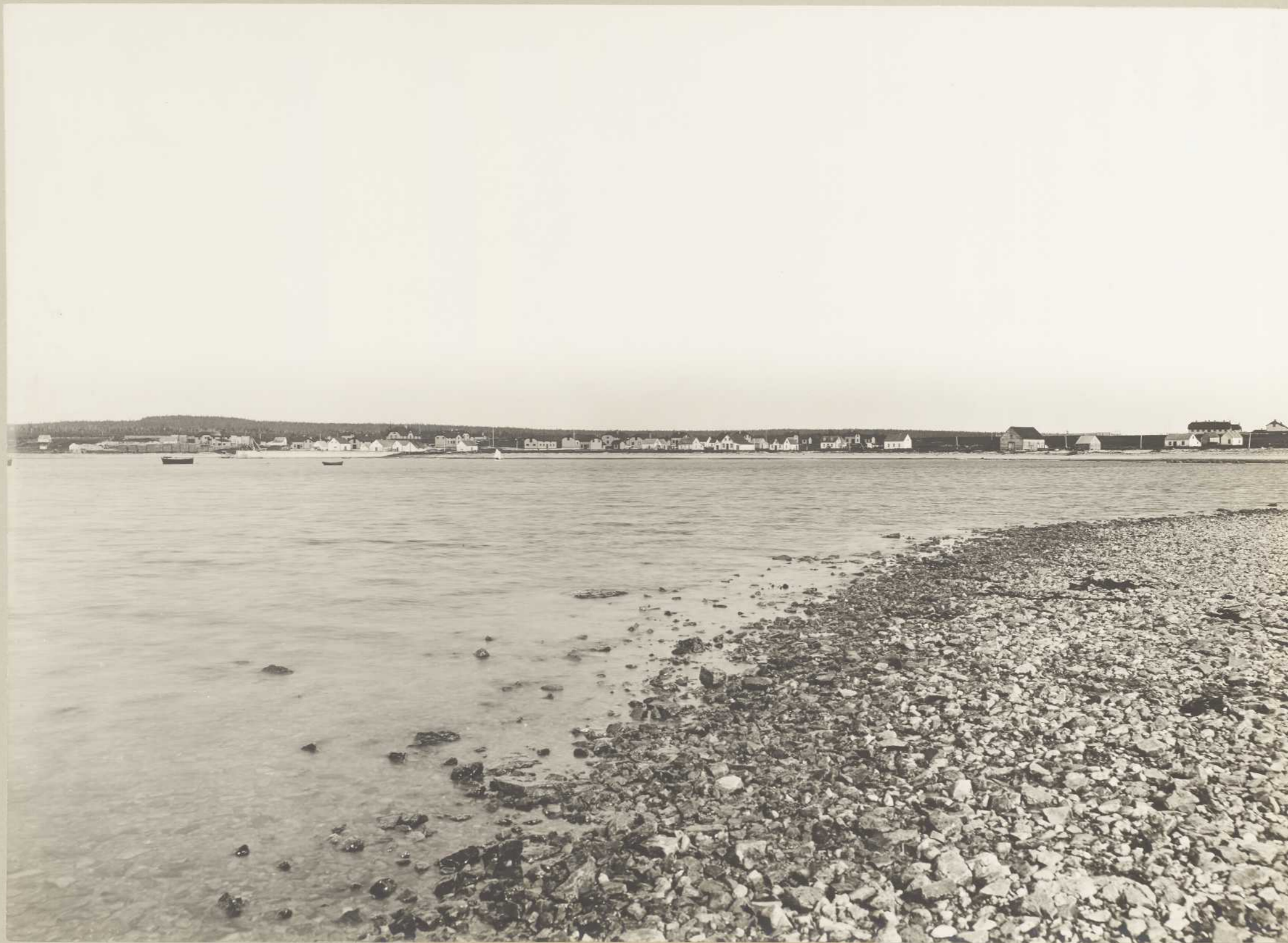
VUE G 1 e DE LA BAIE SAINTE-CLAIRE (Anticosti)