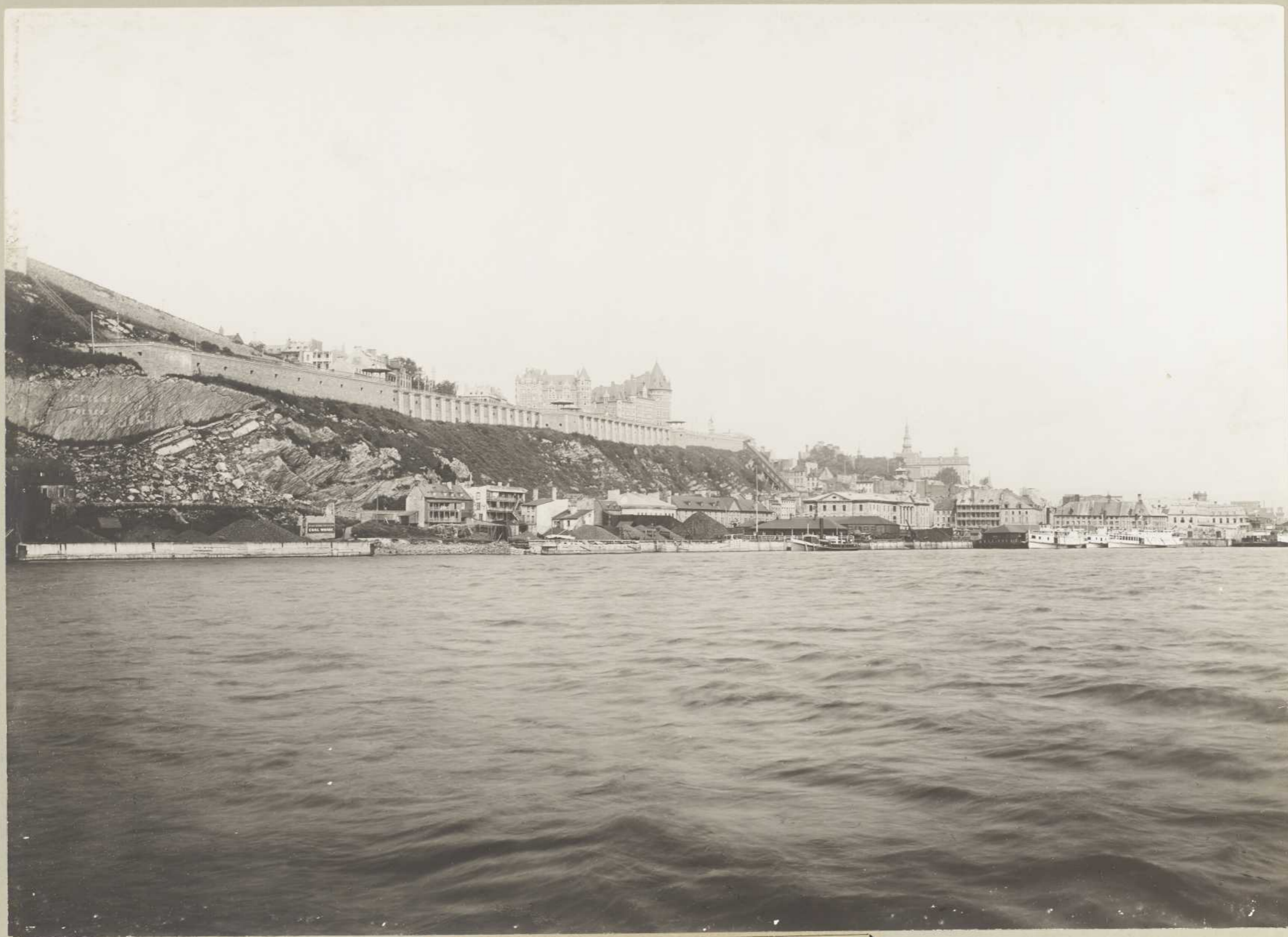
VUE DE QUÉBEC (Canada)