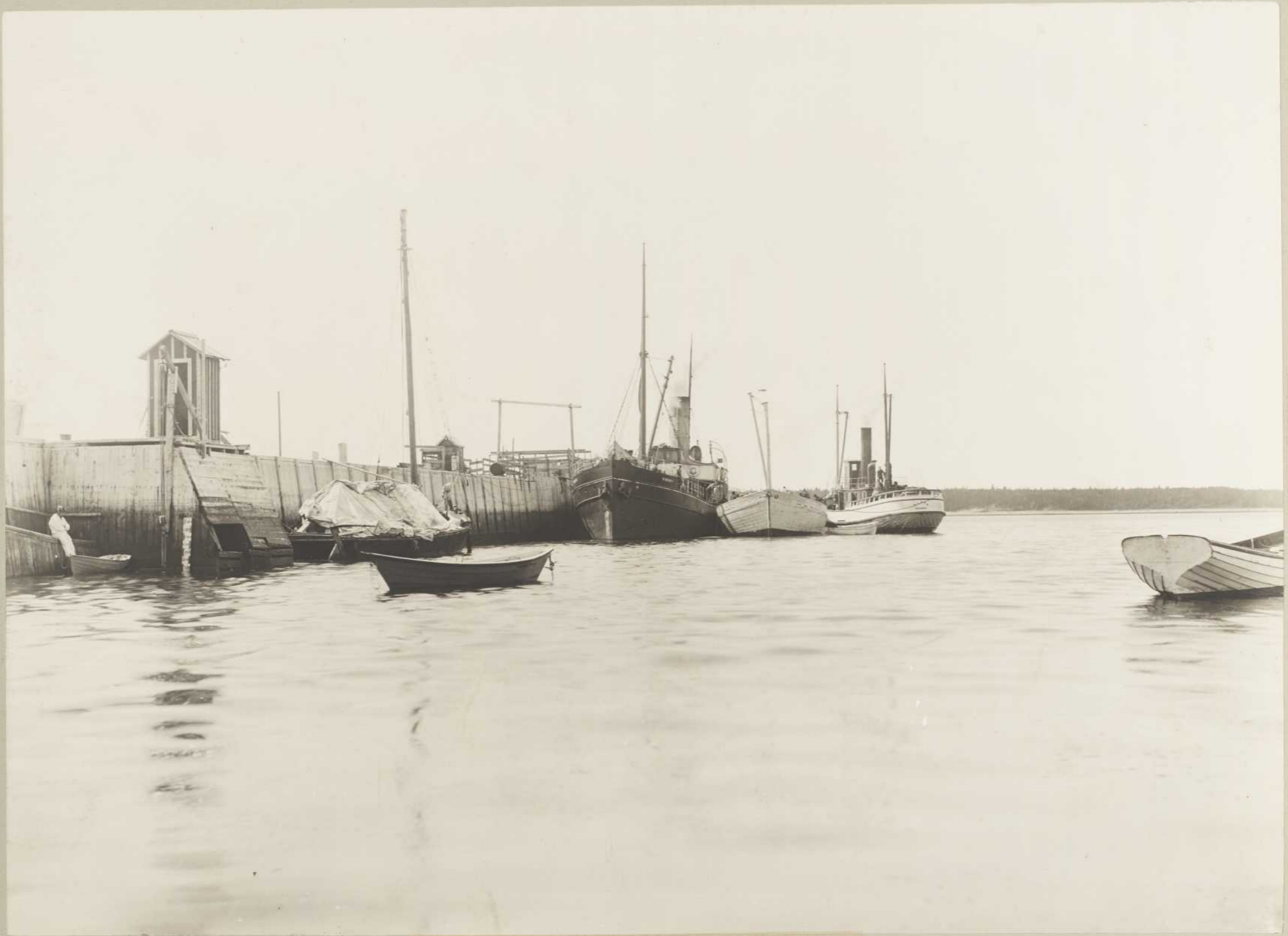
PORT JOLLIET, BAIE ELLIS (Anticosti)