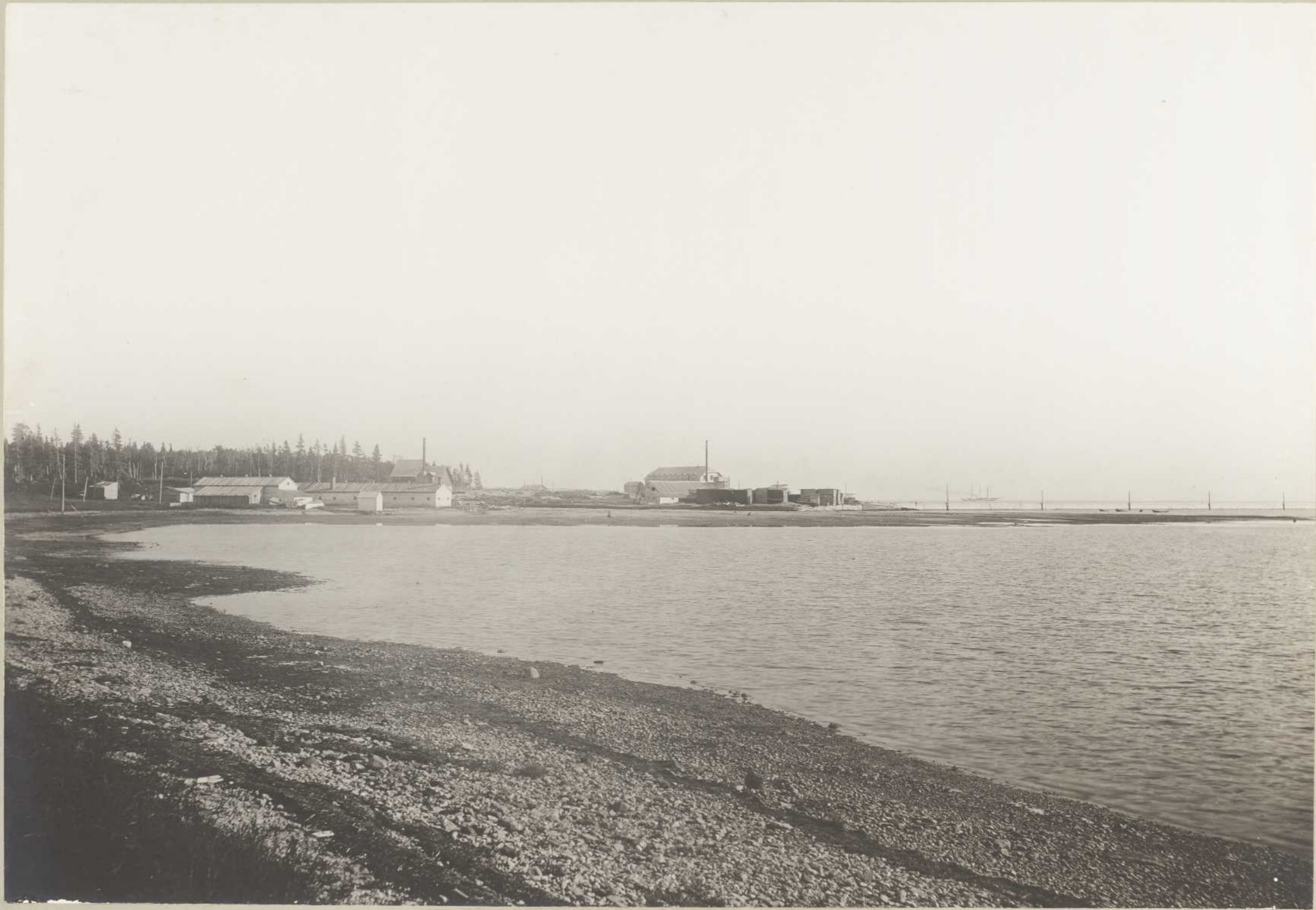
SCIERIE ET DIGUE, PORT JOLLIET (Anticosti) (BAIE ELLIS)