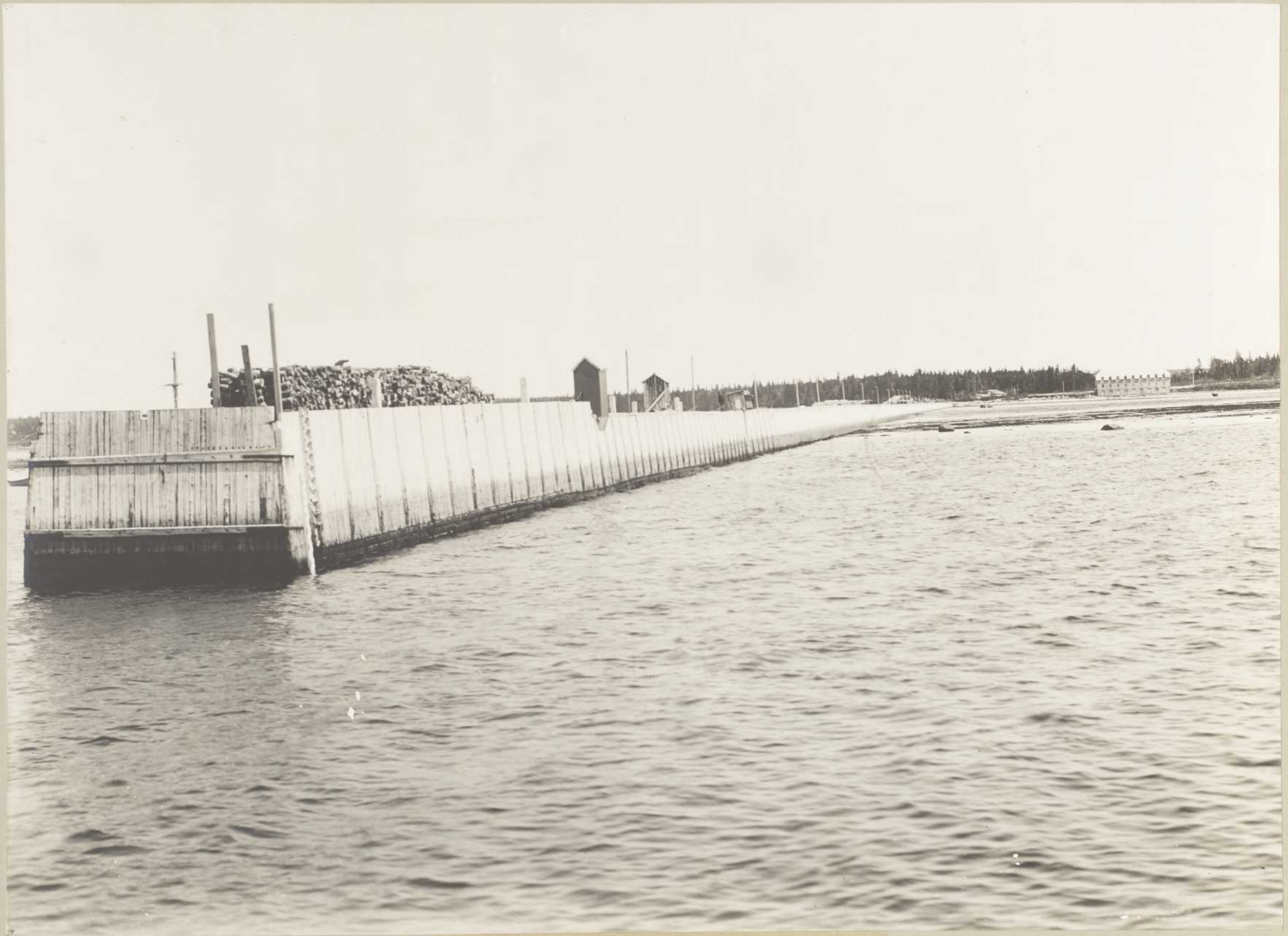
DIGUE, PORT JOLLIET (Anticosti) (BAIE ELLIS)