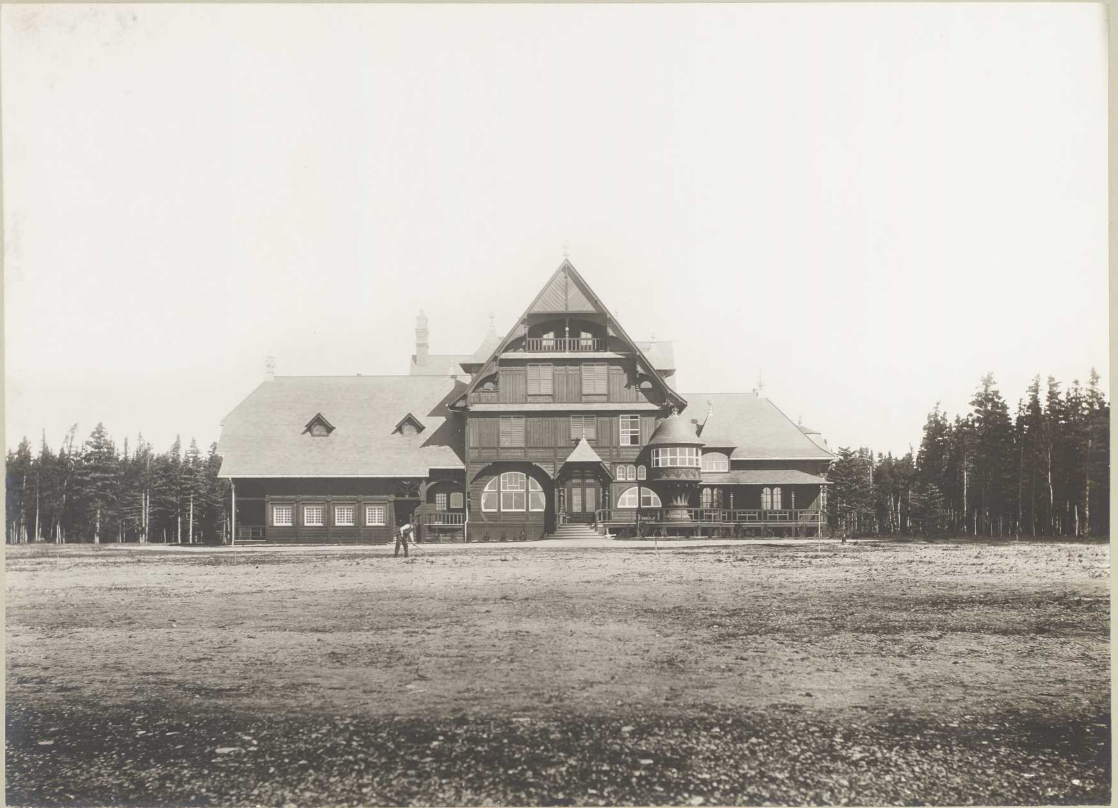
VILLA, BAIE ELLIS (Anticosti)