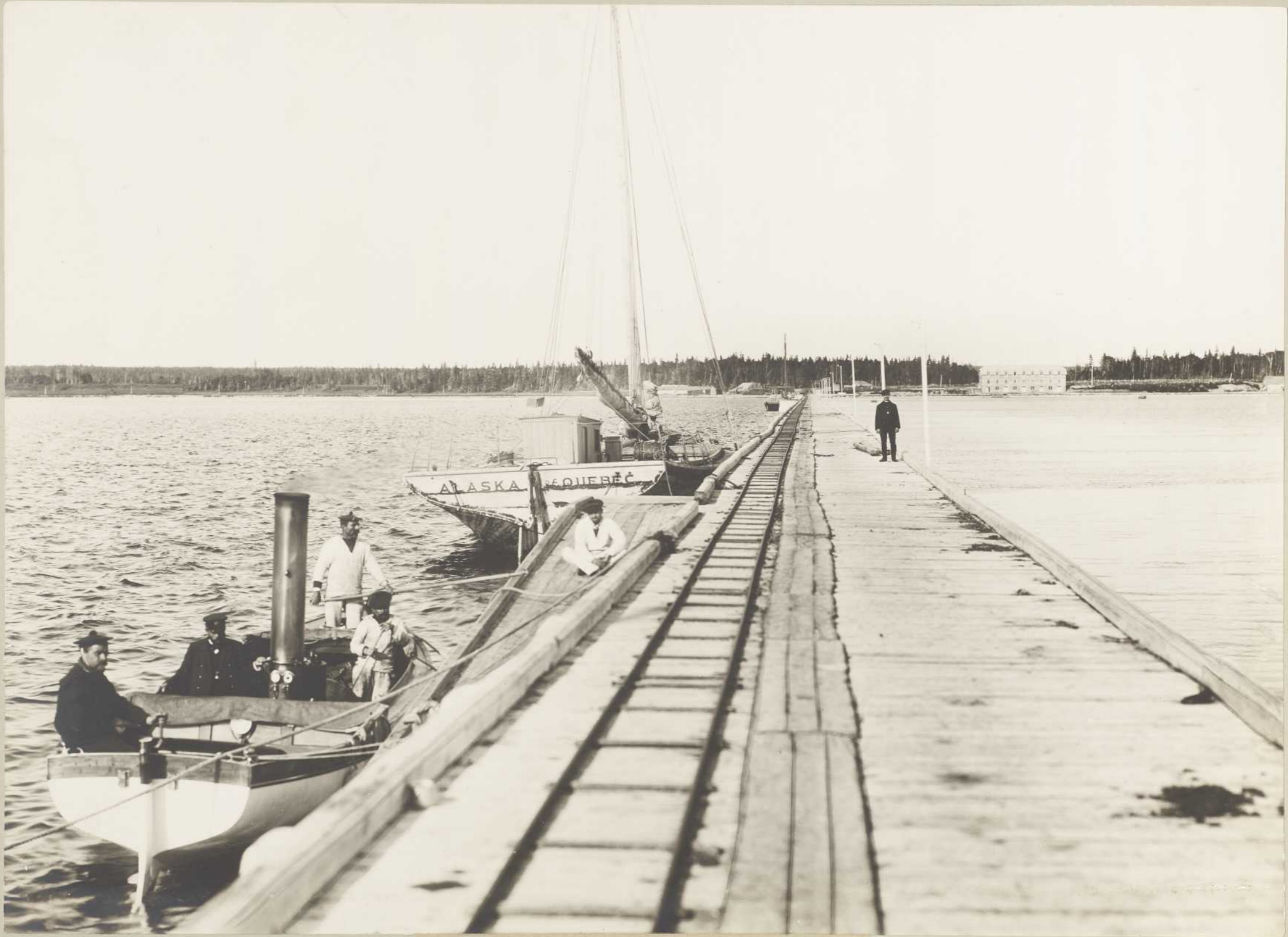
PORT JOLLIET, BAIE ELLIS (Anticosti)