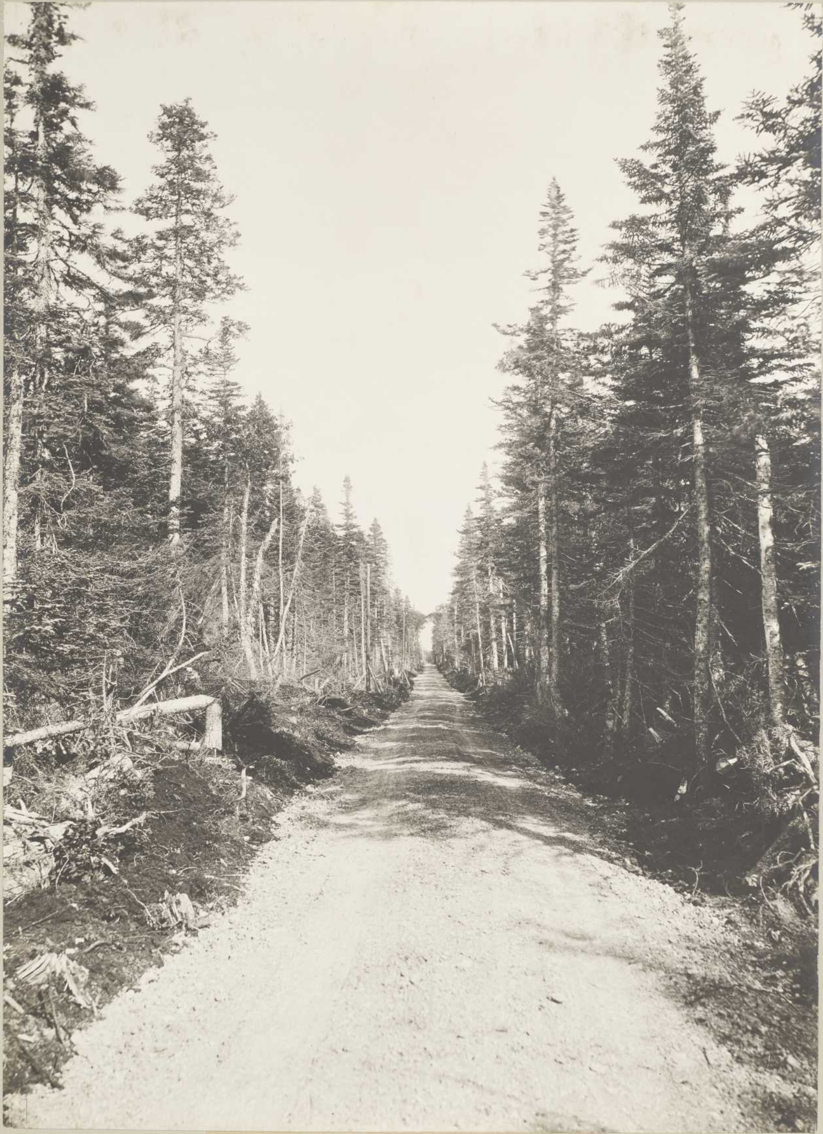
ROUTE DE LA BAIE ELLIS (Anticosti)