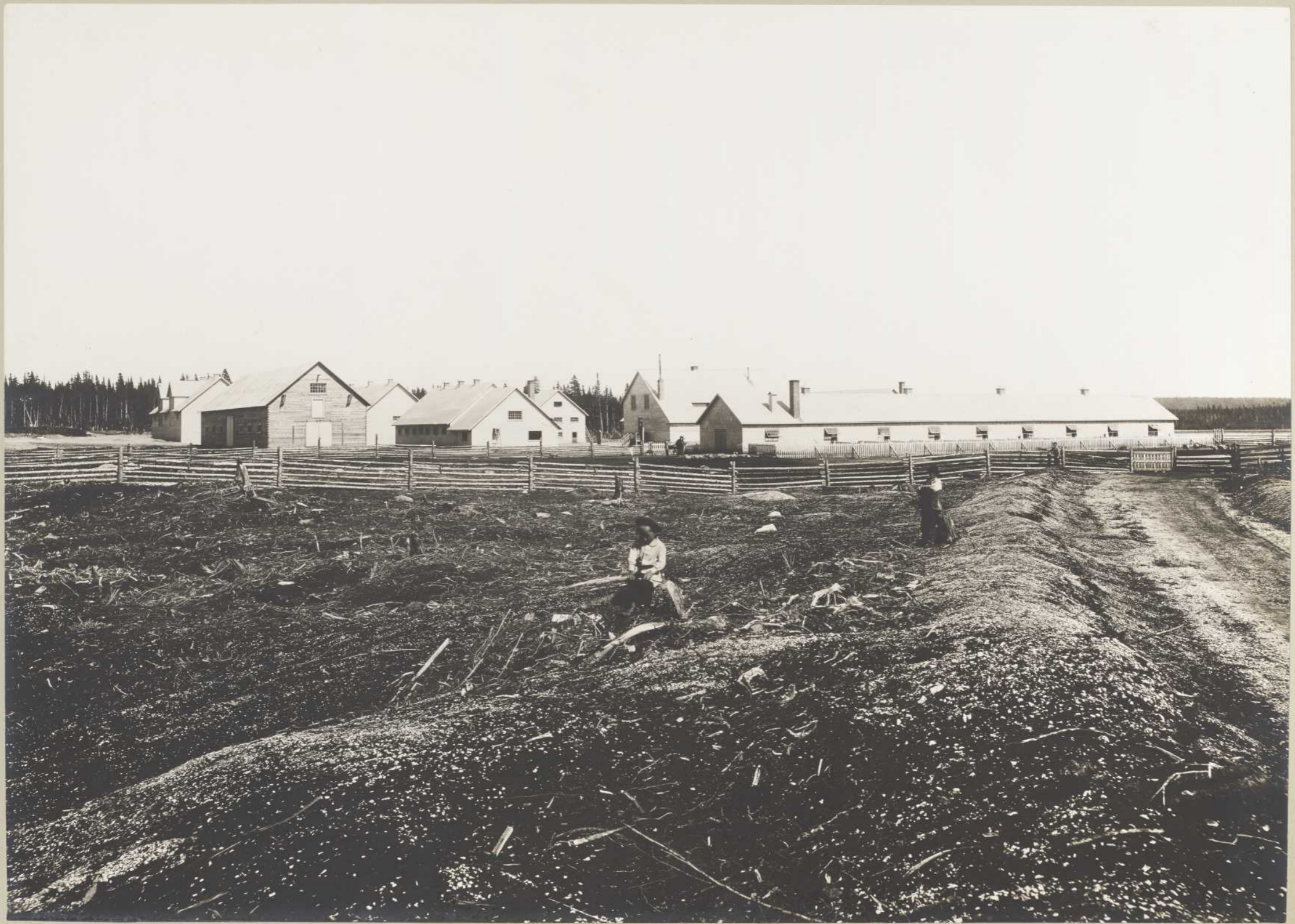
FERME SAINT-GEORGES (Anticosti)