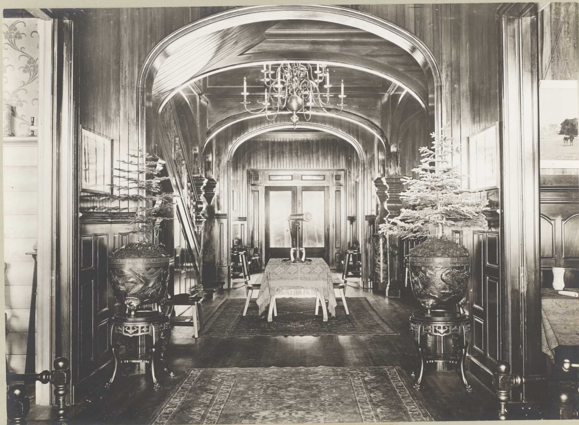
VILLA DE LA BAIE ELLIS — LE VESTIBULE (Anticosti)