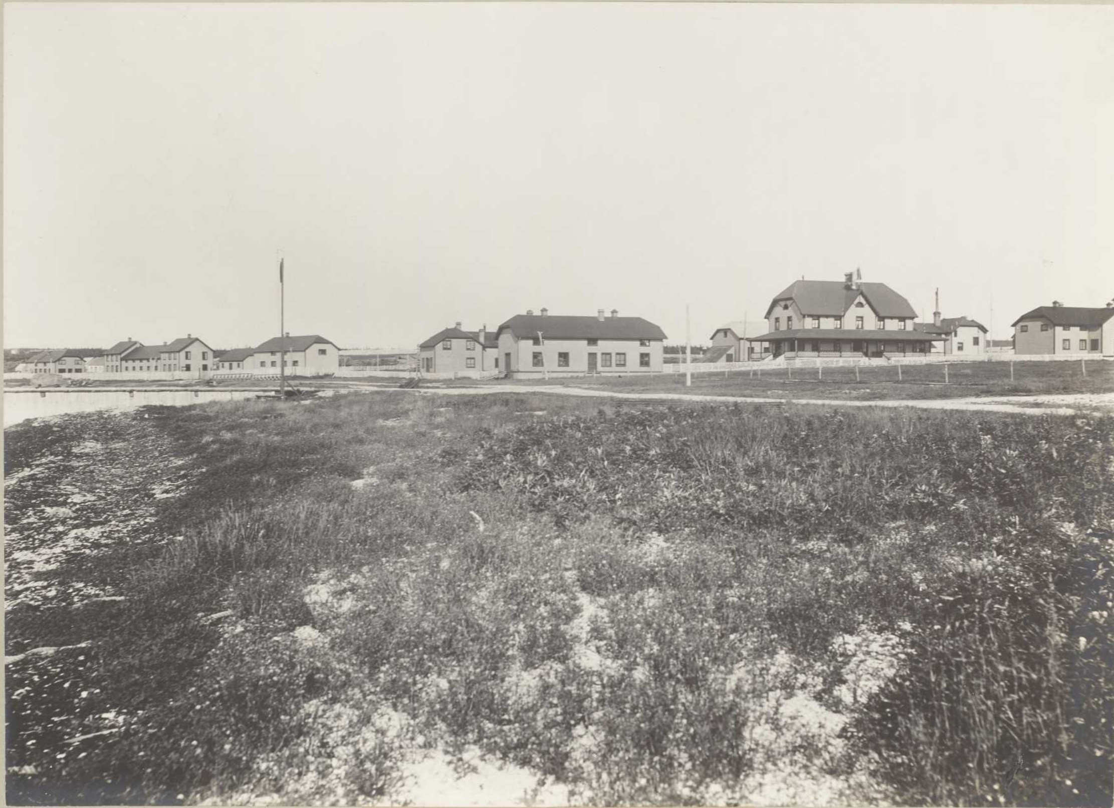
ADMINISTRATION, BAIE SAINTE-CLAIRE (Anticosti)