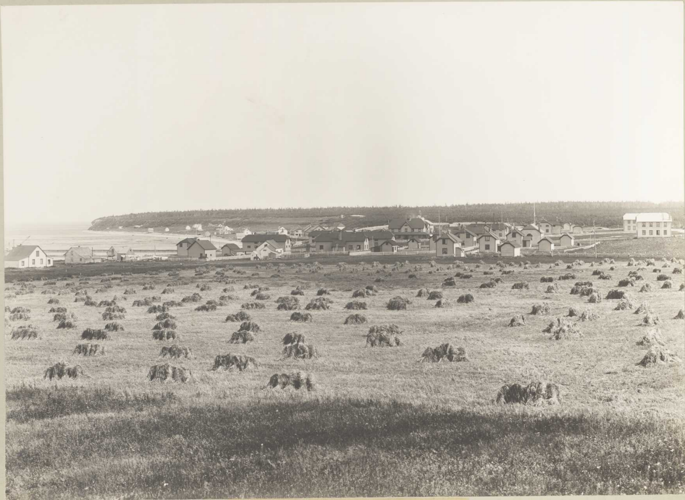
VUE G 1 o DE LA BAIE SAINTE-CLAIRE (Anticosti) LES MOISSONS