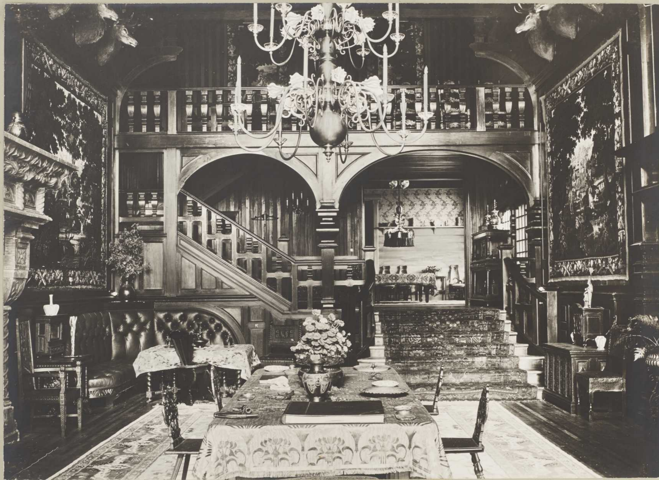
VILLA — HALL ET SALLE A MANGER (Anticosti) (BAIE ELLIS)