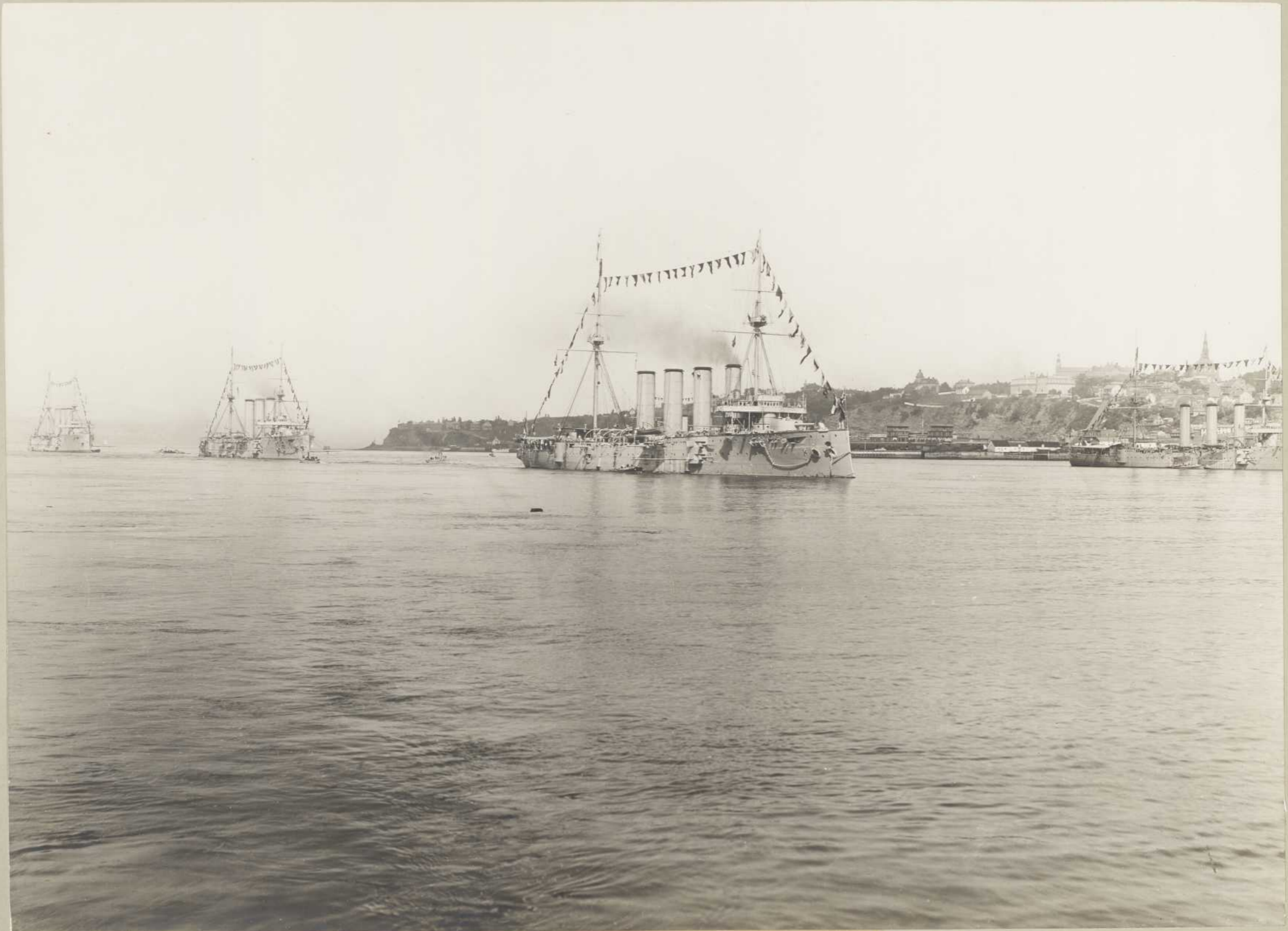
ESCADRE ANGLAISE A QUÉBEC