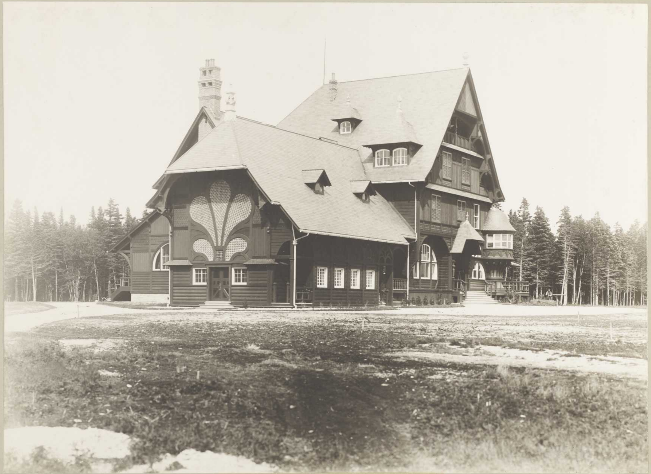
VILLA, BAIE ELLIS (Anticosti)