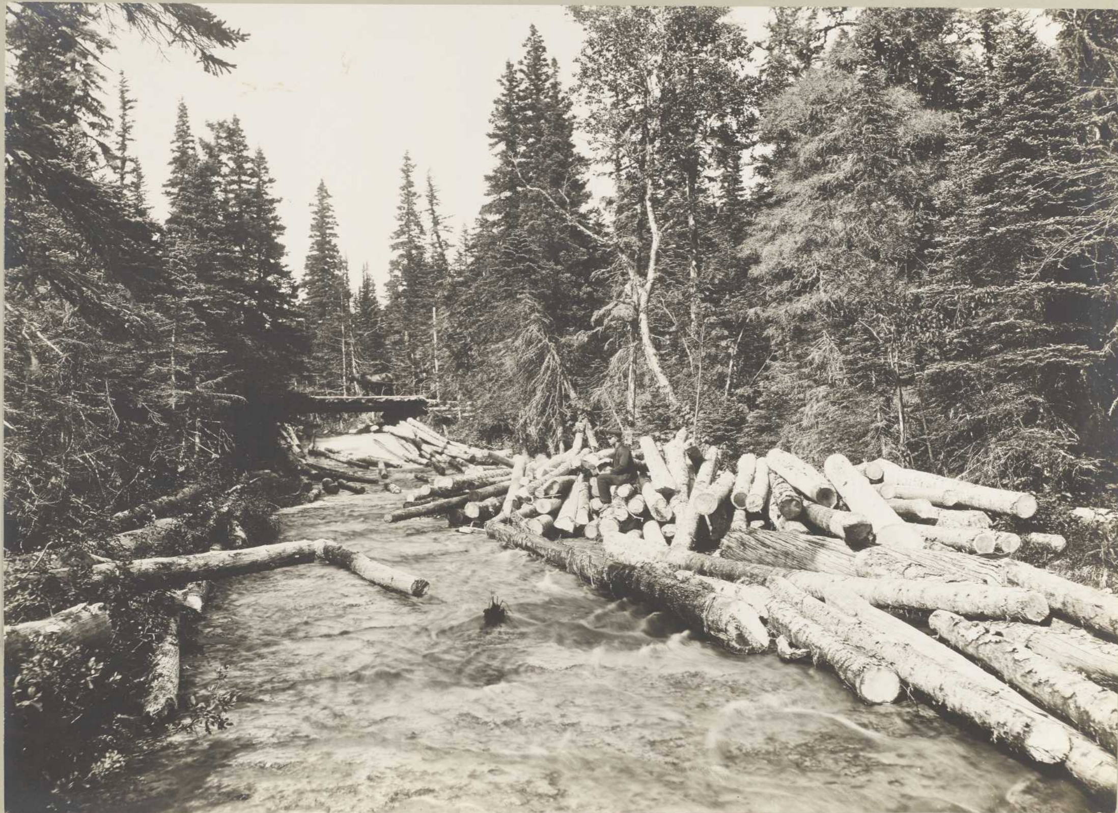
DRAVAGE DE BOIS, RIVIÈRE PLANTIN (Anticosti)