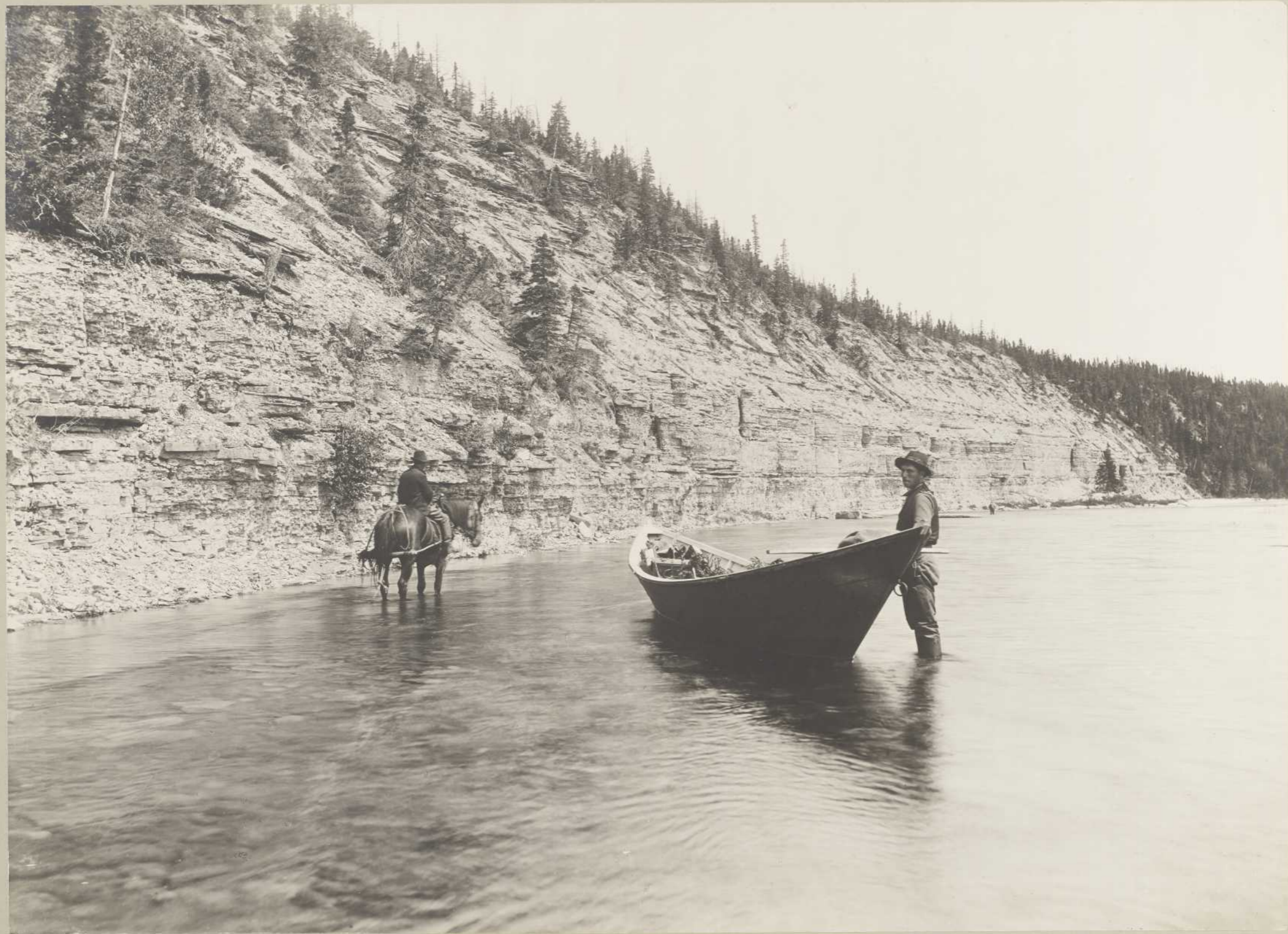
RIVIÈRE JUPITER (Anticosti)