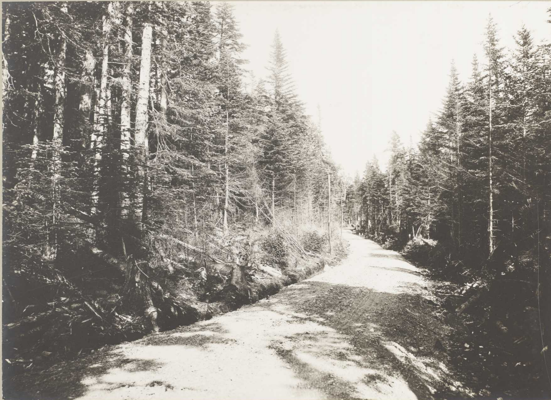
ROUTE DE LA BAIE ELLIS (Anticosti)