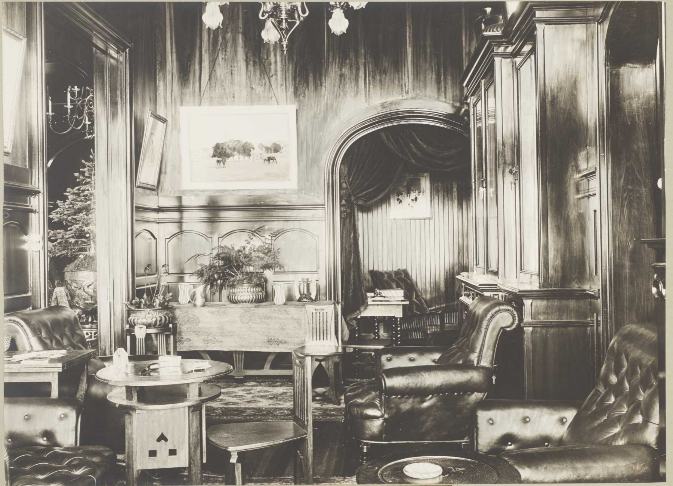
VILLA DE LA BAIE ELLIS — LE FUMOIR (Anticosti)