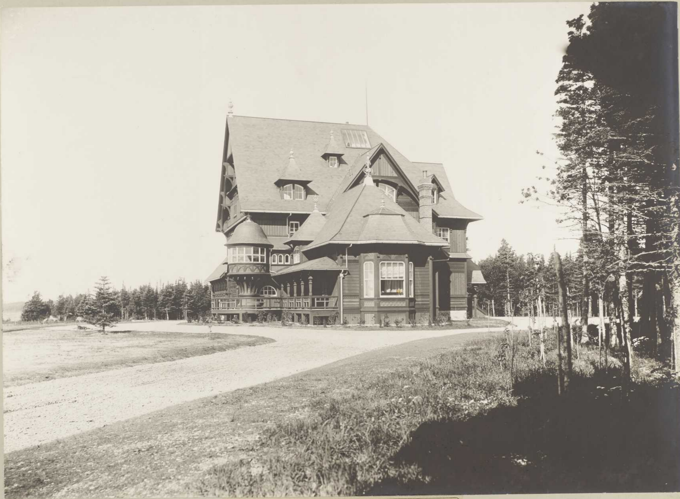
VILLA, BAIE ELLIS (Anticosti)