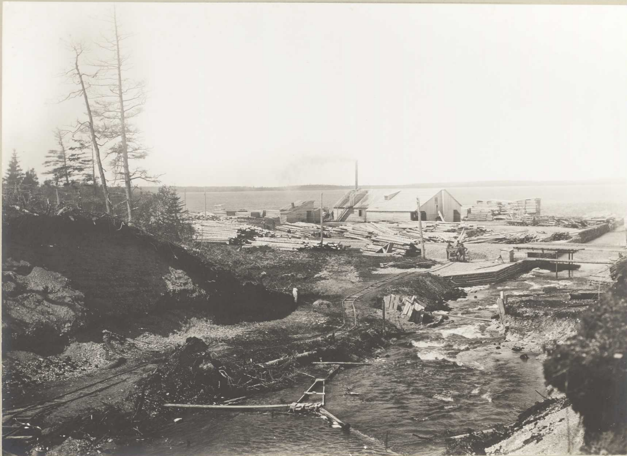
SCIERIE DE PORT JOLLIET (Anticosti) (BAIE ELLIS)