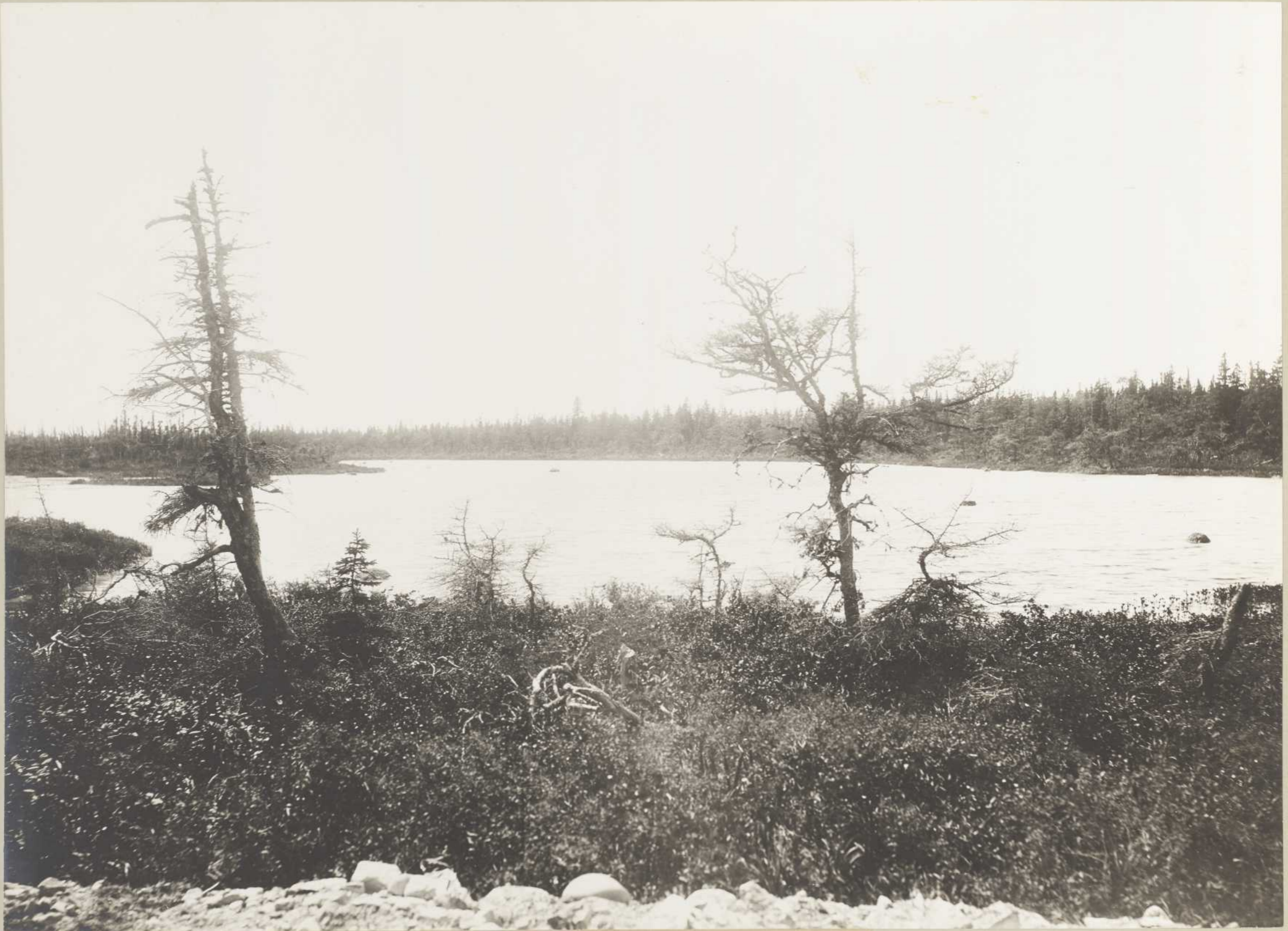
LAC DU PARC AUX RENARDS (Anticosti)