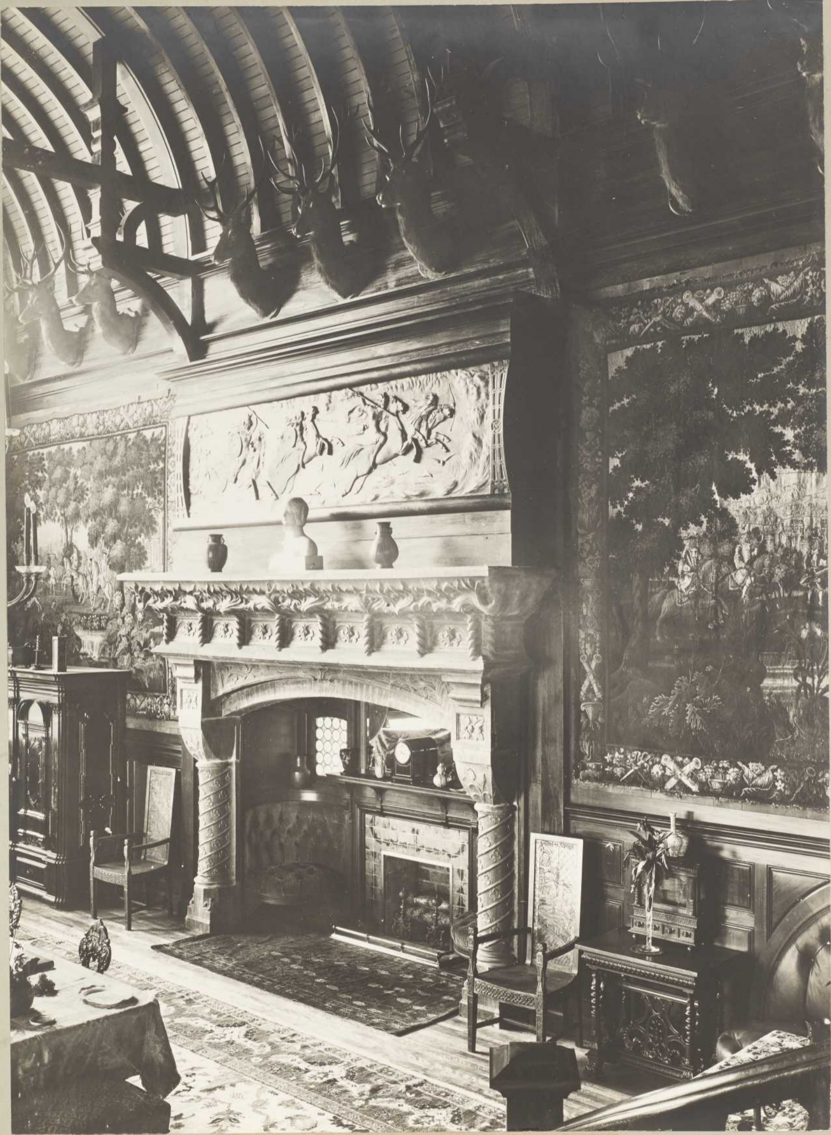
VILLA DE LA BAIE ELLIS — LE HALL (Anticosti)