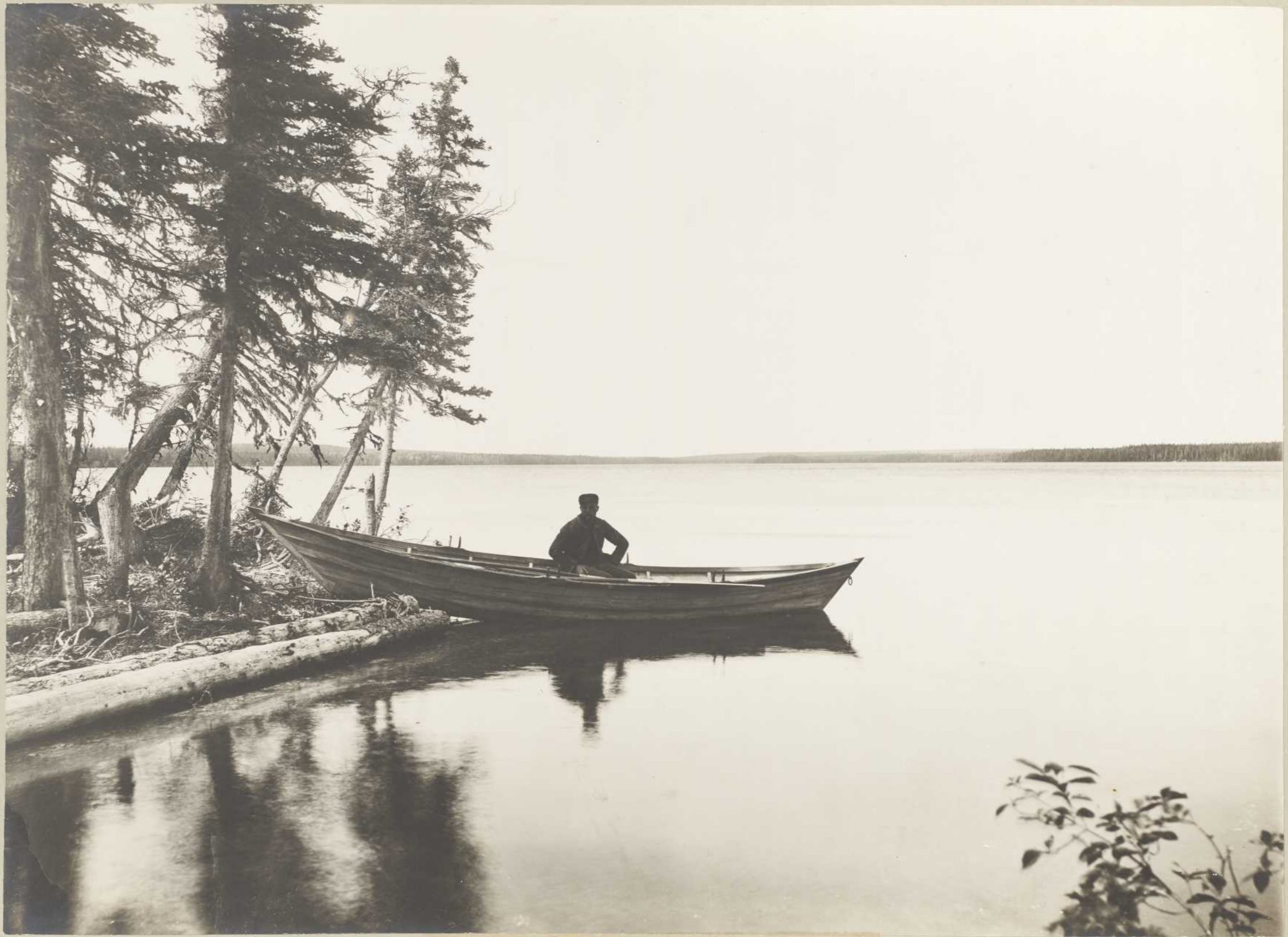
LAC PLANTIN (Anticosti)