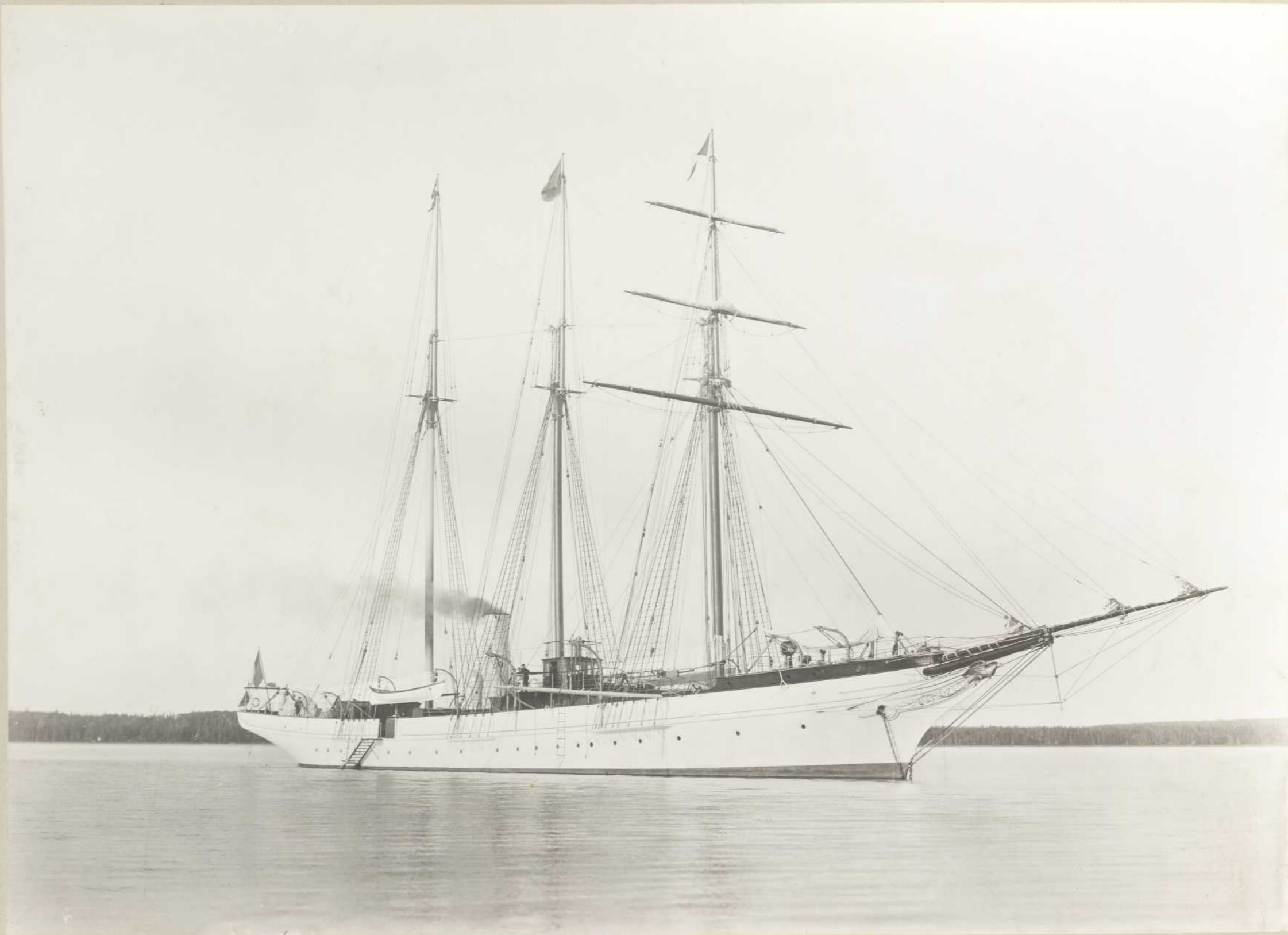
YACHT BACCHANTE, BAIE ELLIS (Anticosti)