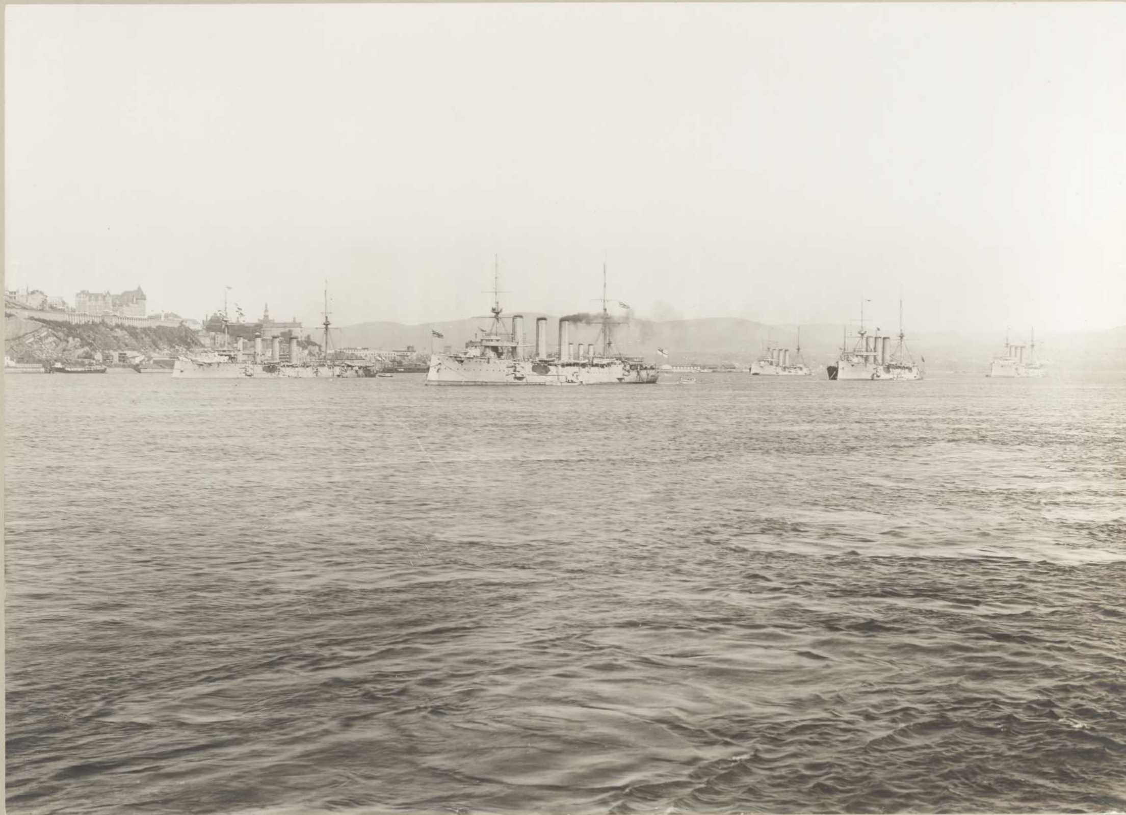
ESCADRE ANGLAISE A QUÉBEC