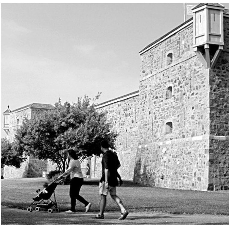
Le fort de Chambly, sur les rives du Richelieu en Montérégie, un joyau de Parc Canada où des troupes coloniales françaises seront au rendez-vous les 20 et 21 août.