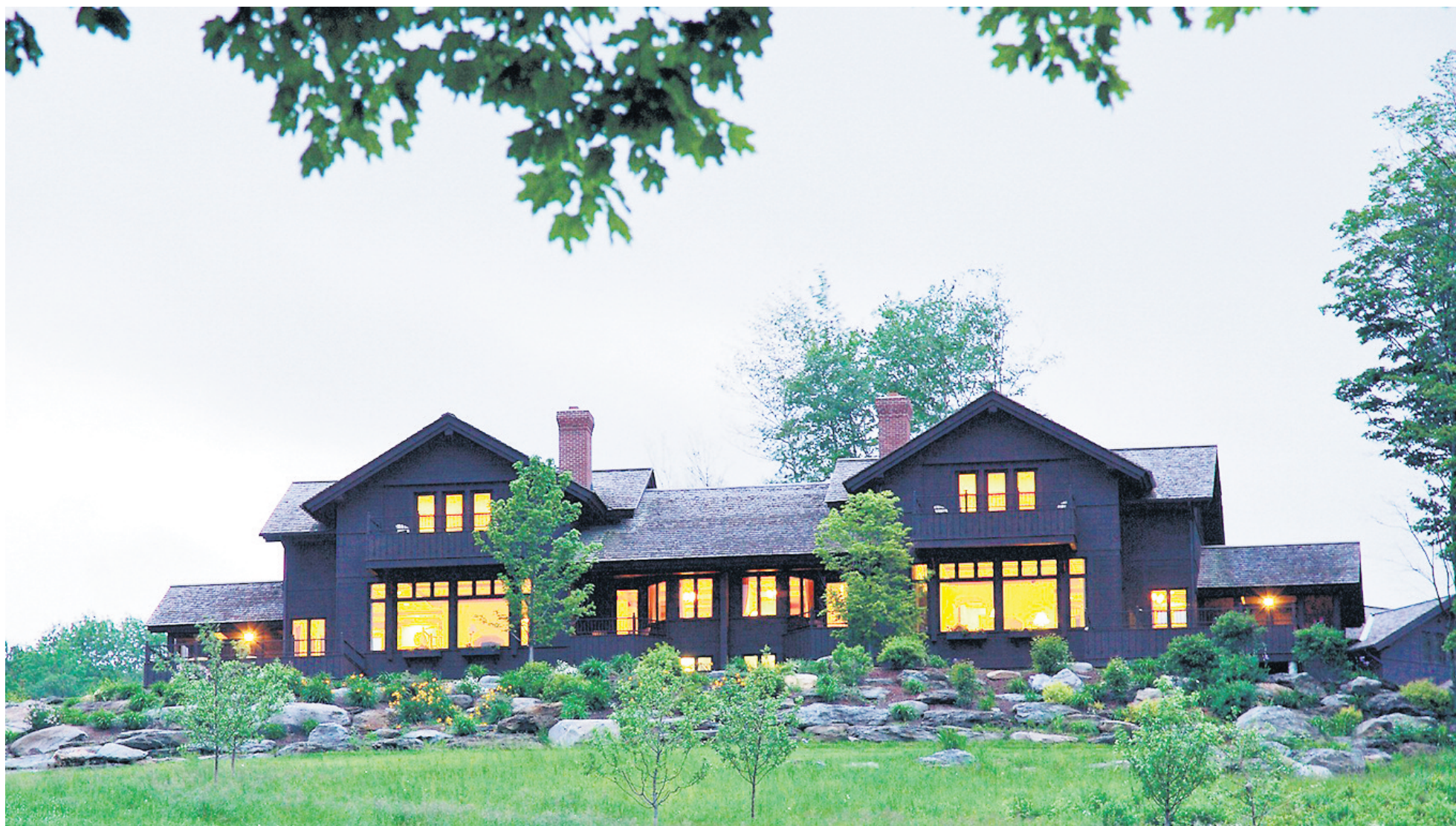
La nouvelle auberge a été inaugurée en décembre 1983 après l'incendie de l'ancien établissement.