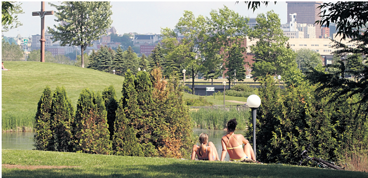
Le lieu historique Cartier-Brébeuf accueillera le 9 juillet les représentants de différentes communautés culturelles.

Cet été, que vous alliez en Minganie, en Mauricie, au Saguenay ou en Gaspésie, que vous partiez à la découverte des canaux de Lachine, de Carillon, de Chambly, de Sainte-Anne-de-Bellevue ou de Saint-Ours, des forges de Saint-Maurice, de la Grosse-Île, du phare de Pointe-au-Père ou des forts Lennox, Chambly, Témiscamingue ou, plus près de nous, des fortifications de Québec, de fort Saint-Louis et de fort Lévis, il y a de grandes chances que vous soyez partie prenante des célébrations du centenaire de Parcs Canada.