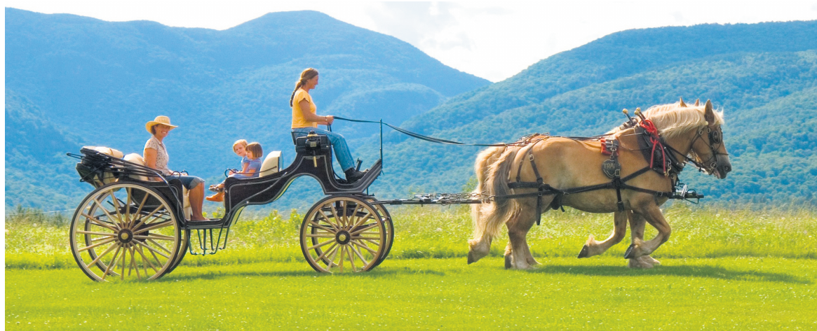
La promenade en carriole dans la vallée demeure une des activités préférées des enfants.

Johannes von Trapp, pdg de l'établissement. «C'est ici que j'ai grandi, c'est ma maison. Il y a toujours eu beaucoup de monde ici, j'ai sept sœurs et deux frères.»