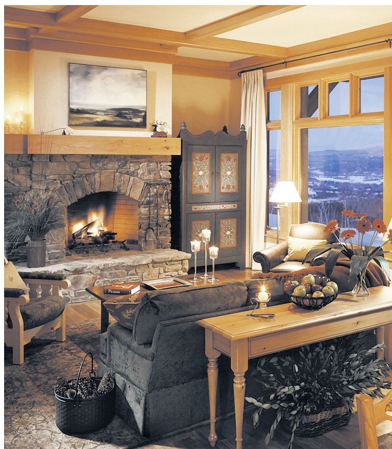
L'intérieur ne donne pas l'impression au client d'être dans un hôtel, mais bien dans une immense maison, en tant qu'invité particulier.

FORFAIT NUITÉE À L'HÔTEL ET STATIONNEMENT