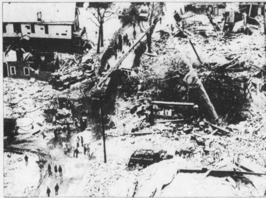
Voici le spectacle de désolation que présentait l'un des quartiers résidentiels de Buffalo qui a été réduit en ruines par une explosion de gaz propane faisant six morts et plus de 60 blessés. On peut distinguer les trois camions du service des incendies qui ne sont plus qu'un amas de ferraille.