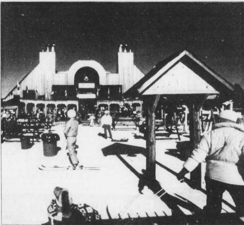
Mont-Saint-Sauveur : la cafétéria-bar au pied des pentes.

Il faut aussi mentionner que plusieurs centres des Laurentides offrent cette saison aux skieurs des cours de perfectionnement plus abordables. Ce sont, entre autres, l'Auberge Gray Rocks, la Villa Bellevue, Belle Neige, le Mont-Christie, le Mont-Saint-Sauveur. Ces cours, qui généralement s'étendent sur cinq jours, comptent de dix à vingt heures de leçons d'enseignement de groupe et coûtent de $70 à $115 environ.