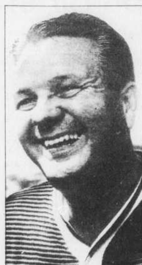
Le légendaire Jimmy Demaret est décédé d'une crise cardiaque à l'âge de 73 ans, hier.

Les Suédois et les Soviétiques, toujours invaincus en trois rencontres, dominent le classement, suivis des Canadiens, des Tchécoslovaques et des Finlandais qui ont remporté deux victoires et subi une défaite. Quant aux Américains, ils ont encaissé hier un troisième revers d'affilée. Ils ont déjà concédé 19 buts et ils n'ont marqué que quatre buts en trois matches. Les Allemands de l'Ouest et la Suisse occupent également le dernier rang.