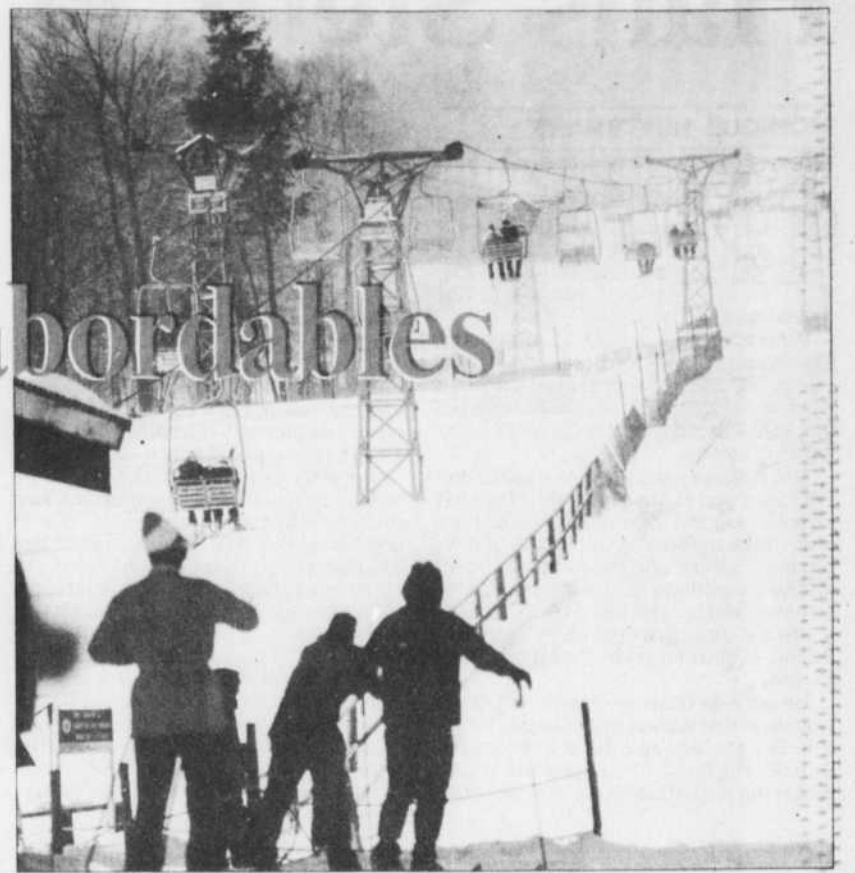
Au mont Tremblant.

Dans une catégorie légèrement supérieure, l'hôtel Alpine Inn, de Sainte-Marguerite, propose, à partir du 1er janvier, des séjours de cinq jours (du dimanche au vendredi) allant de $260 à $280 par personne (deux par chambre). Il faut ajouter à cela $90 pour le transport quotidien aux pistes, les remontées