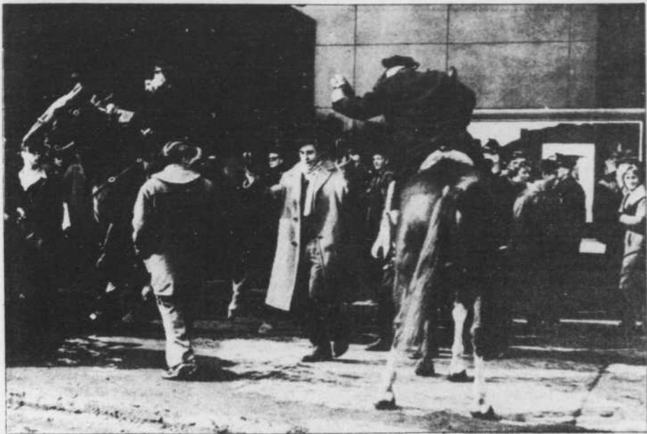
Les réalisateurs entonnent l'hymne national canadien tandis que les policiers, paniqués à l'idée de les voir prendre d'assaut les anciens locaux de Radio-Canada, chargent sur la foule. C'était il y a 25 ans....

Enfin, le jeune joueur, qui aurait été pressenti pour évoluer éventuellement pour le Canadien de Montréal, tient à participer à la joute des étoiles de lundi prochain, car il sait que tous les dépistés professionnels de talents y seront et Lemieux veut y être vu évoluant en regard de ses rivaux naturels.