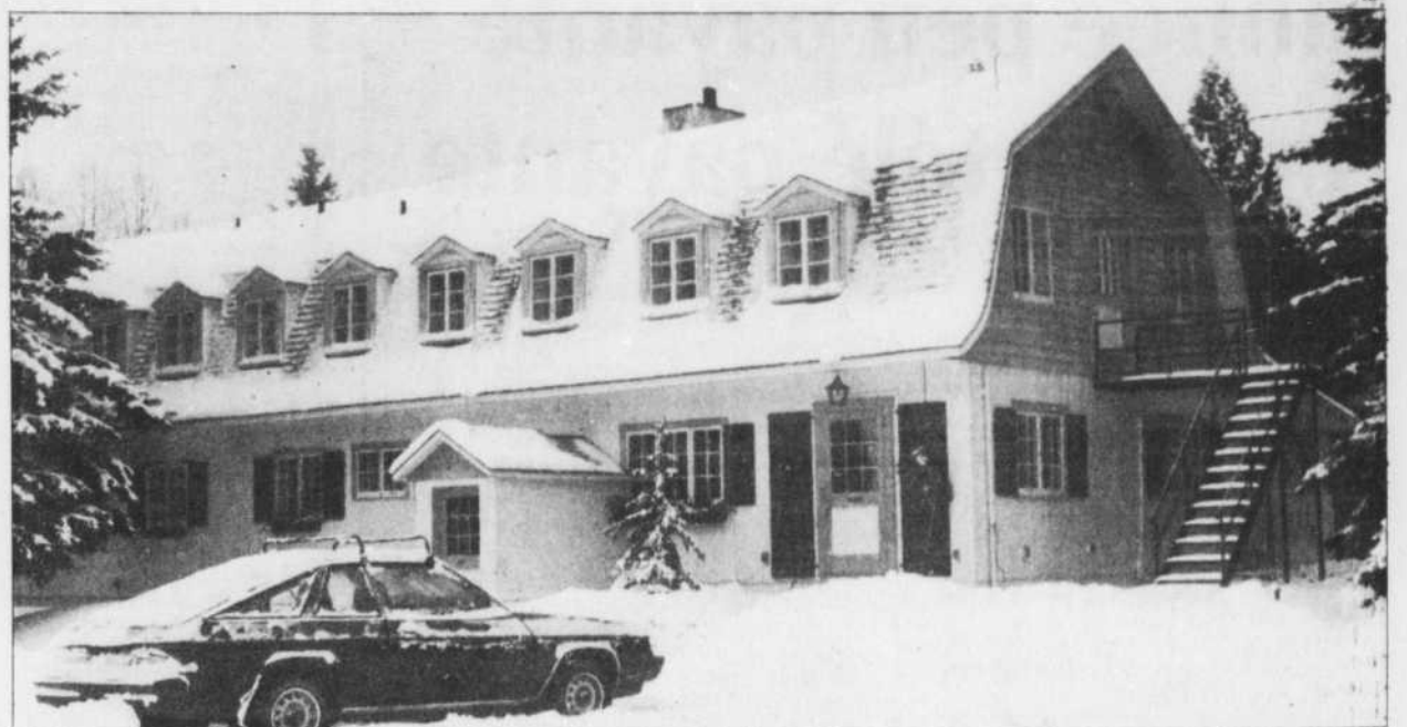
L'auberge du Château Beauvallon

Au cours de l'hiver — c'est-à-dire jusque vers la mi-avril —, l'auberge offre des séjours à prix forfaitaire de cinq à sept jours de ski au mont Tremblant tout proche. Les tarifs pratiqués incluent la chambre, deux repas par jour et éventuellement des leçons de ski, et