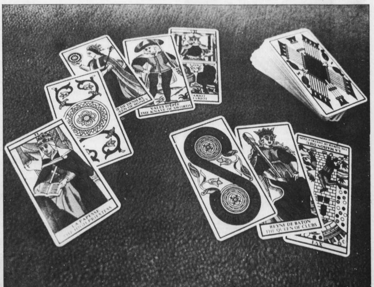
Les cartes du tarot de Grimaud (1748)