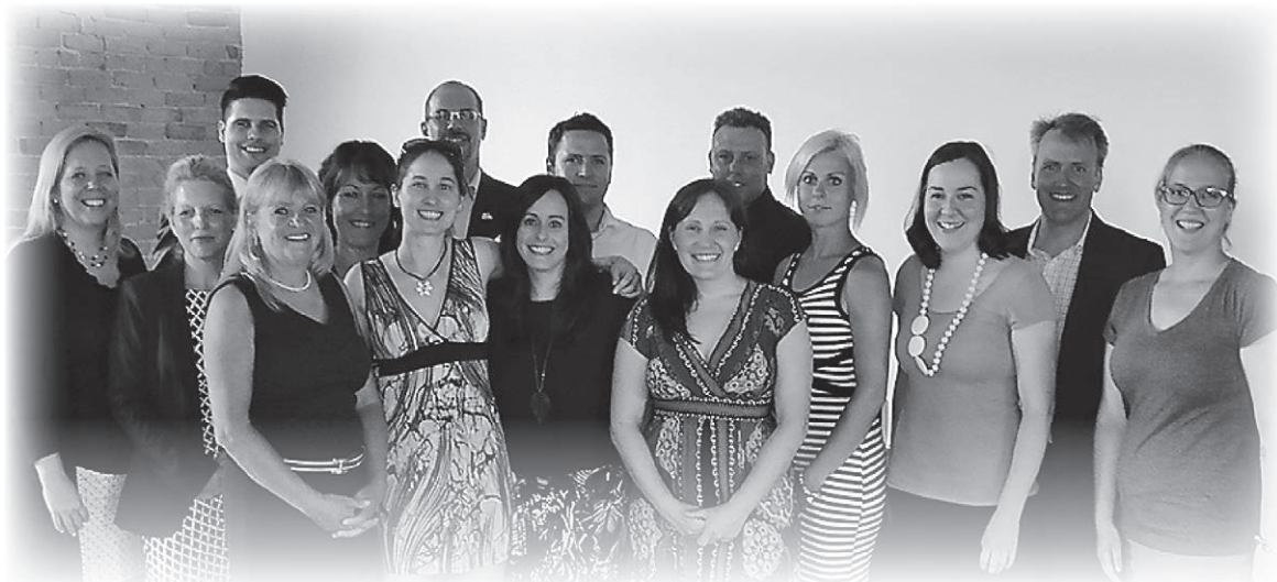
Dernière cohorte de sept entrepreneurs ayant complété la formation En affaires pour réussir en mai dernier, accompagnés des partenaires socio-économiques.

Possédant une excellente compréhension de la réalité de leurs clients, les SAE sont constamment en mode solution! Ils proposent une variété de services de formation et d'accompagnement à une