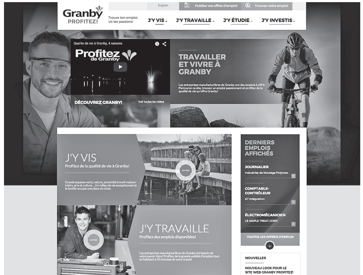
Voici la page d'accueil du site Granby Profitez

Soyez à l'affût des derniers emplois disponibles en consultant régulièrement Facebook et Twitter de Granby Profitez: www.facebook.com/granby.profitez