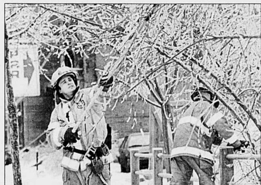
Des pompiers enlèvent des branches tombées près des fils électriques.