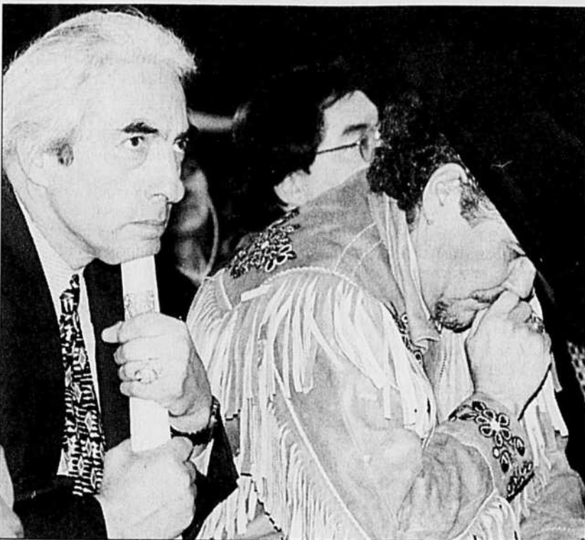
Le chef de l'Assemblée des Premières Nations, Phil Fontaine, et le président du Congrès des peuples autochtones, Harry Daniels, écoutent une leader autochtone dénoncer la déclaration fédérale d'hier.

Selon le chef de l'Assemblée des Premières Nations, Phil Fontaine, l'événement d'hier a marqué le début d'une nouvelle ère dans les relations entre Ottawa et les peuples autoch-