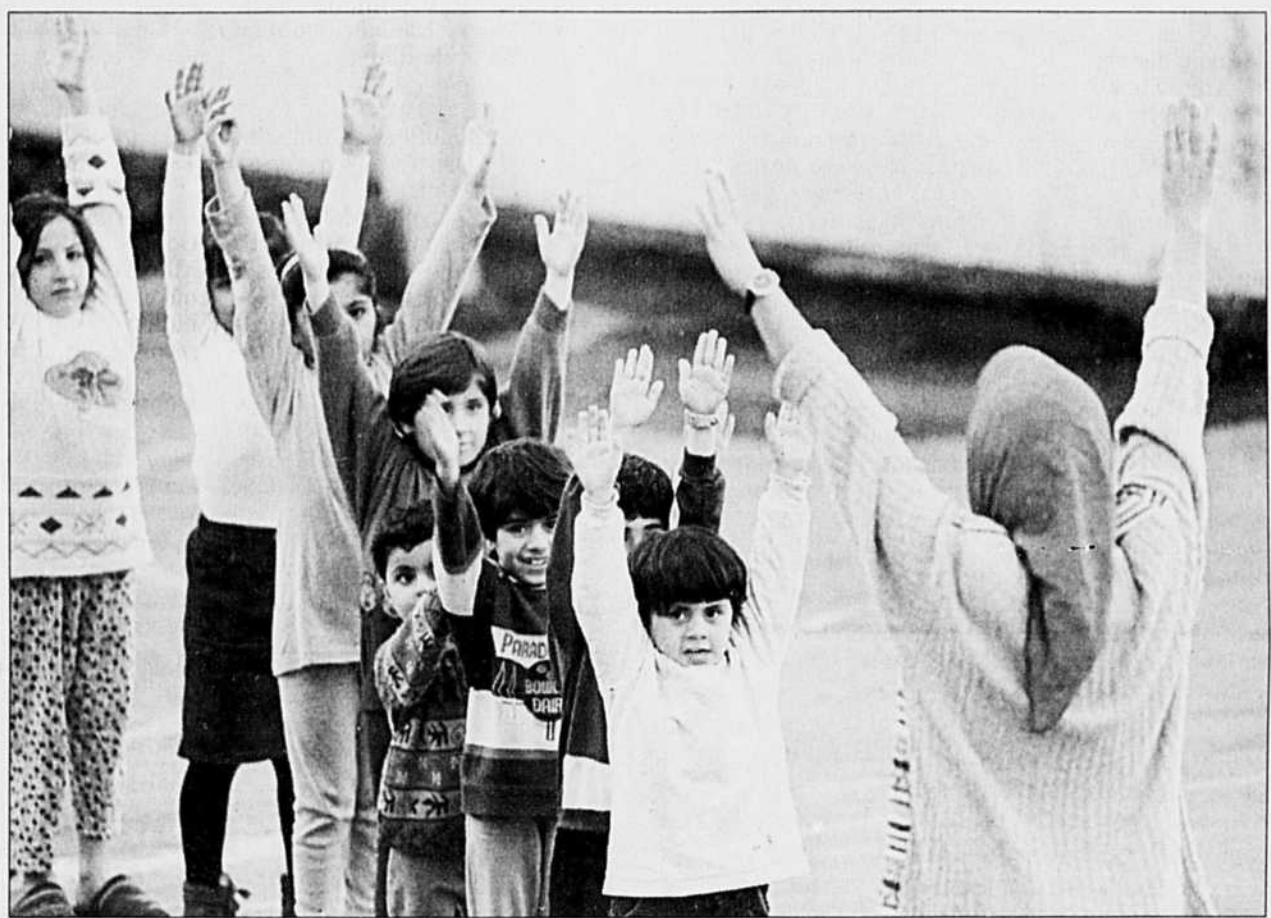
Des réfugiés kurdes d'origine irakienne ont fait hier un peu d'exercice dans la cour de camp de Agios Stefanos, au nord d'Athènes.

Ross devait revoir Netanyahu, puis Arafat, hier soir, ont indiqué des responsables. Sa mission est de préparer les entretiens qui doivent avoir les deux dirigeants, les 20 et 22 janvier, avec le président Bill Clinton à Washington.