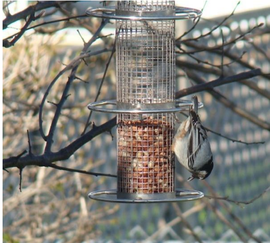
Sittelle aux arachides