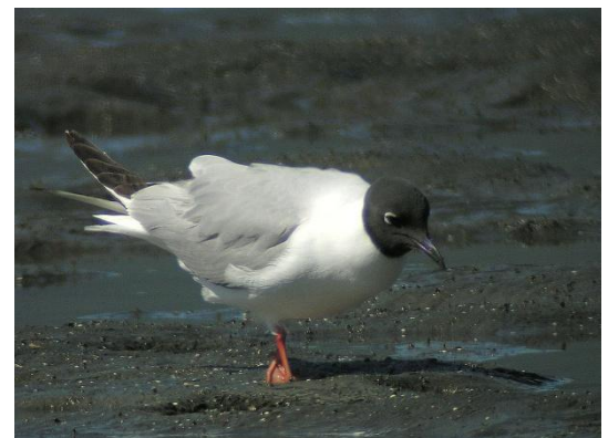
Mouette de Bonaparte

Encore une fois Michel a su nous transmettre sa passion et le souci des détails et des précisions à observer pour une identification adéquate et sans faille. À nous maintenant de mettre le tout en pratique.