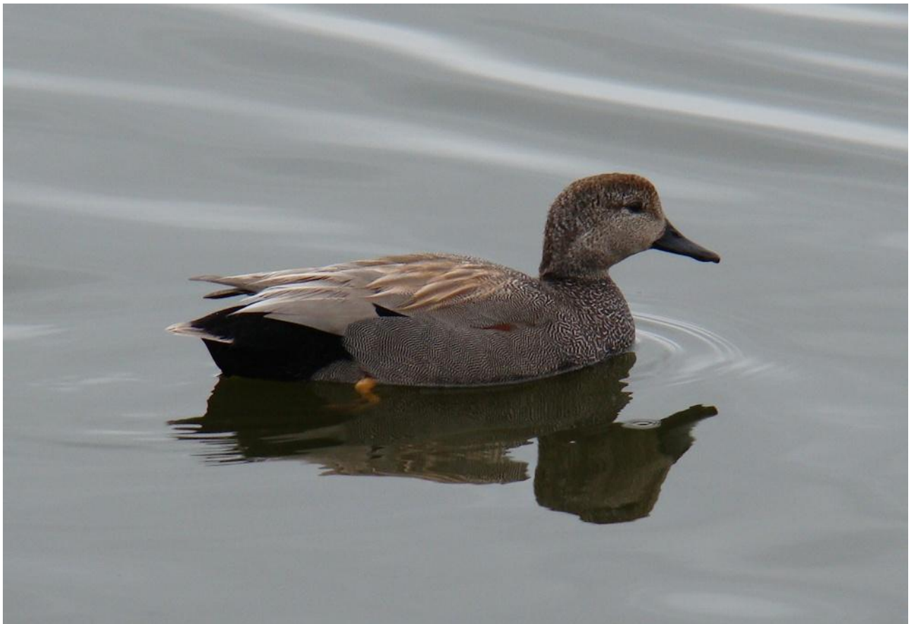
Canard chipeau et son reflet... 26 avril Baie-du-Febvre