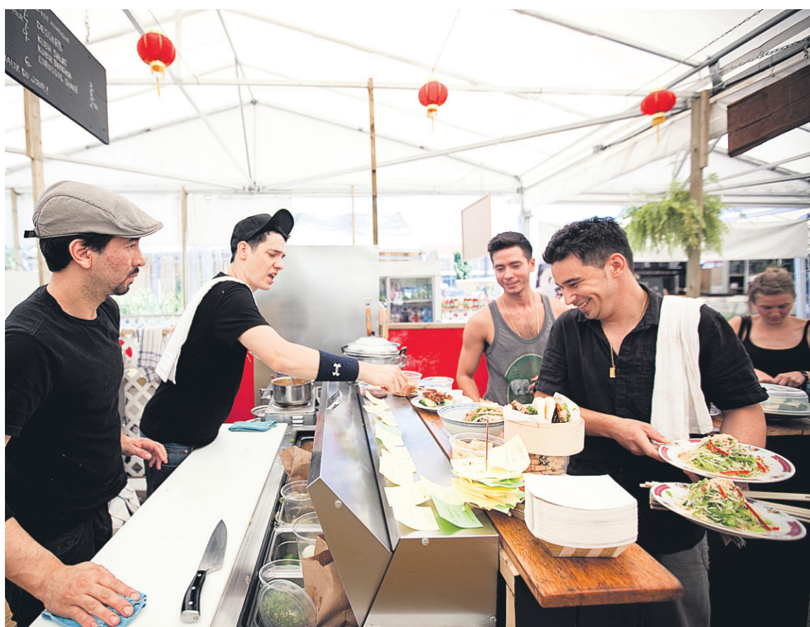
La petite équipe de Satay Brothers, principalement formée de deux frères polonais singapouriens et de leur maman, prépare une cuisine du Sud-Est asiatique savoureuse et accessible.

On y confectionne en effet des « buns » vapeur au flanc de porc mariné dans l'orange et l'anis étoilé qui, avec leurs touches acidulées de concombre mariné et le piquant frais d'oignons vert se rapprochent sérieusement de ceux du maître new-yorkais. (D'autres restau-