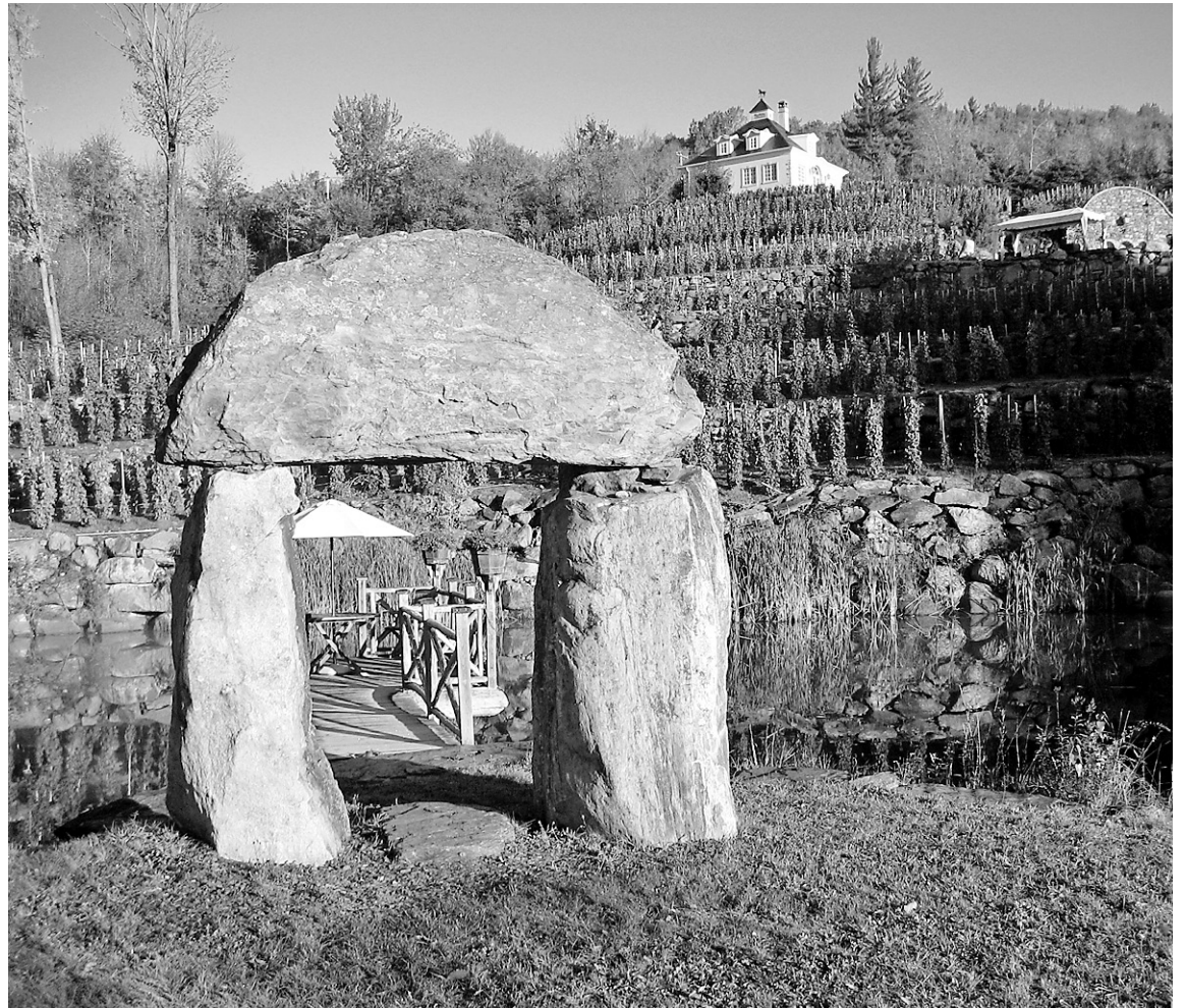
Le vignoble de la Chapelle Sainte-Agnès est lové entre les montagnes vertes du Vermont et celles de Sutton. Les vignes poussent sur 18 terrasses aménagées en étages.

La chronique Harmonies de François Chartier fait relâche jusqu'à la fin août.