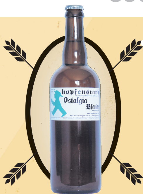
Ostalgie blonde Hopfenstark, 750 ml, 5%

Aussi rare que remarquable, la Dulcis Succubus est une bière de saison qui est particulièrement envoûtante, notamment parce qu'elle a été vieillie en fût de chêne ayant contenu un vin blanc botrytisé californien. Autrement dit, en plus de la saveur prononcée d'une bière rappelant une ale forte belge, cette bière à la fois dorée et ambrée est aussi caractérisée par des arômes de miel et de petits fruits qui trahissent son vieillissement particulier.