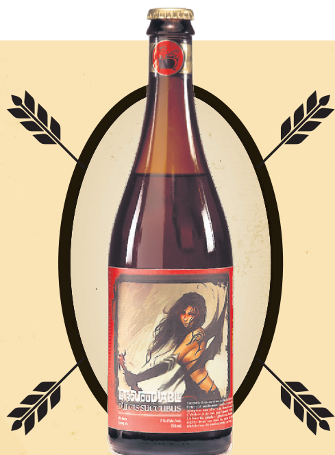
Dulcis Succubus Trou du Diable, 750 ml, 7%

Aussi rare que remarquable, la Dulcis Succubus est une bière de saison qui est particulièrement envoûtante, notamment parce qu'elle a été vieillie en fût de chêne ayant contenu un vin blanc botrytisé californien. Autrement dit, en plus de la saveur prononcée d'une bière rappelant une ale forte belge, cette bière à la fois dorée et ambrée est aussi caractérisée par des arômes de miel et de petits fruits qui trahissent son vieillissement particulier.