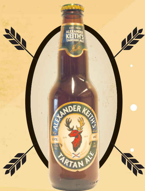
Tartan ale Alexander Keith's, 341 ml, 6,1%

La Pale Ale St-Ambroise du brasseur montréalais McAuslan n'est pas une nouveauté. Elle demeure un des secrets les mieux gardés de votre épicerie. Cette pale ale d'inspiration américaine est plus douce qu'amère. Elle se compare avantageusement, côté goût, à ce qu'on trouve tant du côté des rouses que des blondes un peu plus légères. Ceux qui se demandent à quoi peut ressembler une bonne bière de microbrasserie, à l'aise sur la terrasse comme dans la chaloupe, n'ont pas à chercher plus loin.