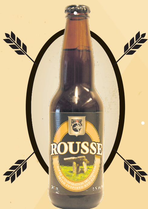
Rousse Brasseurs du Monde, 341 ml, 5%

Cette microbrasserie est, dit-on, le secret le mieux gardé de L'Assomption, d'où elle vend ses Ostalgie blonde et rousse jusque dans les estaminets les plus branchés de New York. Elle est cependant peu connue au Québec, détail qu'on corrige à l'instant, car elle le mérite. Des deux, l'Ostalgie blonde est peut-être la plus surprenante, avec ses arômes épicés et fruités et sa saveur d'abord citronnée, puis alcoolisée et, finalement, assez amère. Ça ne l'empêche pas d'être superbement désaltérante, et avec un taux d'alcool assez modeste, ça en fait une charmante compagne de terrasse.