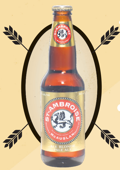
St-Ambroise Pale Ale McAuslan, 341 ml, 5%

La rousse est sans doute la meilleure des bières embouteillées des Brasseurs du Monde. Rappelant les ales irlandaises, elle a des accents de caramel, de petits fruits et d'herbes qui illustrent bien l'équilibre de ses ingrédients. Ça en fait une excellente rousse, digne de remplacer des produits importés pour une fraction du prix.