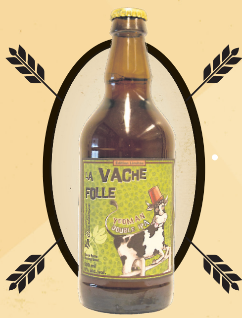
Vache Folle Double IPA Yeoman Microbrasserie Charlevoix, 500 ml, 8%

Même si Alexander Keith's fait désormais partie de l'énorme multinationale AB-InBev, ça n'empêche pas ce brasseur de Halifax de cultiver ses racines canadiennes et écossaises. Tout à son honneur, d'ailleurs. Malgré des ratés (la Dark Ale, notamment), elle sait surprendre. La Tartan Ale est une de ces agréables surprises. Il s'agit d'une Scotch Ale sucrée, maltée et aucunement amère qui plaira à ceux qui en sont à leurs premières armes au-delà des lagers de très grande diffusion.