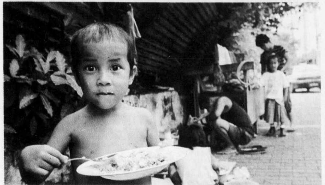
Plusieurs pays vivent des crises alimentaires. Aux Philippines, par exemple, on estime à près de trois millions le nombre de personnes qui souffrent de famine. Sur cette photo, cet enfant de Manille profite d'un repas forni par un organisme d'aide.

En outre, «après avoir connu plus d'une décennie de résultats nuisibles dus à l'OMC», une éventuelle extension de l'influence de l'Organisation rencontrerait «une forte opposition des populations dans de nombreux pays, aussi bien pauvres que riches», note-t-elle. Pour ATTAC, un accord «aurait