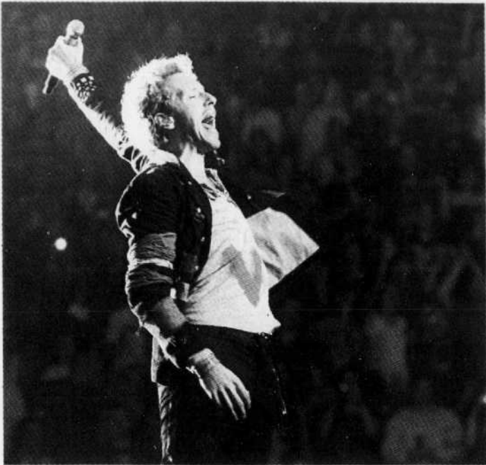
Le chanteur Chris Martin semblait particulièrement en forme, sautant d'un côté à l'autre de la scène du Centre Bell, se moquant de ses petites erreurs.