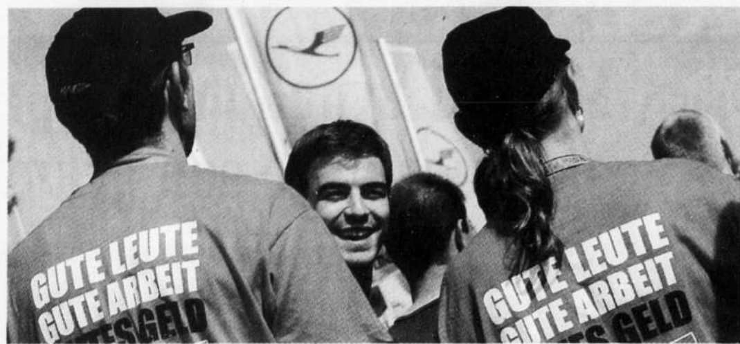
Des employés en grève ont manifesté, hier, à Francfort.