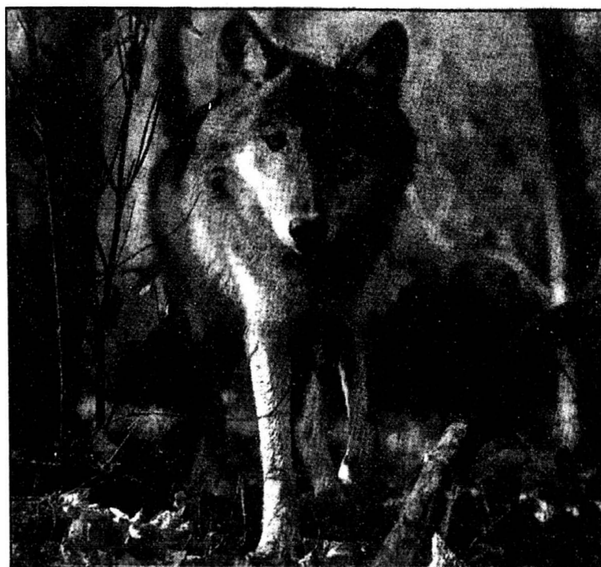
Le loup est un coureur de fond qui peut parcourir 25 km par jour avec des pointes de 55 kmh.

Ouële leu leu Animal très sociable en fait, pres-