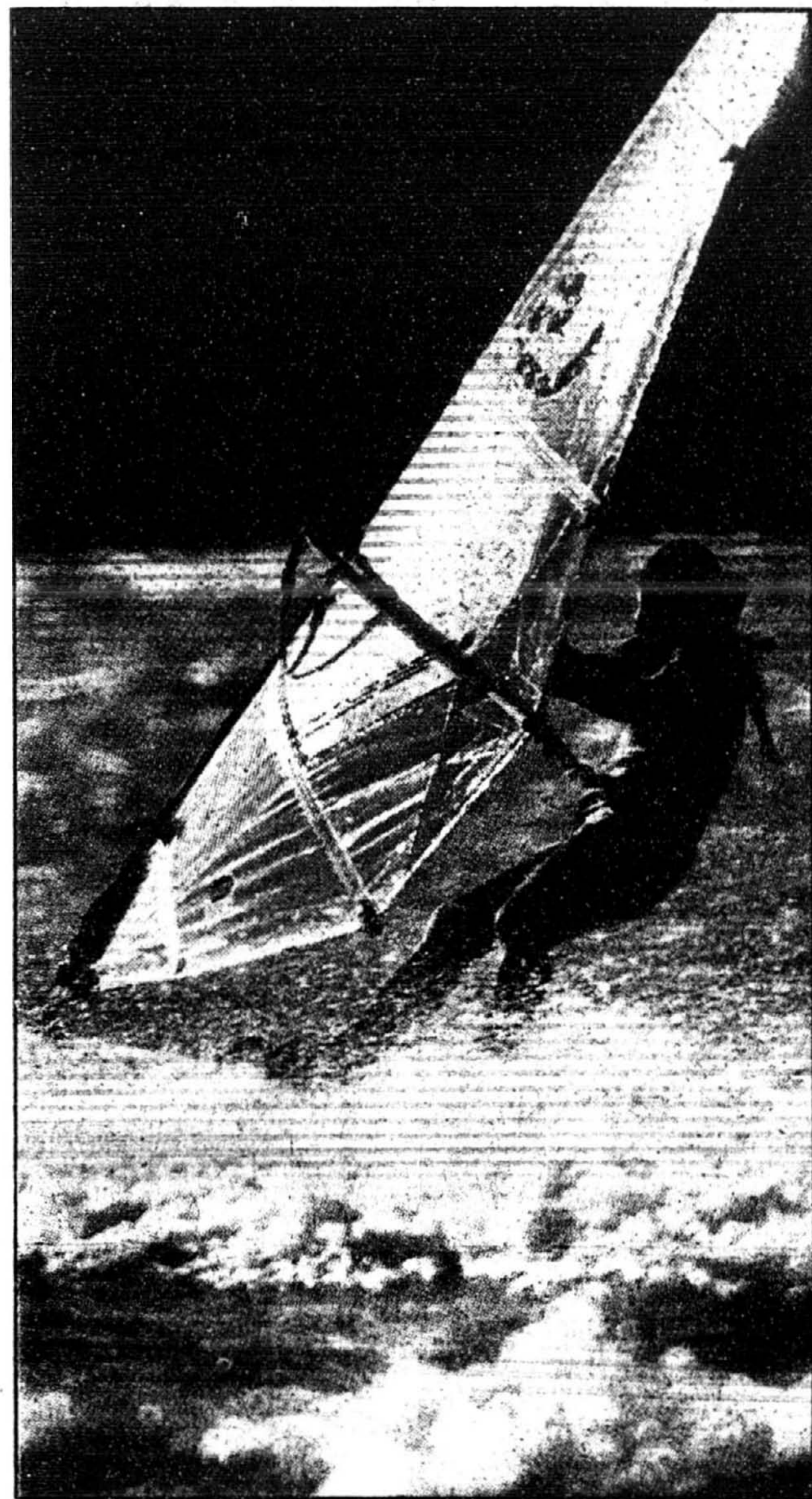
Hier matin, c'est par dizaines que les amateurs de planche à voile, vêtus d'une combinaison isolante, se sont retrouvés sur le lac des Deux-Montagnes, plus précisément dans le parc régional de la CUM de l'Anse à l'Orme, situé boulevard Gouin, pour s'adonner à leur sport de prédilection.