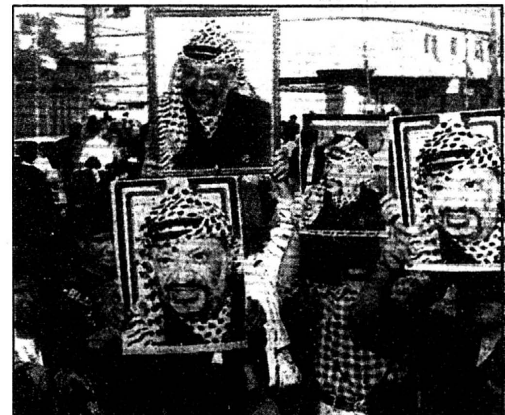
«Arafat, reprends tes ministres et va-t-en», ont scandé hier quelque 2000 manifestants intégristes en défilant dans Gaza.