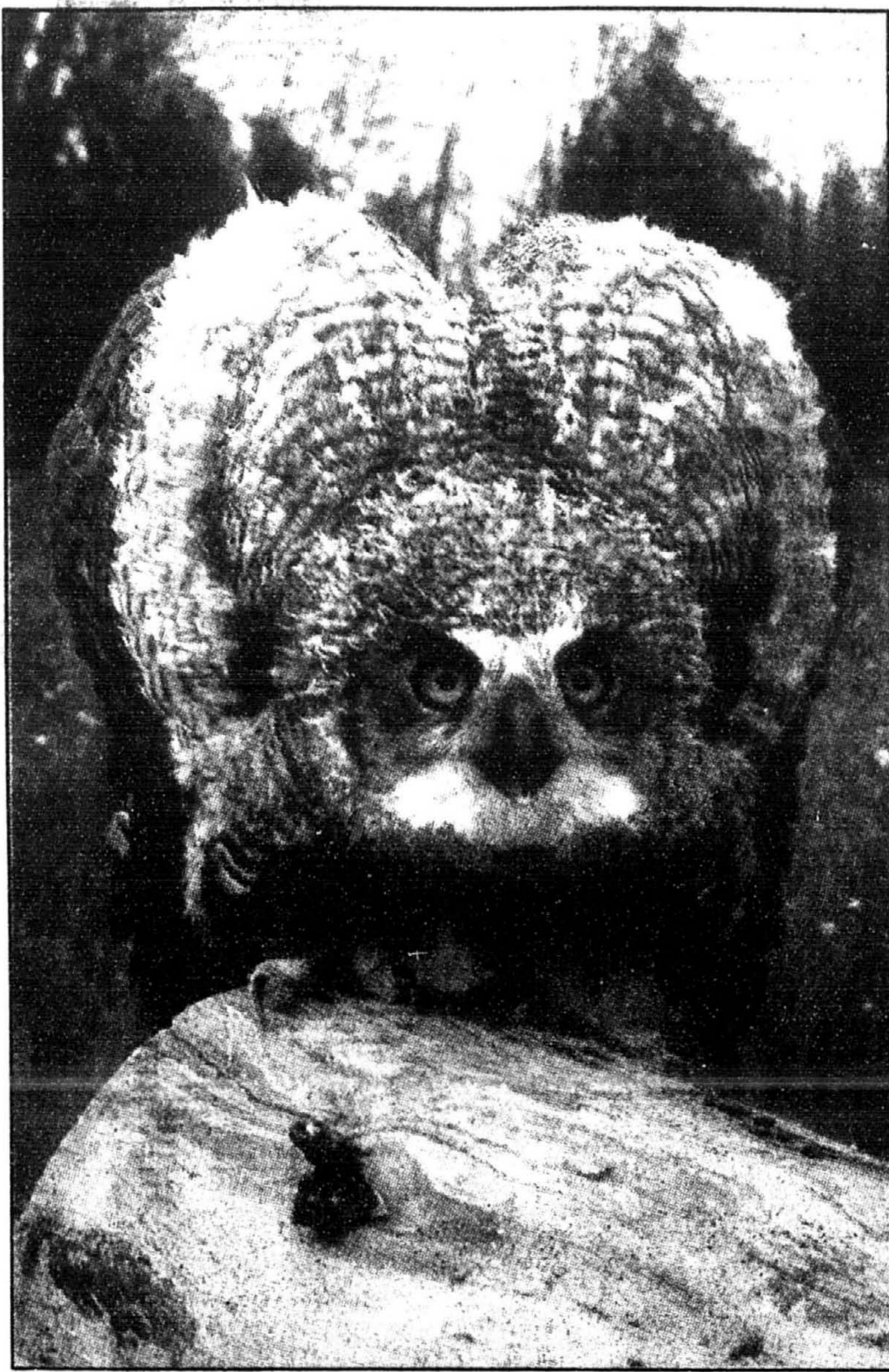
Un jeune grand duc, à peine sorti du nid, essaie de faire peur aux intrus.

Comme chez toutes les espèces de hiboux, le vol de la chouette rayée est parfaitement silencieux. Leurs plumes aux rebords duvetés absorbent bien tous les bruits causés par le passage de l'air lors du vol. Les yeux des hiboux sont situés sur le devant de la tête, contrairement à la plupart des oiseaux, et ils ont une vision excellente. La plupart chas-