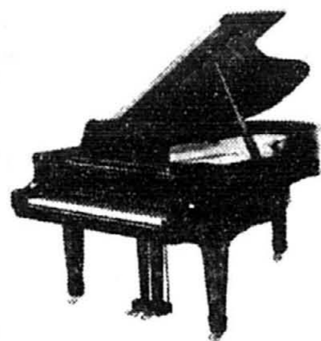
Transport inclus - accord gratuit (taxes en sus)