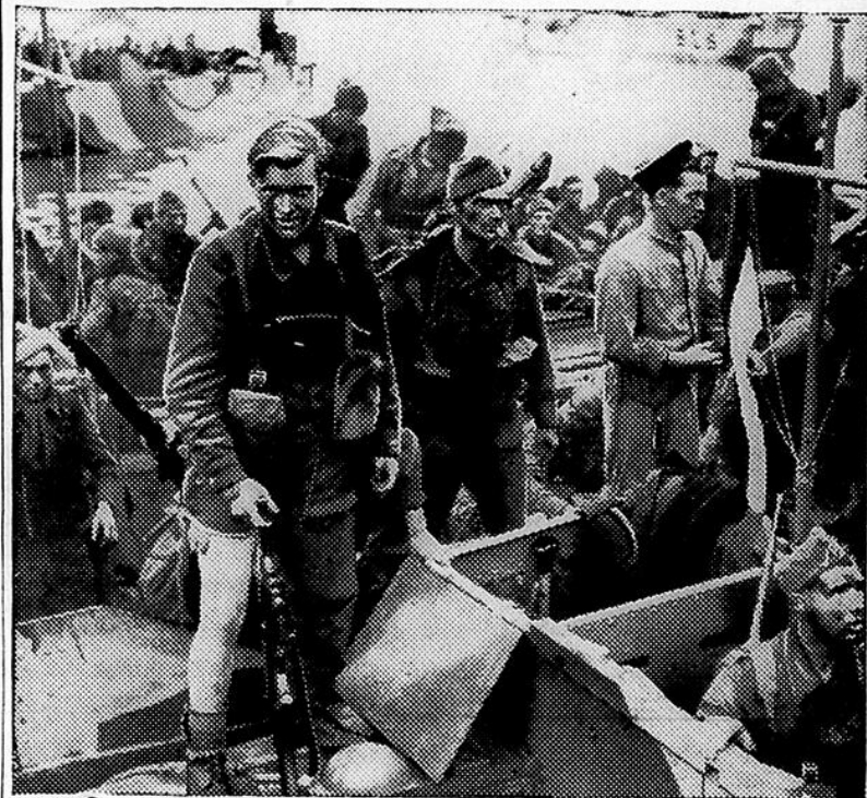
Le retour du raid sur Dieppe, le 19 août 1942, alors que des milliers de Canadiens sont débarqués à l'un des points les mieux fortifiés de la côte française occupée et ont tenu leurs positions durant neuf heures. Le soldat qui débarque d'une barge à moteur a perdu une partie de son pantalon mais les Allemands ont probablement payé her cce trophée.

Mélangez bien ensemble la moutarde, le sel, le sucre en poudre, le poivre de Cayenne, les jaunes d'oeufs puis ajoutez le vinaigre. Ajoutez ensuite l'huile à salade graduellement, goutte par goutte, en battant constamment. Au fur et à mesure que le mélange s'épaissit, éclaircissez avec du vinaigre ou du jus de citron. Ajoutez l'huile et le vinaigre ou le jus de citron alternativement jusqu'à ce qu'il n'en reste plus, en remuant ou battant constamment. Vous pouvez vous servir d'une batteuse d'oeufs. Il est bon de mettre le bol dans un contenant rempli de morceaux de glace ou d'eau glacée.