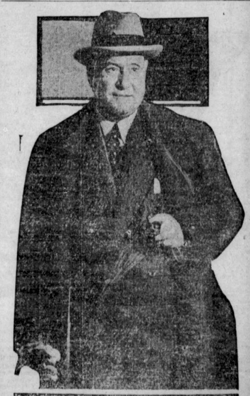
SIR HENRY THORNTON, président du C.N.R., à son arrivée à New-York après un séjour en Europe. Cette photographie a été prise lorsque le paquebot est arrivé au quai.