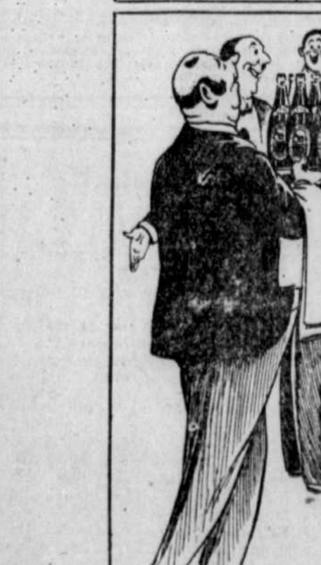
ET JUSTE COMME TU SONGEAS SÉRIEUSEMENT À T'ESQUIVER, ON APPORTE DE LA BIÈRE BLACK HORSE BIEN FRAPPÉE.

dites simplement — "Bière Black Horse Daves s.v.p.!"