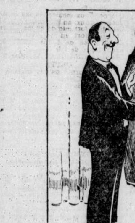
TAS-PAS DÉJÀ ÉTÉ INVITÉ À UN "STAG PARTY" PAR UNE CONNAISSANCE D'AFFAIRES DONT TU SOLICITAS UNE IMPORTANTE COMMANDE? TU ACCEPTES PAR INTÉRÊT, MAIS ARRIVE SUR LES LIEUX, NE CONNAISSANT PERSONNE, TU TE SENS COMME UN POISSON HORS DE L'EAU.