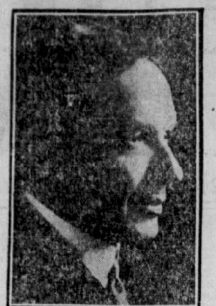
M. W. C. DURANT, manufacturier d'automobiles et fondateur de la General Motors, vient d'arriver à New-York. Il a fait un voyage de quelques semaines en Europe.

Tel est le titre de la causerie que fera le ministre de la justice, M. Ernest Lapointe, mercredi soir, le 31, à 7,30 heures, au Mont-Royal, à l'issue du dîner que lui offriront les membres du Comité provincial du suffrage féminin.