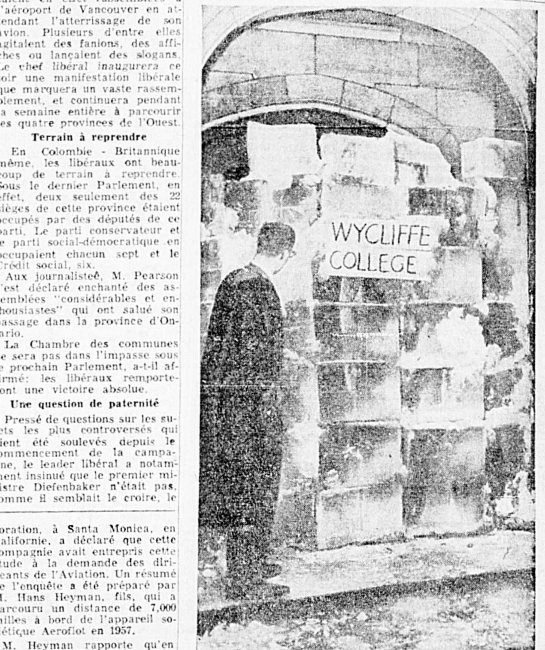
UN TRUC DE SAISON: — Les étudiants de Trinity College, affilié à l'université de Toronto, ont travaillé une partie de la nuit pour bloquer l'entrée principale du collège avec cette glace. Mais la peine en a valu apparemment le plaisir de voir au matin professeurs et étudiants hésiter entre passer par la porte arrière ou tenter d'enfoncer le mur de glace.