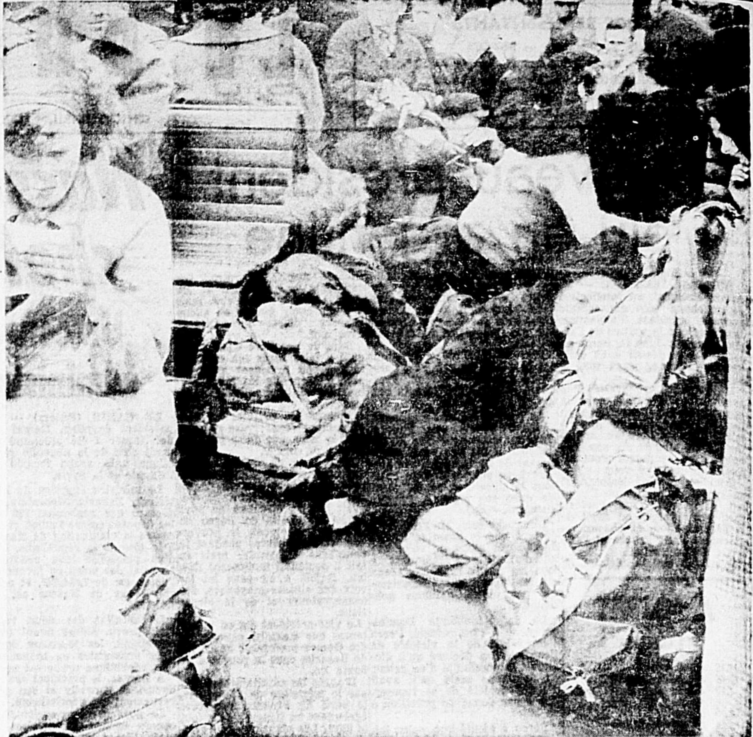
LE CONFORT DES EUROPEENS est loin de celui qu'on retrouve en Amérique.

M. Pearson a dit enfin que fin d'après-midi d'octobre dernier il devient premier ministre il s'efforcera de faire disparaître tout ce qui nuit présentement à ses relations commerciales qu'ont entre elles les nations de l'Alliance Atlantique.