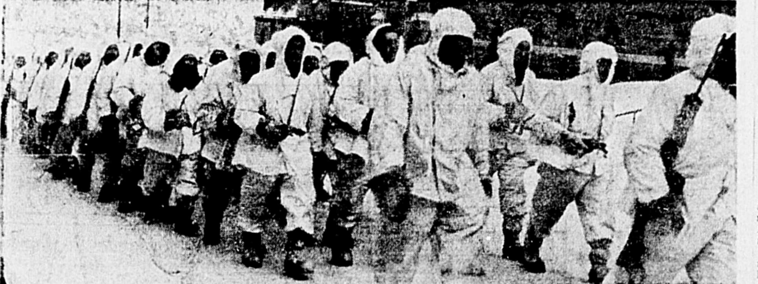
LES GARS DU 22, vêtus du camouflage de neige, la mitraillette au bras, ont défilé samedi midi dans Jonquière. Kenogami et Chicoutimi, au terme des manœuvres d'hiver qui ont eu lieu durant quinze jours au lac Kenogami. Ils montent la rue Bégin, près de la Cathédrale.

Une formule d'inscription sera adressée aux congressistes désireux de faire l'une ou l'autre des tournées.