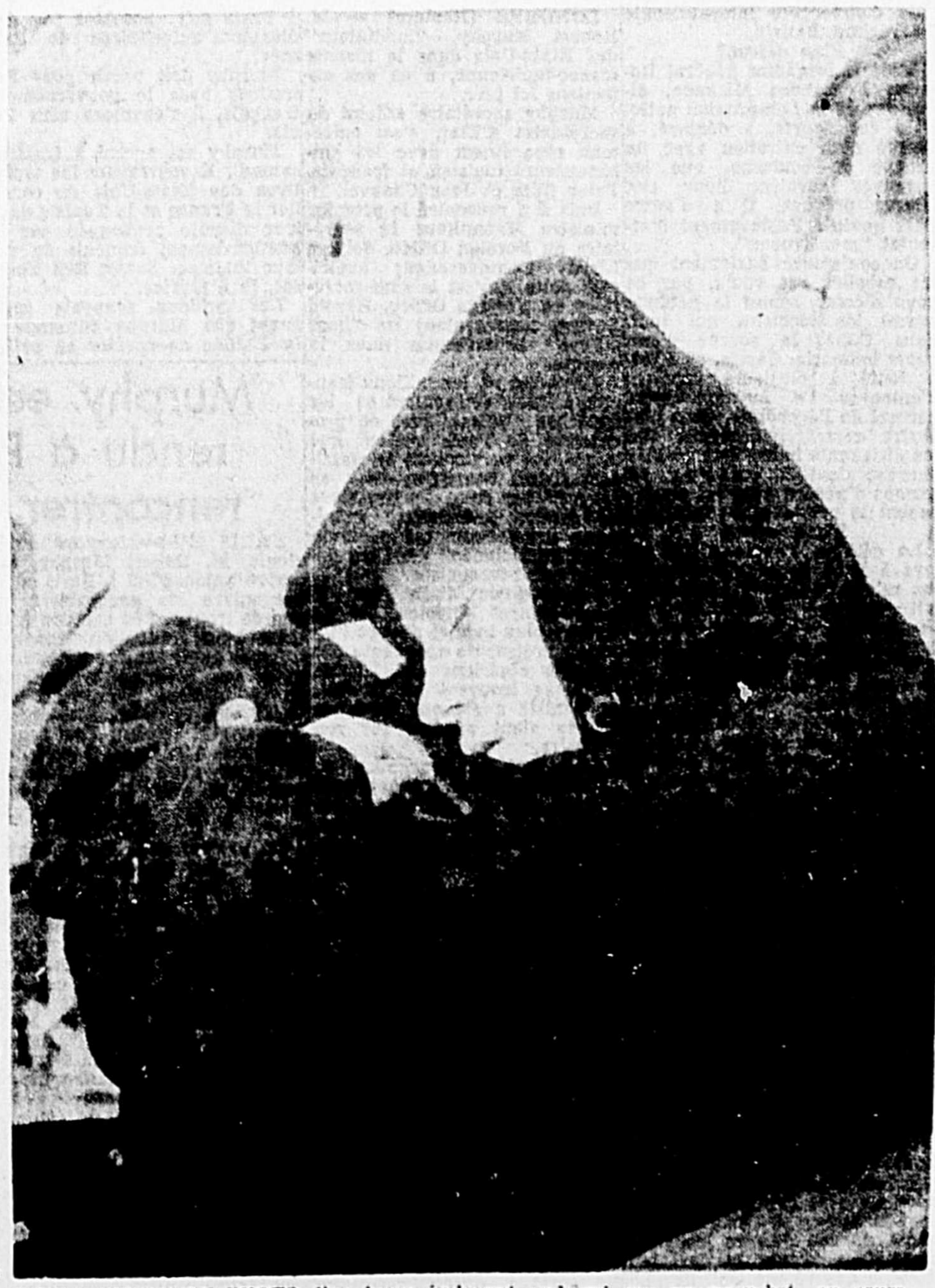
UNE SAISSANTE PHOTO d'un jeune émigrant endormi sur un paquebot, au cours d'une traversée sur l'Atlantique-nord.

LORSQU'UN HOTEL vieux de 75 ans, a été complètement détruit dans un incendie à Long Branch, en Ontario, les témoins du désastre ont pu voir ce cambrieur clandestin aller se réfugier à l'abri des flammes. En plus de ce rat, qui était l'un des derniers à quitter l'établissement en flammes, 20 sergents et patrons de la vermine ont été également pris et rapidement contactés avec l'air glacé du dehors.