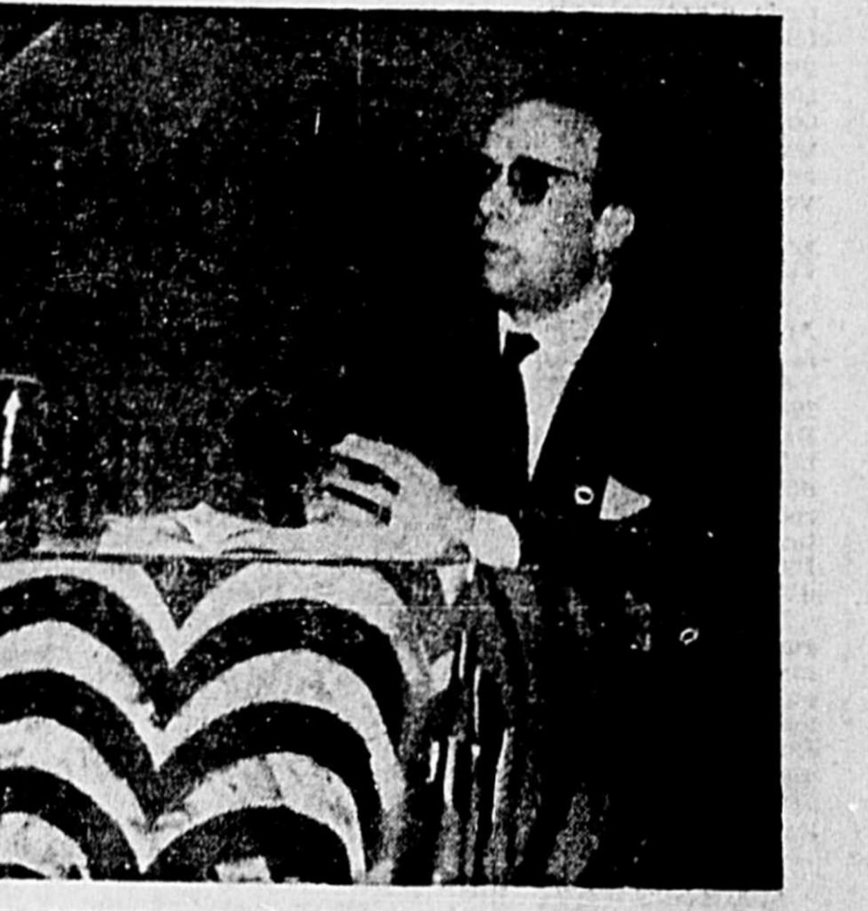
LE CRITIQUE DE RENOM Pierre de Boisdeffre s'est penché sur l'oeuvre du prestigieux Jean Anouilh, sur l'invitation de la Société d'étude et de conférences, hier soir. Une vision claire d'un théâtre bien typique d'aujourd'hui a été présentée avec brio.