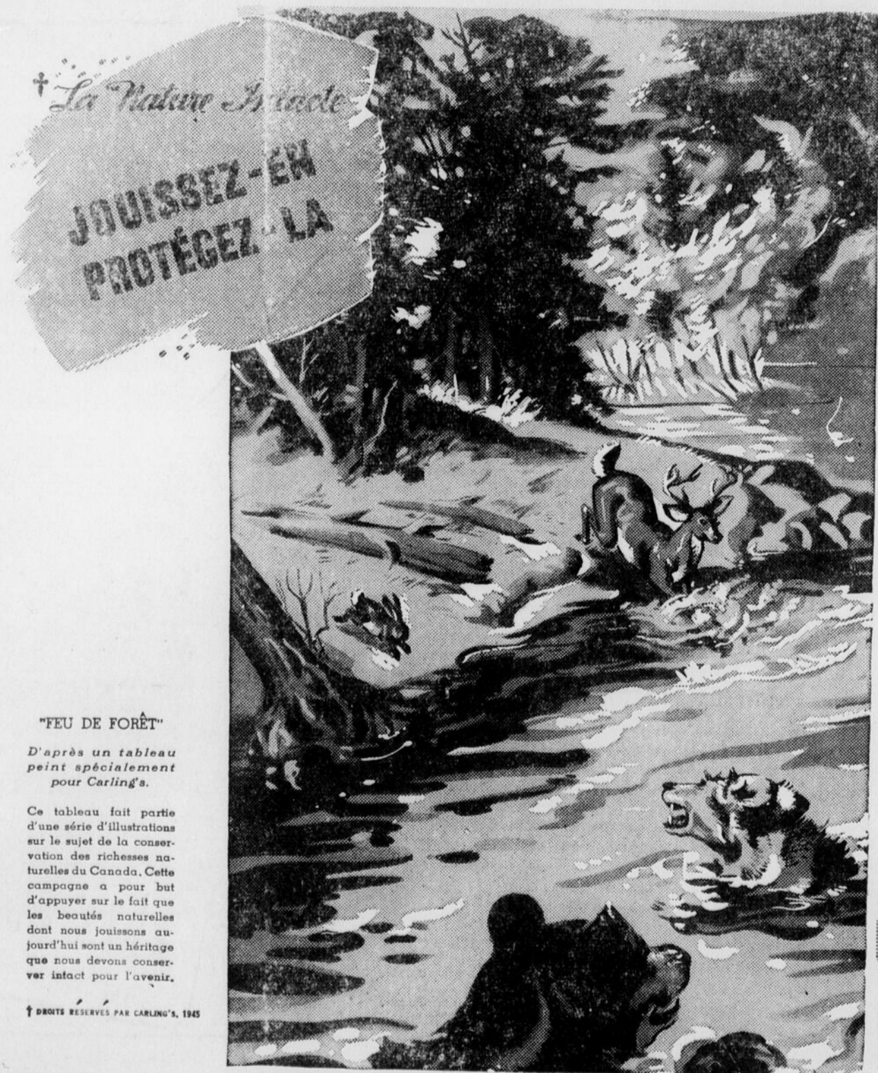
"FEU DE FORÊT"

D'après un tableau peint spécialement pour Carling's.