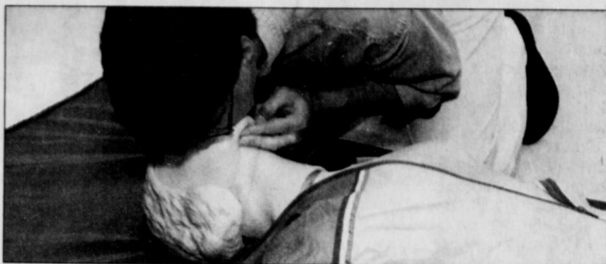
1000 étudiants recevront 25 heures de formation.

Les événements permettront probablement à la poly des Rives de devancer son échéancier de formation en réanimation cardiorespiratoire. La piscine de l'institution étant fermée pour l'année en raison de travaux majeurs de rénovation, la