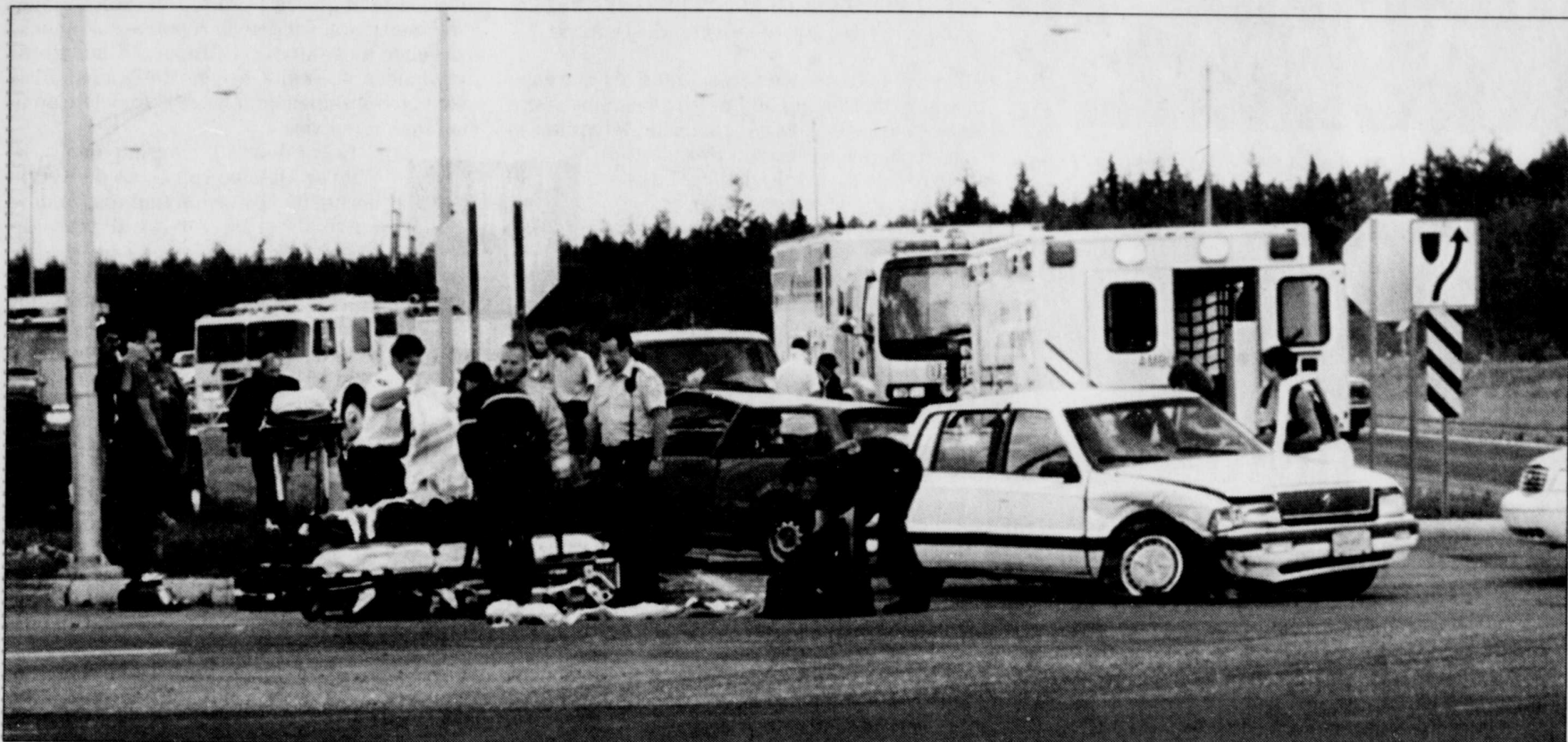
COLLABORATION SPÉCIALE, MARC LAROUCHE

Un accident qui a fait six blessés s'est produit hier vers 16 h 50 à l'intersection de la route 185 et du boulevard de la Plaine, à Rivière-du-Loup. Selon le sergent Boulet, de la SQ, c'est le scénario habituel qui s'est produit, à savoir qu'un véhicule circulant sur la 185 en direction sud a été heurté de plein fouet par un autre roulant en direction nord, alors qu'il s'engageait sur le boulevard de la Plaine. Les six blessés ont été conduits au centre hospitalier régional du Grand-Portage de Rivière-du-Loup, et l'on ne craint pas pour leur vie. M. L.